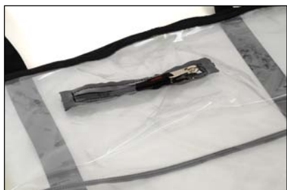
Ouverture pour perfuser

Préserver la chaîne d'évacuation de la contamination