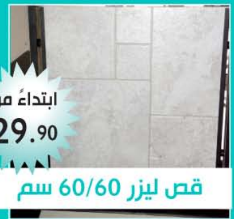
قص ليزر 60/60 سم

كراميكاً بطاح .. الأول في مجال الكراميك بالمنطقة ..