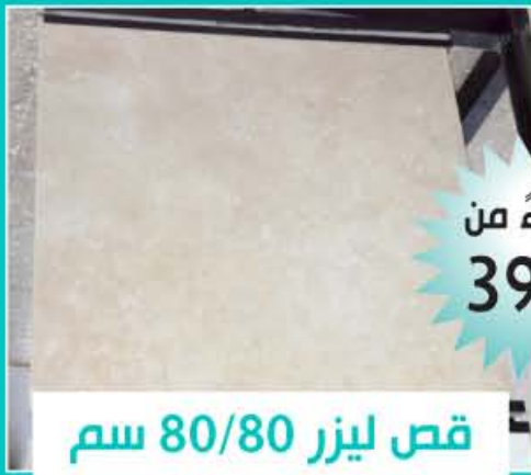
قص ليزر 80/80 سم