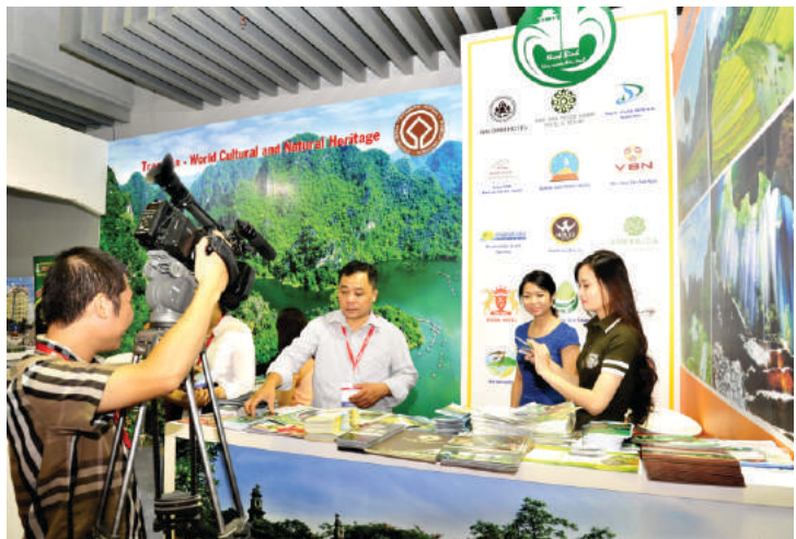
Hoạt động quảng bá xúc tiến du lịch tại hội chợ ITE HCM

tiến quảng bá du lịch, Trung tâm Xúc tiến Du lịch được thành lập từ năm 2001 tiền thân là Trung tâm Xúc tiến Đầu tư phát triển Du lịch Ninh Bình. Dưới sự chỉ đạo của các cấp, các