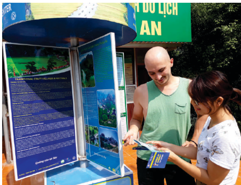
Hướng dẫn bộ quy tắc ứng xử cho du khách

Thời gian qua, Trung tâm đã nhận được sự quan tâm sát sao của lãnh đạo Sở cũng như các ban, ngành có liên quan và chính quyền địa phương nơi có khu, điểm du lịch để Trung tâm hoạt động ngày càng hiệu quả hơn. Công tác hỗ trợ khách du lịch được kịp thời giải quyết đã tạo sự hài lòng, vui vẻ cho khách du lịch, góp phần xây dựng môi trường du lịch thân thiện, văn minh, đáp ứng nhu cầu ngày càng cao của du khách./.