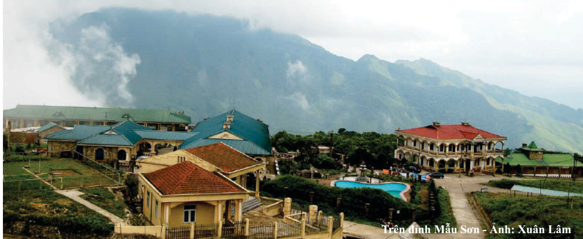
Trên đỉnh Mẫu Sơn

Trung tâm Thông tin Xúc tiến Du lịch Lạng Sơn