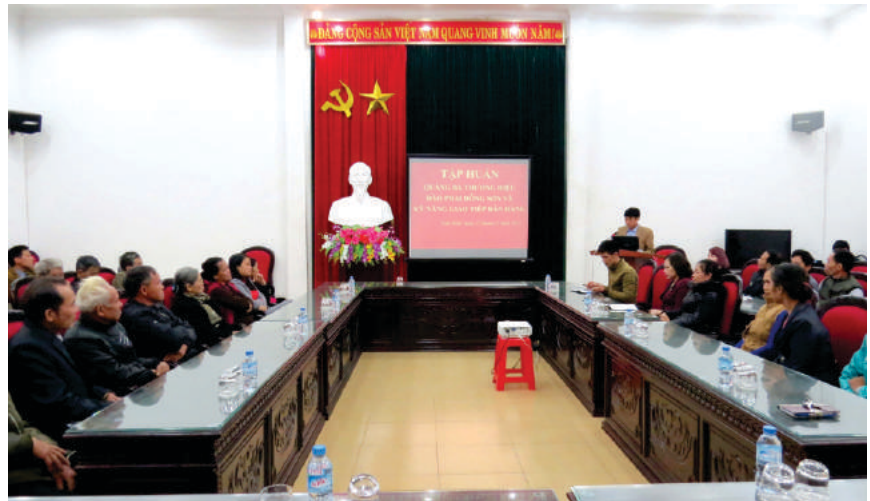
Quang cảnh buổi tập huấn