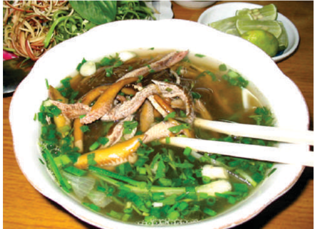
Miến lươn Ninh Bình

Cái khác biệt thứ hai làm nên thương hiệu riêng cho miến lươn Ninh Bình lại nằm ở nồi nước dùng. Nước dùng muốn ngon phải được nấu từ chính xương lươn, sau khi lọc thịt, xương lươn không được vớt bỏ mà cho vào nồi nước dùng, ninh cùng xương ống thật lâu, vớt bọt liên tục để nước giữ được độ trong cũng như vị béo tự nhiên. Cũng nhờ vậy, khi bát lươn được bung ra thấy nước dùng màu nâu đậm, đặc sánh vô cùng ngon mắt, đậm miệng. Thịt lươn lại được rim theo công thức riêng