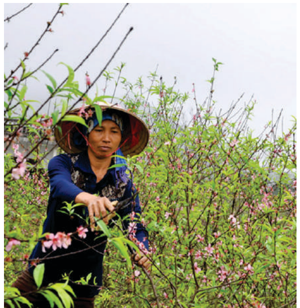
Chăm sóc đào phai Tam Điệp - Ảnh: Việt Hà

này các học viên sẽ tích lũy thêm nhiều kiến thức bổ ích được áp dụng vào thực tiễn. Năm 2018 hứa hẹn Hội thi Cây đào đẹp, cảnh đào đẹp sẽ được diễn ra quy mô và chất lượng tại thành phố Tam Điệp./.