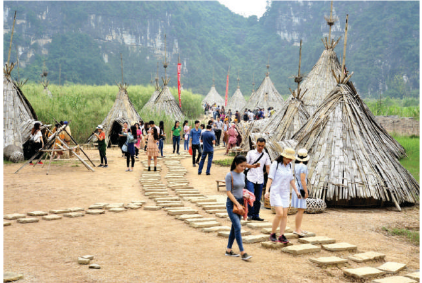
Đoàn Famtrip khảo sát phim trường “Kong: Skull Island”

Những năm qua, được sự quan tâm lãnh đạo, chỉ đạo của Tỉnh ủy, HĐND, UBND tỉnh, du lịch Ninh Bình đã có những bước phát triển khá nhanh, đang dần trở thành ngành kinh tế mũi nhọn của tỉnh. Sản phẩm du lịch ngày một đa dạng, phong phú và hấp dẫn khách du lịch. Đặc biệt Quần thể danh thắng Tràng An được UNESCO công nhận là Di sản Văn hóa và Thiên nhiên thế giới đã đưa du lịch Ninh Bình lên một tầm cao mới.