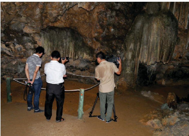
Dấu tích của người Việt cổ, sống cách đây khoảng 7500 - 10000 năm

Với vẻ đẹp huyền ảo, tráng lệ, khu du lịch sinh thái động Thiên Hà thực sự là "dải ngân hà trong lòng núi" - một điểm nhấn của du lịch hang động ở Ninh Bình để du khách cùng khám phá và chiêm ngưỡng./.