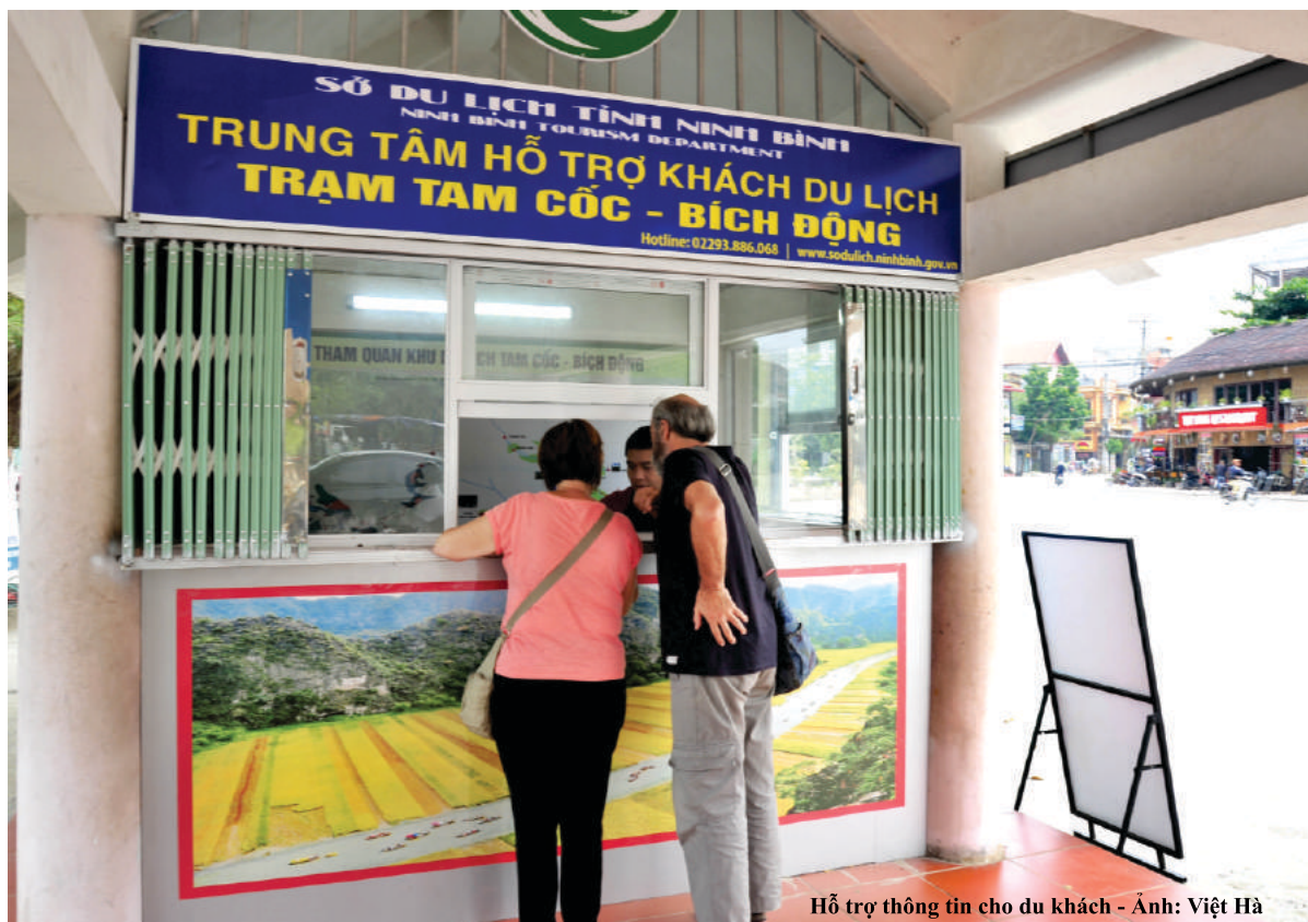
Hỗ trợ thông tin cho du khách