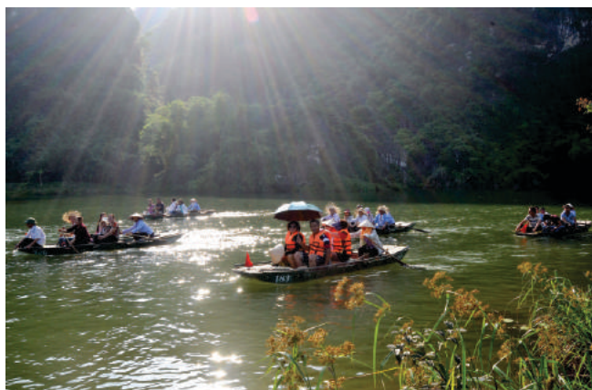
Du khách tham quan Tràng An

Ninh Bình đang hướng tới mục tiêu trở thành điểm đến an toàn, văn minh, thân thiện và mến khách. Với gần 20 năm hoạt động, Trung tâm Xúc tiến Du lịch đã và đang tạo sức vươn cao, quyết tâm cùng ngành Du lịch Ninh Bình thực hiện tốt một trong ba khâu đột phá mà Nghị quyết Đại hội Đảng bộ tỉnh lần thứ XXI nhiệm kỳ 2015 - 2020 đã đề ra: “Phát triển kết cấu hạ tầng đồng bộ. Nâng cao chất lượng, hiệu quả du lịch, dịch vụ” và vững tin đến năm 2025 đưa ngành Du lịch cơ bản trở thành ngành kinh tế mũi nhọn, đến năm 2030 thực sự trở thành ngành kinh tế mũi nhọn và chiếm tỷ trọng lớn trong cơ cấu kinh tế của tỉnh./.