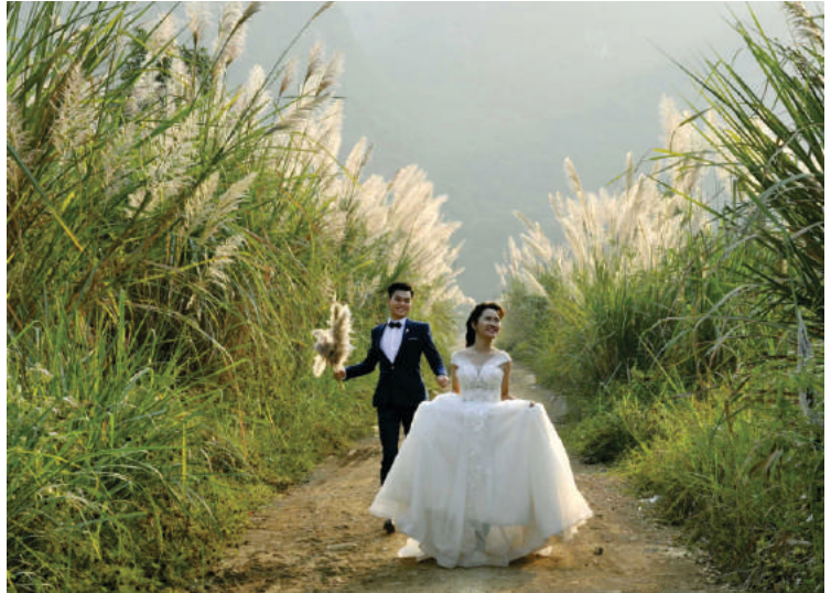
Hoa lau nở trắng trên đất Tràng An

Tràng An mùa này đẹp lắm, dọc đường đi vào vùng Di sản, hoa lau nở trắng xóa, vung cánh lên cả những loài cây khác. Nhờ hoa cỏ lau, những núi đá hùng vĩ trở nên mềm mại, đẹp lạ thường. Mỗi lần gió thổi, hai bên con đường lại như những dải lụa trắng uyển chuyển, dịu dàng làm xao xuyến trái tim của biết bao lữ khách. Không chỉ có Tràng An, khu vực gần chùa Bái Đính hay Động Hoa Lư cũng là nơi du khách có thể thỏa sức chiêm ngưỡng