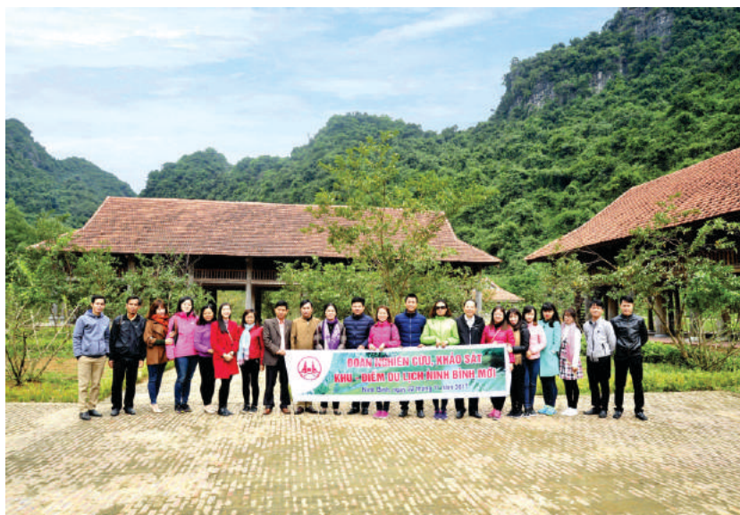
Thung Ui - sản phẩm du lịch mới của Ninh Bình chuẩn bị đưa vào khai thác

Sân Golf Tràng An với tổng chiều dài 7,074 yards, gồm 18 hố championship và sân 18 hố par 3 tiêu chuẩn. Với vị trí nằm bên hồ Đồng Chương (Nho Quan, Ninh Bình), được bao quanh bởi 1 rừng thông lớn, 3 hồ nước và