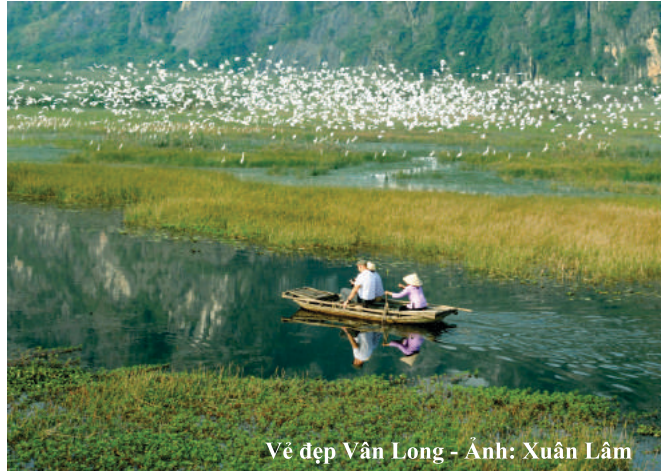
Vẻ đẹp Vân Long - Ảnh: Xuân Lâm

Thú vị nhất là khi đến khu vực đảo cò lúc chiều tà. Từng đàn cò trắng bay về là lướt trên đám cỏ năn mọc giữa vùng đầm lầy ngập nước. Đây là khu vực rừng cây ngập nước nằm giữa một vùng lau lách, nơi tập trung các loài chim di cư về cư trú vào mùa Đông. Vào thời gian này, nhiều loài chim di cư từ phương Bắc