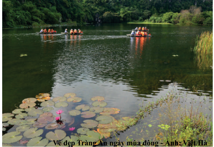
Vẻ đẹp Tràng An ngày mùa đông

Tràng An mùa này không ồn ào, náo nhiệt như những ngày đầu năm mà bình yên đến lạ thường với màu sắc trầm ấm của mùa đông. Làn sương trắng phủ kín những dãy núi trùng điệp, cây cối cũng đang thay màu lá mới, điểm xuyết trên nền nước xanh biếc là màu tím hồng của hoa súng và những con le le thi nhau ngụp lặn tìm mồi. Nước ở Tràng An mùa nào cũng thế, sạch và trong đến nỗi làm người ta có cảm giác rằng chỉ cần với tay xuống, là có thể chạm được rêu hay nhón được từng hòn sỏi. Khung cảnh bình yên với những cảnh đẹp thơ mộng khiến tôi cứ tiếc nuối ngắm nhìn ngay khi