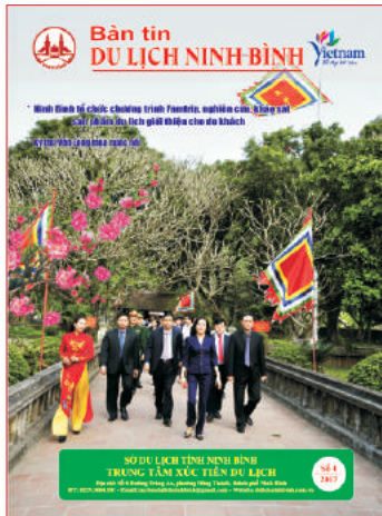
Các đồng chí lãnh đạo tỉnh Ninh Bình vào dâng hương tại đền vua Đinh Tiên Hoàng