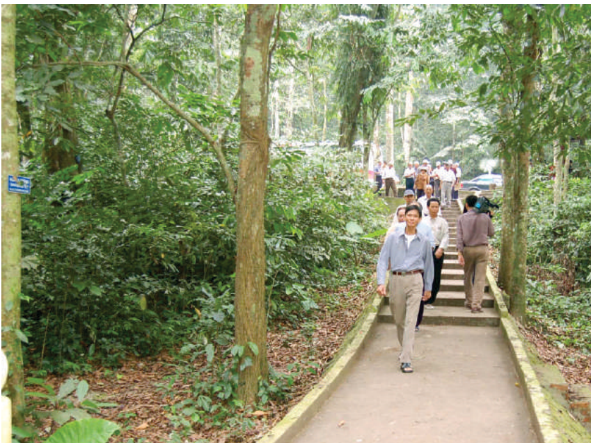
Đường vào thăm động người xưa

được nghiên cứu, tìm hiểu những điều lý thú, bí ẩn, những di tích khảo cổ của con người ở động Người Xưa. Đây là một trong những di tích lịch sử để minh chứng cho sự phát triển của loài người, là dấu ấn của sự sống thuở sơ khai của lịch sử loài người, một di sản vô giá trong khu rừng nguyên sinh Cúc Phương cần được bảo vệ./.