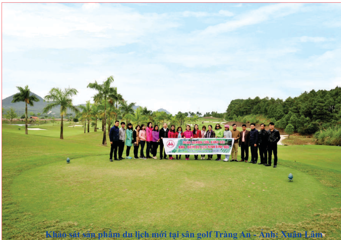
Khảo sát sản phẩm du lịch mới tại sân golf Tràng An