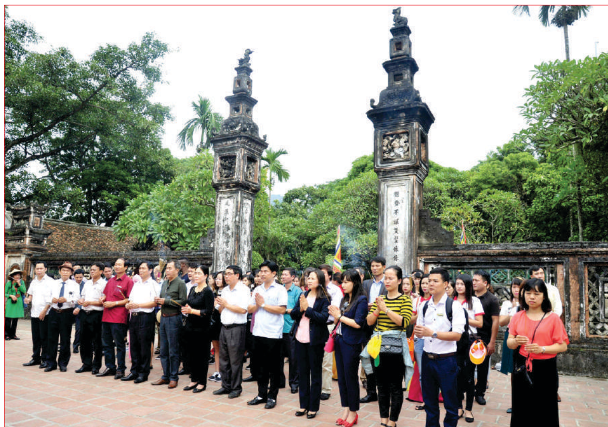
Đoàn Famtrip tham quan, khảo sát dâng hương tại Cổ đô Hoa Lư