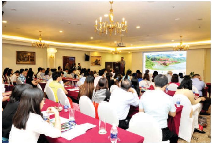
Hoạt động quảng bá du lịch thông qua Hội nghị

Phối hợp với các Trung tâm Thông tin Xúc tiến Du lịch, Trung tâm Xúc tiến du lịch, Trung tâm xúc tiến đầu tư, thương mại Du lịch; Câu lạc bộ Lữ hành các tỉnh, thành phố đón 05 đoàn