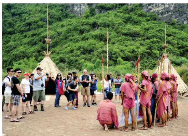
Hoạt động quảng bá du lịch qua các đoàn Famtrip