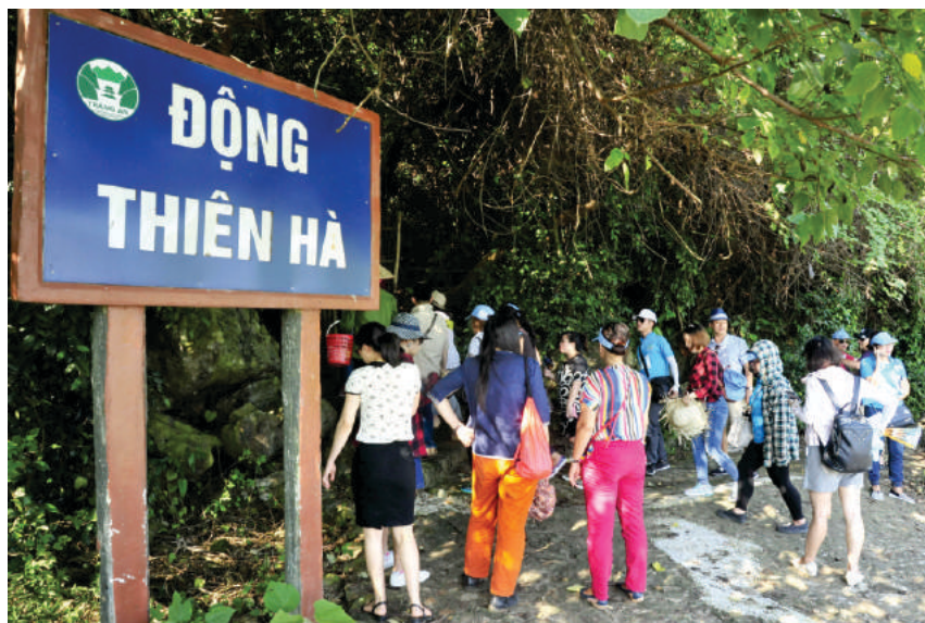
Du khách tham quan động Thiên Hà

Từ bản Mường Thổ Hà, con thuyền nhẹ lướt trên dòng kênh nhỏ có chiều dài chừng 1km, thuộc hệ thống sông Bến Đàng. Chạy dọc theo dòng kênh này là dãy núi Tượng, nơi động Thiên Thanh và Thiên Hà ẩn mình. Núi Tượng có độ cao gần 200m. Ở thế kỷ X, dãy núi này đóng vai trò là bức tường thành thiên nhiên vững chắc bao bọc, bảo vệ kinh thành Hoa Lư, gắn liền với những địa danh mang đậm dấu ấn lịch sử, văn hoá một thời như Bến thuyền Nhà Lê, Núi Phật Đầu Sơn, Thửa Ruộng Đầu Linh...đầy oai hùng. Theo truyền thuyết, vua Lê đã triệu tập binh lính ở đây và