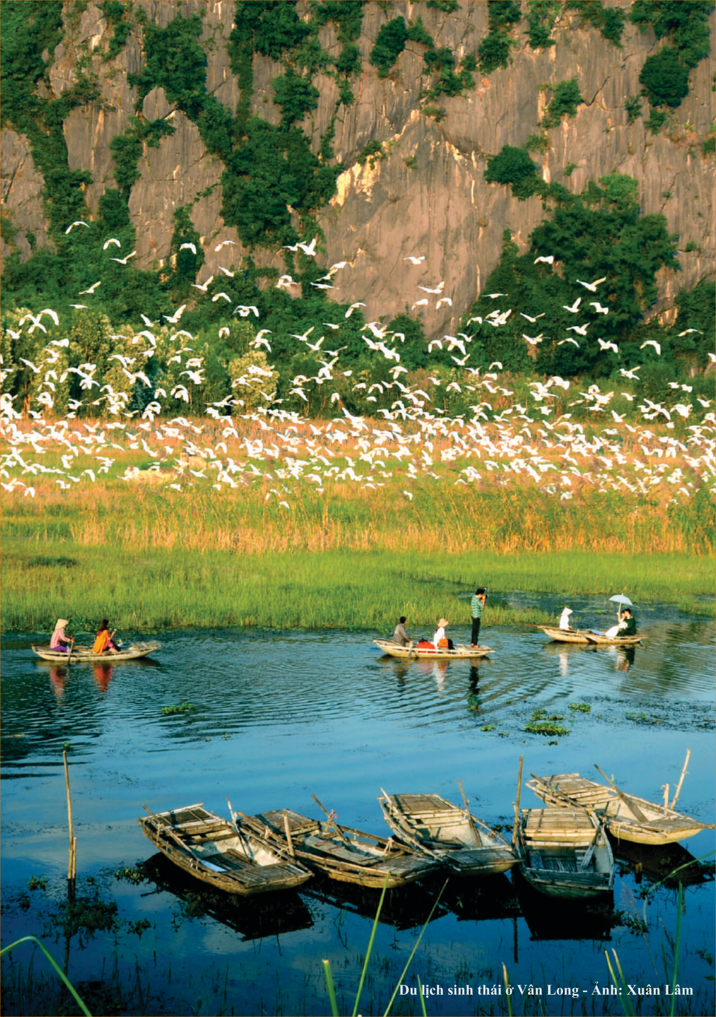
Du lịch sinh thái ở Vân Long - Ảnh: Xuân Lâm