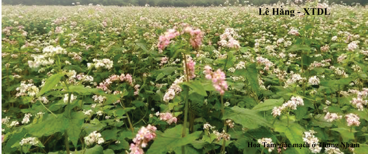
Hoa Tam giác mạch ở Thung Nham

Cuối thu đầu đông, khi những cơn gió heo may bắt đầu thổi cũng là thời điểm nở rộ của hoa Tam giác mạch - loài hoa đặc trưng của các tỉnh miền núi phía Bắc. Tuy nhiên, 2 năm trở lại đây, du khách đã được chiêm ngắm loài hoa đặc sản này giữa vùng đất Cổ đô.