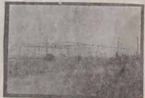
Fabrikanın Çatı Montajı