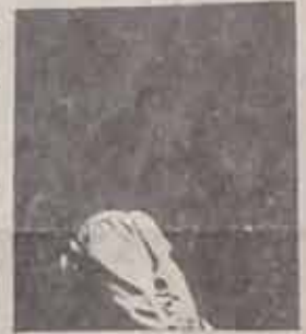
Vechdi İlhan

1973 yılı genel seçimlerinde DSP.'den Kastamonu Milletvekili seçilen ve 2 ve 3 Ekim'de Bakanlar Kurulu'da Orman Bakanı'lığı