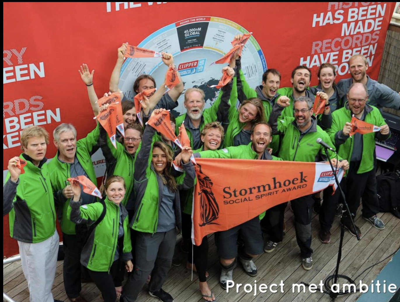
Project met ambitie