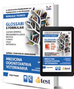
Glossari e Formolari (Versione Cartacea) 2020 – Manuale Teorico

Le nostre attività didattiche integrano perfettamente lo studio teorico e pratico mediante i manuali e i libri di preparazione al Test di Veterinaria e test.