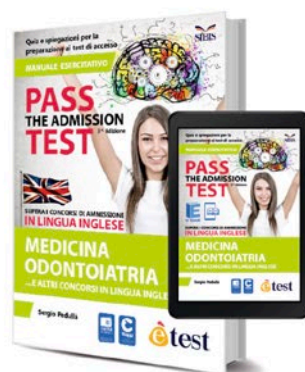
Pass the Admission Test 2018T