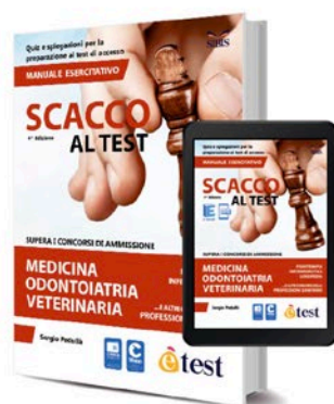
Scacco al Test (Versione Cartacea) 2020 – Manuale Esercitativo