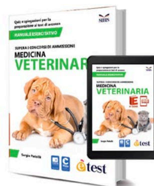
Veterinaria (Versione Cartacea) 2020 – Manuale Esercitativo

I libri della Collana consentono una completa e ottimale preparazione ai Test di Ammissione a Medicina.