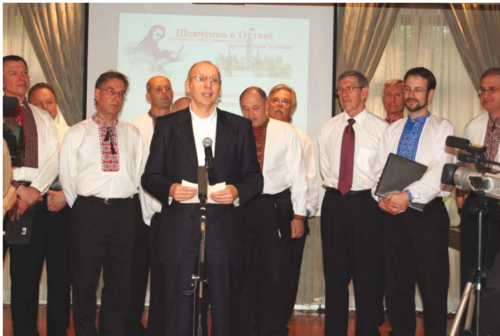
Презентація проекту пам'ятника в українському Посольстві 31 травня 2007 року

Шевченко в Оттаві – не міф, а реальність!