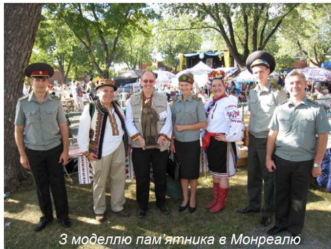
З моделлю пам'ятника в Монреалю

відомий вже не тільки в Канаді скульптор Леонід Молодожанин, або як його тут знають - Лео Мол.