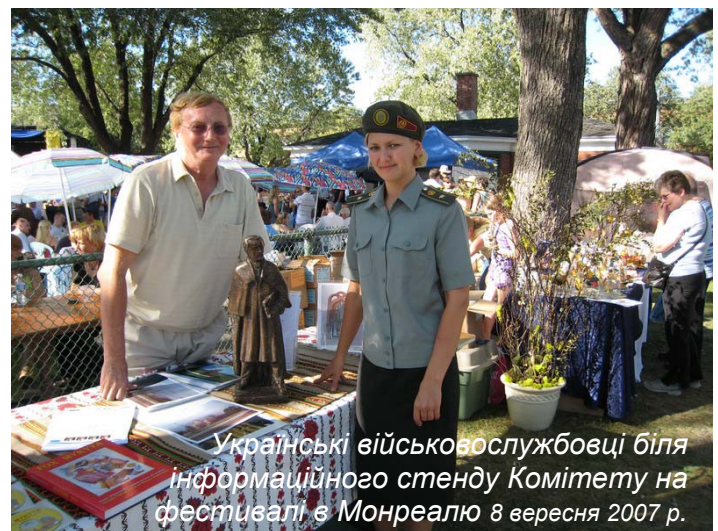
Українські військовослужбовці біля інформаційного стенду Комітету на фестивалі в Монреалю 8 вересня 2007 р.