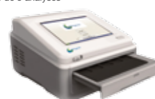
Lecture simultanée de 5 analyses