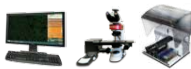
AFT3000 / Image Navigator