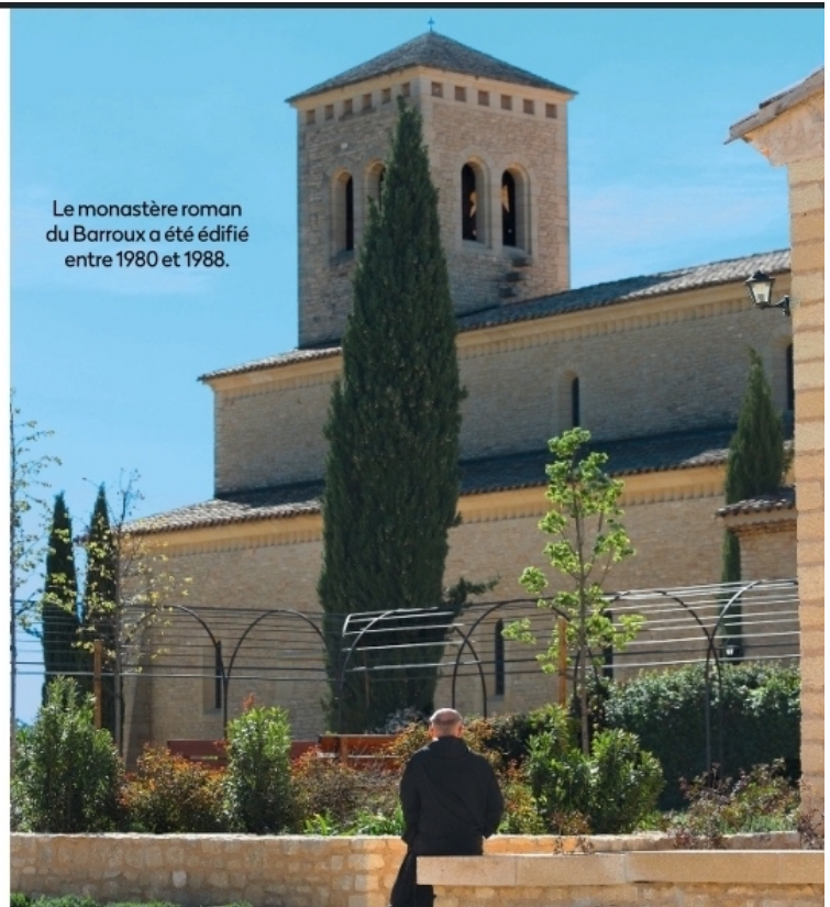
Le monastère roman du Barroux a été édifié entre 1980 et 1988.

À l'origine, Dieu place l'homme dans le jardin d'Éden, Aden, les délices en araméen ou en hébreu. L'acte de foi monastique, c'est la conviction que Dieu veut établir l'homme dans un jardin de délices. Les moines s'évertuent, depuis tous les temps, à faire de leurs abbayes de petits paradis sur terre.