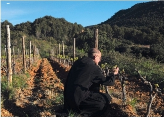
Au sein du projet Via Caritatis, les cuvées de la gamme Abbayes sont 100 % monastiques, issues du seul travail des moines et des sœurs.

16 ou 16,5°, on obtient des vins dont des dégustateurs nous disent : « Vous êtes comme des bourgognes à 13,5° ! ».