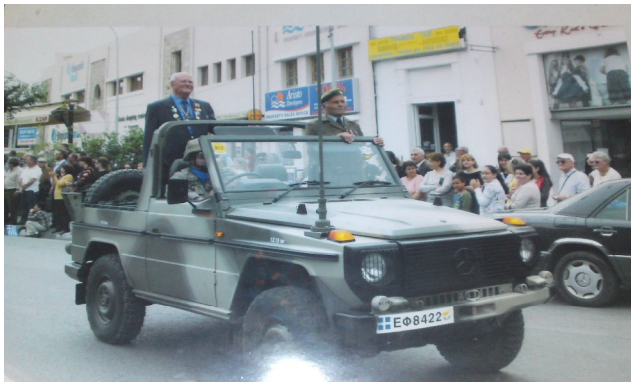
28η ΟΚΤΩΒΡΙΟΥ 1940, και Χλωρακιώτες αγωνιστές .