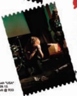
Bucket Flush "USA" 2015.08.13. 100-as Klub @ R33