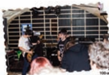
Chokobra 2015.08.03. 100-as Klub @ Auróra