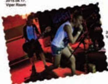
VEX 2015.08.17. Viper Room