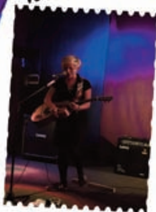
Efa Supertramp 2015.09.19. Titkok Kamrája