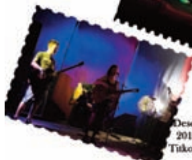
Desenvoltura 2015.09.19. Titkok Kamrája