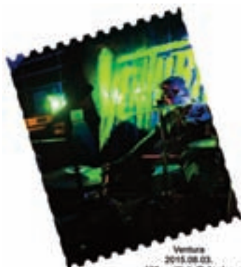
Ventura 2015.08.03. 100-as Klub @ Auróra