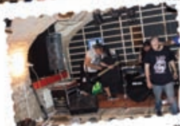
K.O.C. 2015.08.03. 100-as Klub @ Auróra