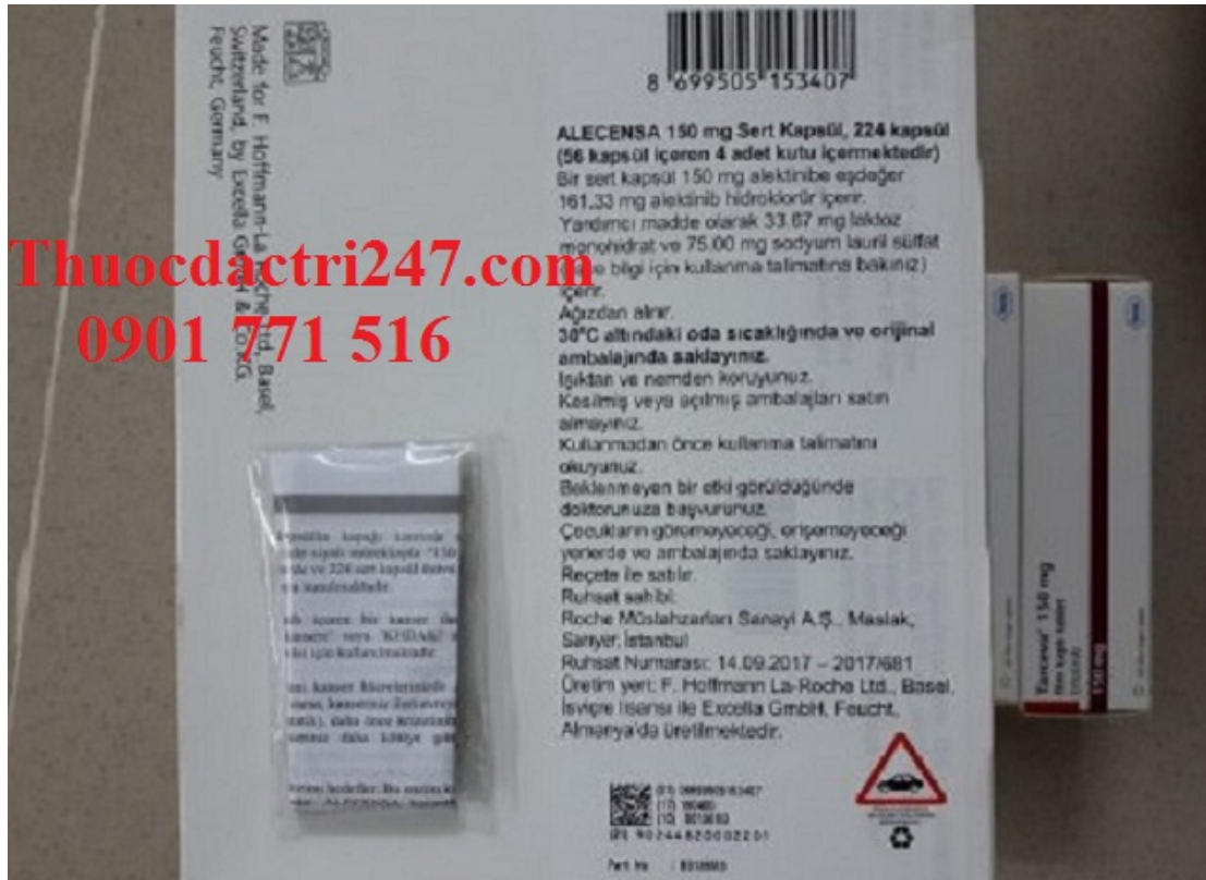
Thuốc Alecensa 150mg alectinib điều trị ung thư phổi – Thuốc đặc trị 247 (1)

Giá thuốc Alecensa: Bình Luận bên dưới để biết giá hoặc liên hệ với chúng tôi qua Fanpage Thuốc Đặc Trị 247