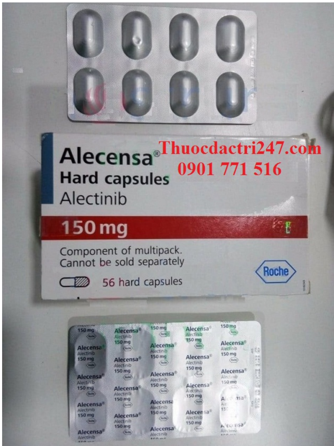
Thuốc alecensa 150mg alectinib điều trị ung thư phổi – Thuốc đặc trị 247 (3)