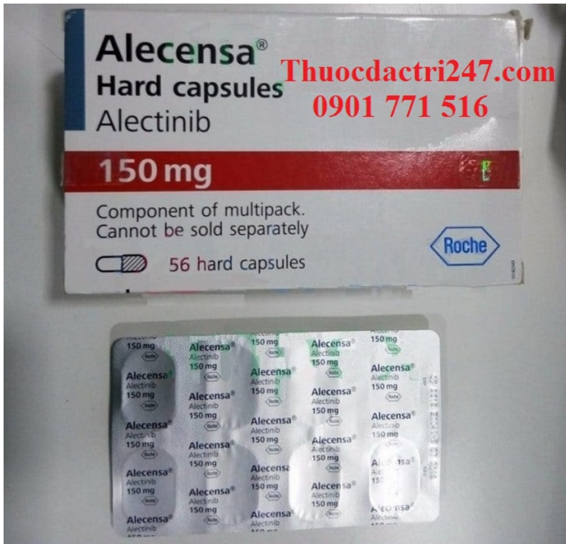
Thuốc alecensa 150mg alectinib điều trị ung thư phổi – Thuốc đặc trị 247 (2)