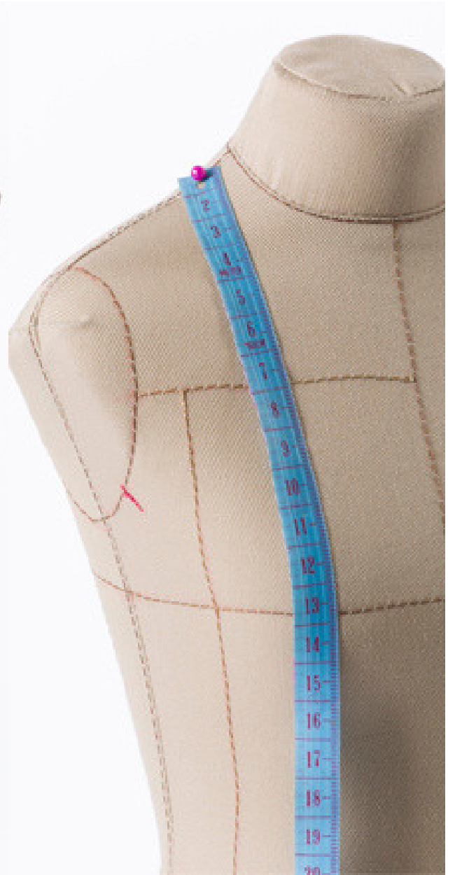
MAHEKEH BETTY PREMIUM