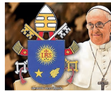
Франциск, дано у Ватикані, 5 березня 2016

пам, монашеству та вірним Української Греко-Католицької Церкви особливе Апостольське благословення, як знак моєї постійної любові й пам'яті про вас.