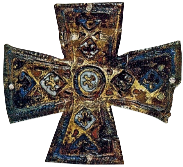
XII ст., хрест, знайдений 1881 р. під час ремонту Троїцької надбрамної церкви Києво-Печерського монастиря

По справедливості за злочин карають, як воно буває у людському суспільстві. Але це не є у природі Божій. Боже є милувати і спасати. І так у хресті ми бачимо любов Божу до нас грішних. Тому святий Золотоустий називає хрест празником і духовним торжеством. Він став для нас причиною безчисленних благ. Він вивів нас з незнання, просвітив тих, що сиділи у темряві. Хрест примирив нас з нашим Богом. Ті, що колись були ворогами, тепер стали друзями (Еф. 2, 13). Ось розбійник, який чинив злочини в своєму житті і тим засудив себе на кару смерті, від якого відмовилося суспільство, отримав помилування від Бога через слова: «Пом'яни мене Господи, коли прийдеш у царстві Твоєму» (Лк. 23, 42).