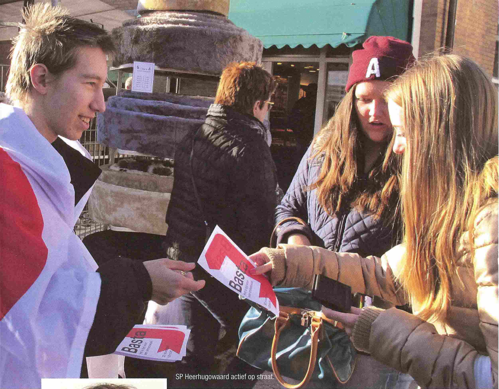
SP Heerhugowaard actief op straat.