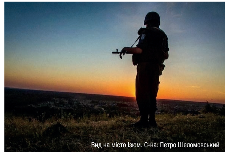
Вид на місто Ізюм.