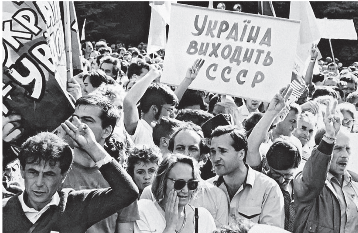
Протести на площі Жовтневої революції (тепер – Майдан Незалежності) у Києві, 1990 р.

У 1993 році, незадовго після краху червоної імперії, Євген Сверстюк, осмислюючи комуністичний досвід людства, міг би говорити про нього винятково у минулому часі. Але ні, у перші роки незалежності України наше суспільство все ще відчувало на собі щупальця більшовизму: «Але ж комуністи не відходили від влади! Усі вони на старих місцях», – пише Сверстюк. Не буде перебільшенням сказати, що більшовизм жевріє до сьогодні, після того як ми залишили за спиною соту річницю революції. Справа не лише у червоних директорах, які спільно з організованим криміналом розікрали нашу країну у 1990-ті. Справа в особливій злодійкувато-підлабузницькій психології («жизнь во лжи» [життя в брехні]), яка поки що не дає змоги з упевненістю оголосити кінець червоної людини. (Юрій Мельник)