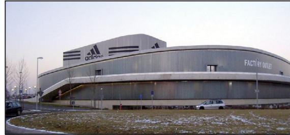
«Ադիդաս» ընկերության շենքը Հեցոգենսուրախում

Ջարգացման բարձր մակարդակի են հասել նաև թեթև և սննդի արդյունաբերության ճյուղերը, որոնց մեծ ու փոքր ձեռնարկություններ ցրված են ամբողջ երկրով մեկ: Համաշխարհային ճանաչում ունի գերմանական «Ադիդաս» և «Պումա» ընկերությունների մարզական արտադրանքը, ինչպես նաև կոշիկ թողարկող «Սալամանդր» ընկերությունը: