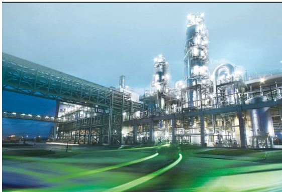
«Բայեր» ընկերության քիմիական գործարան

Ավտոմոբիլաշինությունից բացի զարգացած են նաև հաստոցաշինական, էլեկտրատեխնիկական, էլեկտրոնային և այլ ճյուղեր ու արտադրություններ: Դրանք զարգանում են երկրի մեծ քաղաքներում, որտեղ առկա են դրանց զարգացմանը նպաստող բարձրորակ կադրերը, գիտական կենտրոնները, սև և գունավոր մետաղները: Համաշխարհային ճանաչում ունեն և երկրի տնտեսական կյանքում կարևոր դեր են կատարում «Սիմենս» (կենտրոնը՝ Մյունխեն) և «Բոշ» (կենտրոնը՝ Շտուտգարտ) վերագգային ընկերությունները: