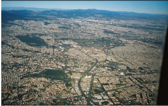
Տեսարան Հռենոս-Ռուրի մեգալոպոլիսից

շրջաններ, օրինակ՝ Հռենոս-Ռուրի մեգալոպոլիսում, որտեղ 1 քառ.կմ-ի վրա ապրում է ավելի քան 1000 մարդ: Բնակչությունը նույն է Հյուսիս-գերմանական