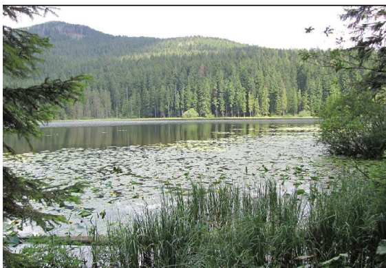
Տեսարան Բավարական անտառ ցածրադիր լեռներից

Գետերը շատ են և ջրառատ: Համեմատաբար խոշոր գետերը՝ Հոենոսը, Էլբան, Մայնը, նավարկելի են, ջրանցքներով միացած ինչպես միմյանց, այնպես էլ Հյուսիսային և Բալթիկ ծովերին: