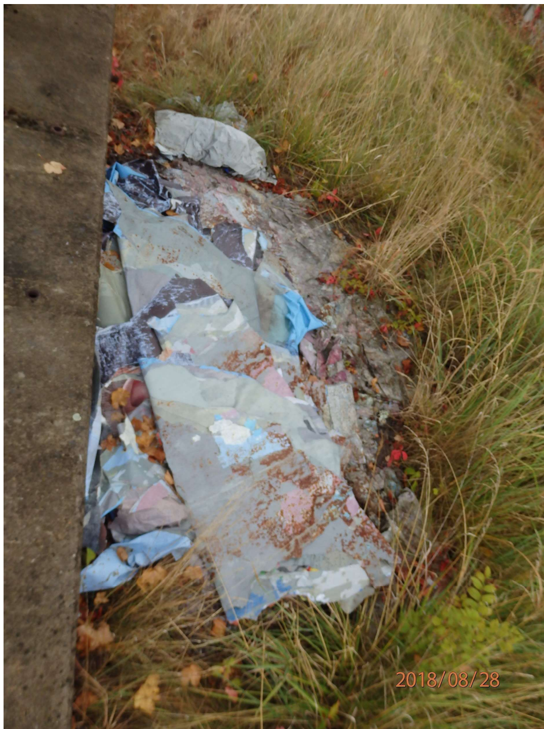
Tentýž billboard. Zaměstnanci provozovatele při výměně plakátů staré plakáty prostě hodí vedle betonového základu a nechávají je tam hnit.