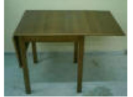
Kare Açılır Kapanır Masa (48) 55 TL

G:70 D:50,5 Y:64 ölçülerinde, 1. sınıf 18 mm ceviz desenli suntalamdan imal edilmiştir.