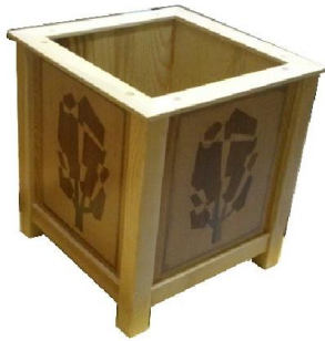
Çöp Kovası (9) 15 TL

Kayın masiften üretilmiş, doğal ipek mat verniği uygulaması yapılmıştır. Kol kısmı açılıp kapanabilmektedir.