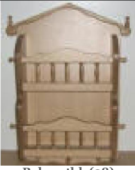
Baharatlık (28) 32 TL

G:40 D:15 Y:62,5 ölçülerinde, 1. sınıf 18 mm kayın desenli mdflamdan imal edilmiştir.