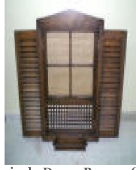
Panjurlu Duvar Panosu (57) 60 TL

Masif ahşaptan üretilmiş, doğal ipek mat verniği uygulaması yapılmıştır.