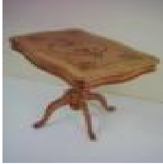
Dikdörtgen Fiskos Sehpa (44) 30 TL

G:45/100 D:45 Y:49 ölçülerinde, 18 mm yonga levha üzeri çam kaplama uygulanmış natürel veya ceviz rengi çeşitleri üretilmiştir.