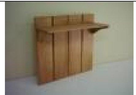
Lambri Li Elbise Askısı (14) 25 TL

G:111 D:21 Y:26 ölçülerinde, 18 mm yonga levha üzeri marketri çalışması uygulanmış, şapkalık kısmı 1. sınıf kayın masiften imal edilmiş doğal ipek mat verniği uygulaması yapılmıştır.