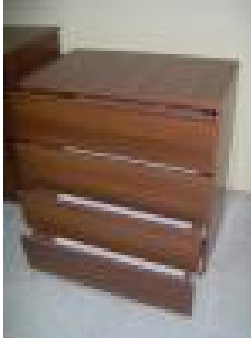
Şifonyer (34) 50 TL

Birinci sınıf yonga levha üzerine meşe kaplama olarak üretilmiştir. 1 çekmece ve 1 kapalıdır. Üzerine natural ipek mat verniği uygulaması yapılmıştır.