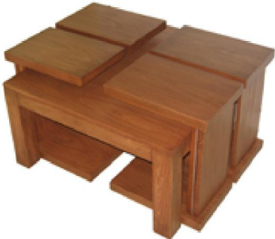
4'lü C ve Orta Sehpa Takımı (22) 120 TL

Birinci Sınıf Suntalam, 3 gözlü çekmeceli olarak üretilmiştir.