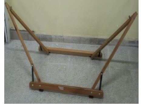
Hamak Beşik (8) 20 TL

G:60 D:14 Y:91 ölçülerinde, 18 mm yonga levha üzeri meşe kaplamalı, 4 mm kayın kontrplak arkakıllı, cumbalar 1. sınıf kayın, natürel verniklenmiştir.