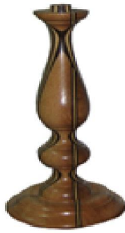
Büyük Abajur (59) 20 TL

Kayın masiften üretilmiş, 3 katlı 6 gözlüdür. Doğal ipek mat verniği uygulaması yapılmıştır.