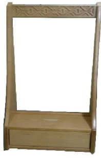
Oymalı Telefon Etajeri (53) 35 TL

38 D:30 Y:90,5 ölçülerinde, 1. sınıf 18 mm kayın desenli mdflamdan imal edilmiştir.