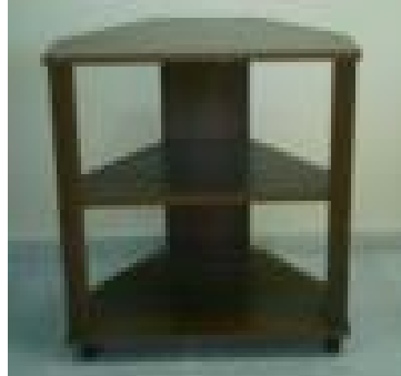
TV Sehpa (47) 40 TL

Tabure açık olarak; G:32 D:25 Y: 28, ölçülerinde, masa açık olarak G:50 D:70 Y:65 ölçülerinde iç içe katlanarak küçültülebilen 1. sınıf emprenyeli çam masiftir, vernik uygulaması yapılmıştır..