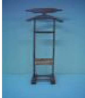
Çekmeceli Dilsiz Uşak (35) 35 TL

G:80 D:90 Y:50 ölçülerinde, 18 mm Ceviz desenli Suntalamdan, 4 çekmeceli olarak imal edilmiştir.