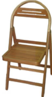
Katlanır Sandalye (50) 35 TL

G:30 D:30 Y:43 ölçülerinde, oturak kısmı 12 mm lif levha, ayaklar 1. sınıf kayın masiften konik formda imal edilmiş ve natural vernik uygulaması yapılmıştır.