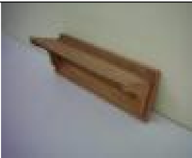
Küçük Elbise Askılığı (12) 10 TL

Birinci sınıf çam masif parçalardan üretilmiş doğal ipek mat verniği uygulaması yapılmıştır.. Üst bölümlere marketri tekniği uygulanmıştır.