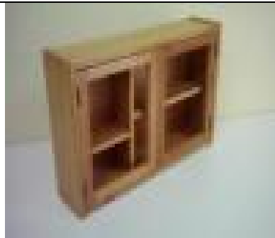
Masif Kapaklı Ecza Dolabı (38) 25 TL

G:63 D:14,5 Y:44 ölçülerinde, 18 mm yonga levha üzeri kayın kaplamalı, sürme cam kanalları 1. sınıf kayın masiften imal edilmiş, natürel