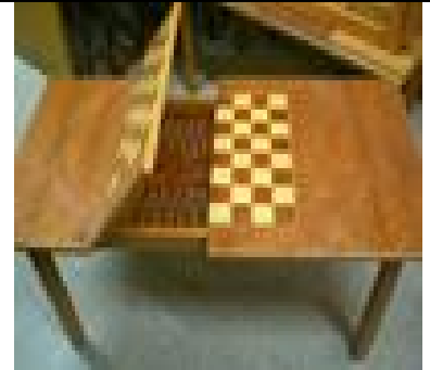
Damalı Tavlalı Orta Sehpa (27) 50 TL

Yonga levha plaka üzerine marketri uygulanarak üretilmiş, natural ipek mat verniği uygulaması yapılmıştır..