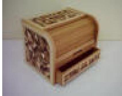
Çekmeceli Ekmek Dolabı (10) 40 TL

G:44 D:32 Y:32 ölçülerinde, masif stor kapaklı ve çekmeceli, üst ve yan tablalar ve çekmece klapası değişik kaplamalar ile marketri çalışması uygulanmış ve doğal ipek mat verniği uygulaması yapılmıştır.