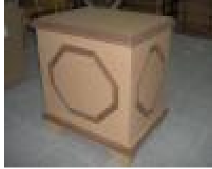
Sandık (32) 30 TL

Masif ahşaptan üretilmiş, natural ipek mat verniği uygulaması yapılmıştır.