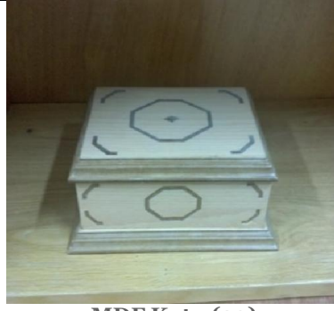
MDF Kutu (29) 5 TL

G:40 D:15 Y:62,5 ölçülerinde, 1. sınıf 18 mm kayın desenli mdflamdan imal edilmiştir.