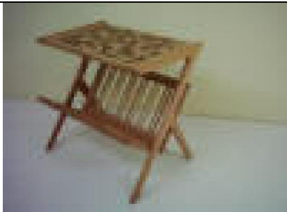
Gazetelik: 25 TL

G:49 D:34 Y:47 ölçülerinde, üst tabla 18 mm yonga levha üzeri değişik kaplamalar ile marketri çalışması uygulanmış, ayaklar ve alt gazetelik kısmı 1. sınıf kayın masiften imal edilmiş ve doğal ipek mat verniği uygulaması yapılmıştır..