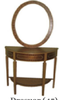
Dresuar (45) 50 TL

G:70 D:47 Y:56 ölçülerinde, üst tablasında marketri çalışması uygulanmış, kenarları kayın masiften kordon ve ayaklar tornalı, kayın masiften imal edilmiş ve natural ipek mat verniği uygulaması yapılmıştır..