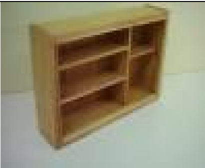
Sürme Camlı Ecza Dolabı (37) 20 TL

G:49 D:34 Y:117 ölçülerinde, 1. sınıf çam masiften imal edilmiş, natürel verniklenmiştir.