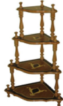
Köşe Sehpa (24) 25 TL

G:49,5 D:39 Y:39 ölçülerinde, 18 mmlik 1. sınıf ceviz desenli suntalam malzemeden üretilmiştir.