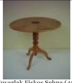
Yuvarlak Fiskos Sehpa (42) 30 TL

G:60 D: 60 Y:65 ölçülerinde, üst tablası 18 mm yonga levha üzerine akçaağaç, ceviz gibi ağaç kaplamalarından marketri tekniği uygulanarak üretilmiş, ayak kısmı 1. sınıf kayın malzemeden üretilmiştir.