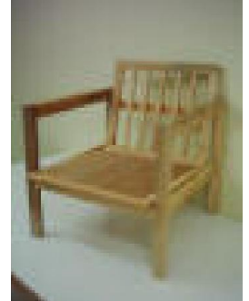
İskandinav Koltuk (51) 45 TL

Birinci sınıf kayın masif parçalardan üretilmiş natural ipek mat verniği uygulaması yapılmıştır.