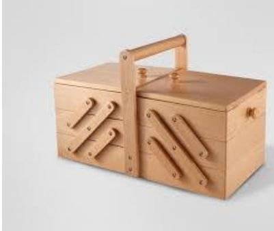
Dikiş Kutusu (58) 25 TL

G:61 D:7 Y:76 ölçülerinde, 2 adet açılabilen panjurlu kapağı bulunan ürün, 1.Sınıf kayın keresteden imal edilmiş ve ceviz rengi verilmiştir. İpek mat vernik uygulanmıştır.