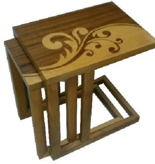
2'li Kakmalı C Sehpa Takımı (20) 50 TL

Tablalar için 18 mm yonga levha üzerine zeytin kaplama yapılmıştır. Natural ipek mat verniği uygulaması yapılmıştır.. Tekerleklidir.