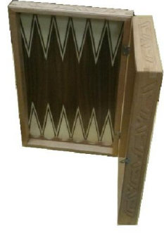
Tavla (54) 25 TL

1. sınıf kayın masiften üretilmiş, kenar ve alın kısımlarında kısımlarda oyma vardır. Cekmece yüzeyi ve yan kollarda MDFLam kullanılmıştır.