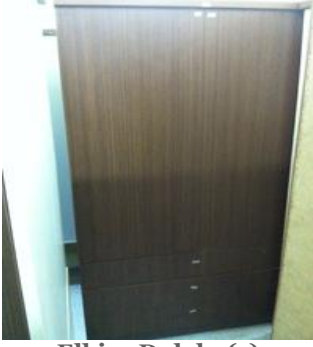
Elbise Dolabı (1) 140 TL

Birinci Sınıf Suntalam, 2 kapaklı 3 çekmeceli olarak üretilmiştir.