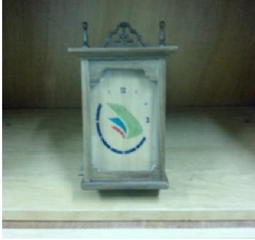
Saat (31) 15 TL

Masif ahşaptan üretilmiş, natural ipek mat verniği uygulaması yapılmıştır.