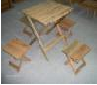
Piknik Takımı (46) 55 TL

Tablalar 18 mm yonga levha, ayaklar birinci sınıf kayın tornalı masif parçalardan üretilmiş, natural ipek mat verniği uygulaması yapılmıştır.. Marketri tekniği uygulanmıştır.