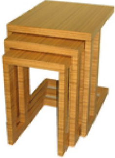
3'lü Kaplamalı C Sehpa Takımı (19) 50 TL

Birinci sınıf çam masif parçalardan üretilmiş natural ipek mat verniği uygulaması yapılmıştır.. Üst bölümlere marketri tekniği uygulanmıştır.