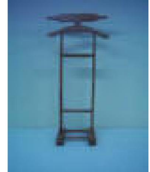
Çekmecesiz Dilsiz Uşak (36) 30 TL

1. sınıf kayın masiften imal edilmiş, natürel verniklenmiştir.