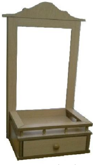
Telefon Etajeri (52) 35 TL

38 D:30 Y:90,5 ölçülerinde, 1. sınıf 18 mm kayın desenli mdflamdan imal edilmiştir.