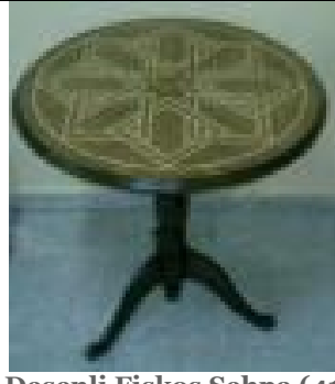
Desenli Fiskos Sehpa (41) 45 TL

Büyük G:55 D:55 Y:50; Orta G:42 D:42 Y:46; Küçük G:28 D:28 Y:42 ölçülerinde, iç içe geçebilen üç adet üçgen formda servis sehpa takımı.