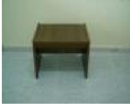
Ofis Sehpa (23) 20 TL

4 adet ufak sehpa ve 1 adet orta sehpadan oluşur. 1. Kalite masif ahşaptan üzeri renklendirici boya ile boyanmıştır.