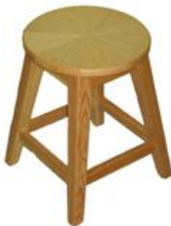
Normal Tabure (49) 20 TL

G:70/140 D:70 Y:75 ölçülerinde, tabla kısmı 1. sınıf 18 mm ceviz desenli suntalamdan, ayak kısımları da 1. sınıf kayın masiften imal edilmiştir.