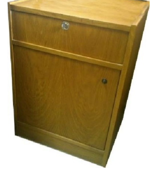
Çekmeceli Keson (33) 30 TL

G:60 D:45 Y:60 ölçülerinde, 18 mm Meşe ve Kayın desenli MDFlam'dan, imal edilmiştir. Değişik modelleri mevcuttur.