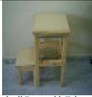
Hareketli Basamaklı Tabure (17) 25 TL

G:40 D:25 Y:53 ölçülerinde, üst ve alt tablalarına 18 mm yonga levha üzeri kayın, gül ve meşe kaplama uygulanmış, ayna çerçevesi ve dikmeleri 1. sınıf kayın malzemeden üretilmiştir. *Fiyata ayna dahil değildir.