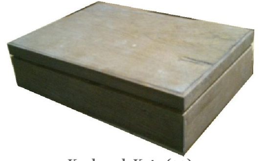
Kaplamalı Kutu (30) 5 TL

MDF'den üretilmiş, üst kısımlara ve kenarlara oyma işlemi uygulanmıştır.