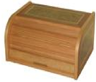
Çekmecesiz Ekmek Dolabı (11) 25 TL

G:44 D:32 Y:32 ölçülerinde, masif stor kapaklı ve çekmeceli, üst ve yan tablalar ve çekmece klapası değişik kaplamalar ile marketri çalışması uygulanmış ve doğal ipek mat verniği uygulaması yapılmıştır.