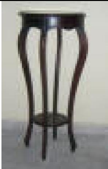
Çiçeklik (25) 35 TL

Tablalar 18 mm yonga levha, ayaklar birinci sınıf kayın tornalı masif parçalardan üretilmiş, natural ipek mat verniği uygulaması yapılmıştır.