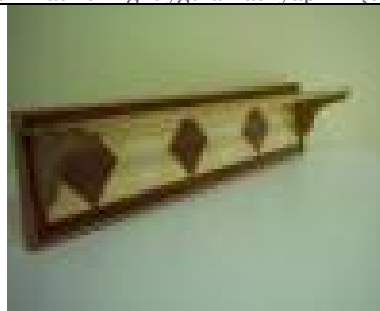
Büyük Elbise Askılığı (13) 25 TL

G:61 D:21 Y:21 ölçülerinde, 18 mm yonga levha üzeri kayın kaplama, şapkalık kısmı 1. sınıf kayın masiften imal edilmiş doğal ipek mat verniği uygulaması yapılmıştır.