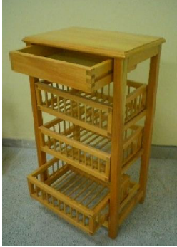
Çekmeceli Sebzelik (55) 40 TL

1. sınıf çam masiften üretilmiş, kenar kısımlarda oyma, diğer kısımlarda farklı renklerde marketri uygulaması mevcuttur. İpek mat vernik uygulanmıştır.