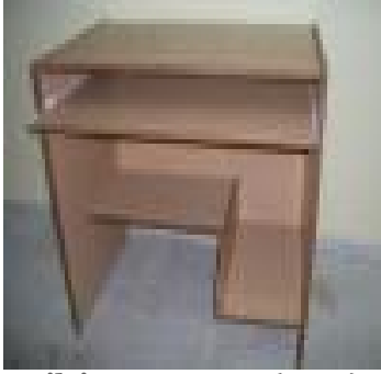
Bilgisayar Masası (4,5,6) 70 TL

Yonga levha üzeri çam kaplama ile üretilmiş, 2 kapak, 1 çekmece ve 3 raflıdır.