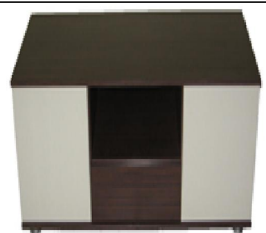
Lcd - Plazma Tv Sehpa (39) 50 TL

G:63 D:14,5 Y:44 ölçülerinde, 18 mm yonga levha üzeri kayın kaplamalı, 4 mm kayın kontrplak arkalı, kapaklar 1. sınıf kayın masiften imal edilmiş, natürel verniklenmiştir