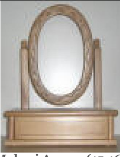
Makyaj Aynası (15,16) 35 TL

G:40 D:25 Y:53 ölçülerinde, üst ve alt tablalarına 18 mm yonga levha üzeri kayın, gül ve meşe kaplama uygulanmış, ayna çerçevesi ve dikmeleri 1. sınıf kayın malzemeden üretilmiştir. *Fiyata ayna dahil değildir.