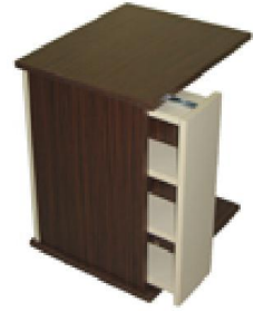
Suntalam Tek C Sehpa (21) 25 TL

Tablalar için 18 mm yonga levha üzerine zeytin kaplama yapılmıştır. Natural ipek mat verniği uygulaması yapılmıştır.. Tekerleklidir.