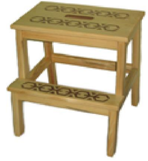
Basamaklı Tabure (18) 30 TL

G:36 D:36 Y:54,5 ölçülerinde, 1.sınıf çam kereste ve 18 mm yonga levha üzeri çam kaplamadan üretilmiştir.