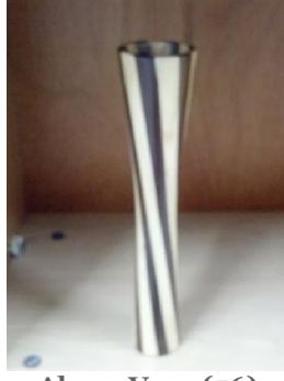
Ahşap Vazo (56) 10 TL

1. sınıf çam keresteden imal edilmiştir. Üzerine doğal ipek mat verniği uygulaması yapılmıştır.