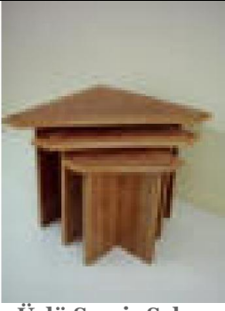
Üçgen Üçlü Servis Sehpa (40) 25 TL

Büyük G:55 D:55 Y:50; Orta G:42 D:42 Y:46; Küçük G:28 D:28 Y:42 ölçülerinde, iç içe geçebilen üç adet üçgen formda servis sehpa takımı.