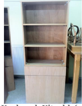
Kaplamalı Kitaplık (3) 40 TL

Birinci Sınıf Suntalam, 2 kapaklı 3 raflı olarak üretilmiştir.