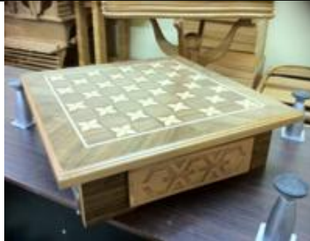
Çekmeceli Dama Tahtası (26) 25 TL

G:31 D:31 Y:80 ölçülerinde; 1. sınıf maun malzemeden üretilmiştir.