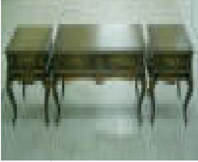
XV. Louis 3'lü Sehpa Takımı (43) 200 TL

G:60 D:60 Y:64 ölçülerinde, üst tabla yuvarlak formda ve 18 mm yonga levha üzeri kaplanmış, kenarları masiften kordon ve ayaklar tornalı çam masiften imal edilmiştir.