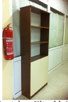
Suntalam Kitaplık (2) 75 TL

Birinci Sınıf Suntalam, 2 kapaklı 3 çekmeceli olarak üretilmiştir.