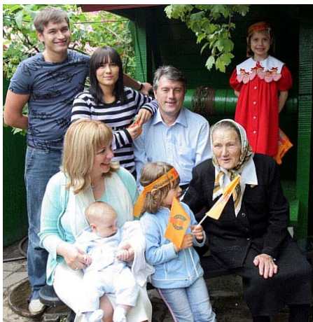
На задньому фоні - той самий колодязь Ющенка, з якого можна випити волв? Фото 2004

Президент Віктор Ющенко закликав громадськість бути солідарною в осуді будь-яких проявів антисемітизму і ксенофобії і заявив, що в цьому питанні держава буде займати жорстку позицію. Президент підкреслює, що обов'язок влади - захист прав громадян будь-якої національності і віросповідання. Тому українська влада, за його словами, і надалі буде послідовною у своїй позиції щодо боротьби з будь-якими проявами дискримінації людей у нашій державі за національними, расовими або релігійними ознаками. "У європейській країні не може бути національного питання", - підкреслює президент. Ющенко висловив стурбованість випадками антисемітизму в Україні. Президент засуджує політику Міжрегіональної академії управління персоналом як установи, яка "систематично дозволяє собі публікації, які можна