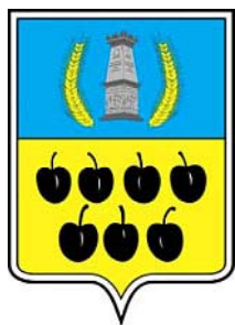
Герб Недригайлівського району

Як відомо, Хоружівка в житті українців відіграє велику роль. Це не тільки кадровий резерв для нової влади. Інколи скарга від односельчанина президента може призвести до ліквідації органу влади. Наприклад, останньою краплею, після якої Ющенко розігнав Державну автомобільну інспекцію, стало