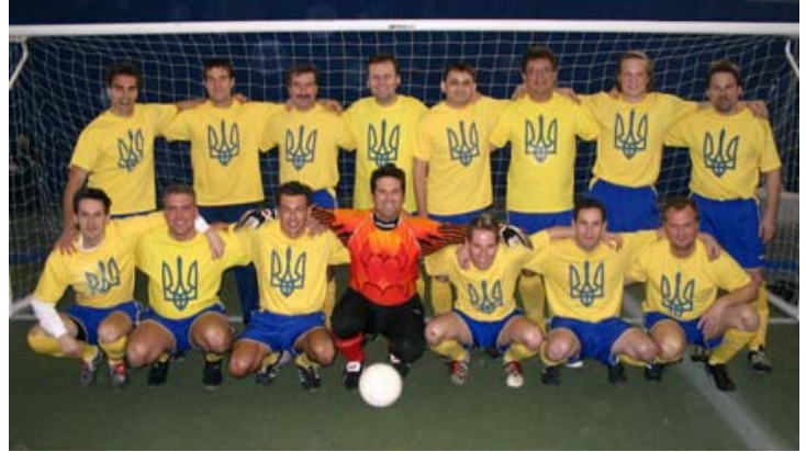
2005 / 2006 Ukraina Royals Team