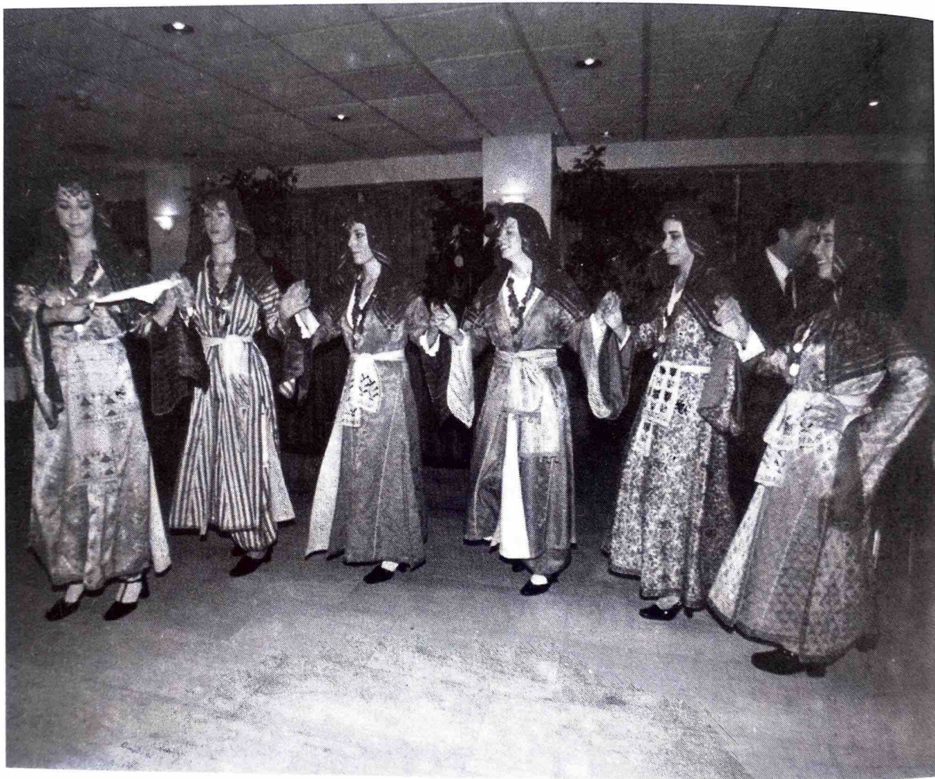
Κώτικοι παραδοσιακοί χοροί πλαισίωσαν την εκδήλωση