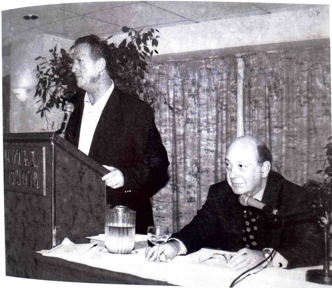
Ο υπουργός κ. Κώστας Σκανδαλίδης στο βήμα