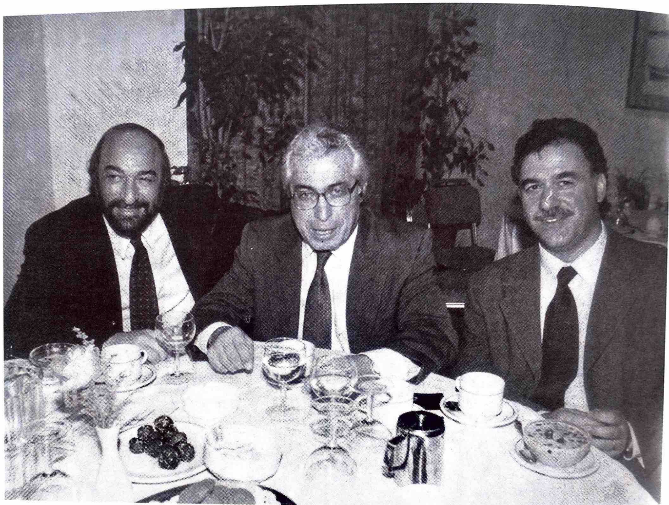
Εκλεκτές παρουσίες στην εκδήλωση: ο βουλευτής και πρ. υπουργός κ. Αρ. Παυλίδης ανάμεσα στους κ.κ. Γ. Νικητιάδη και Γ. Κυρίτση