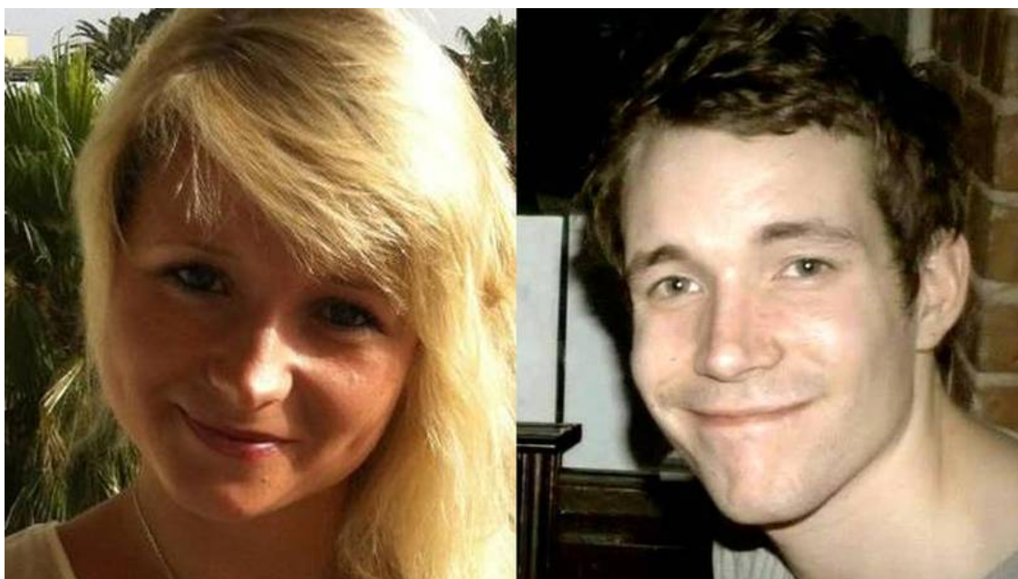
De to unge briter, der fik en grusom død på stranden i Koh Tao.