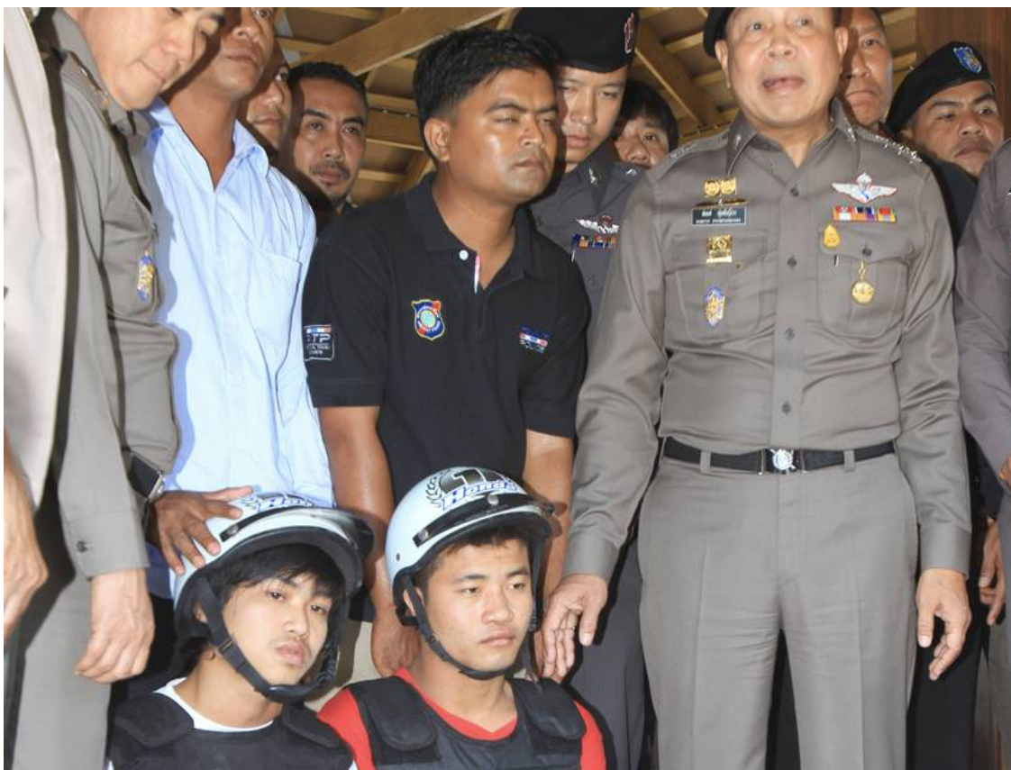
Politiet på Koh Tao fremviser stolt de to anholdte immigrant-arbejdere fra Myanmar, der i første omgang tilstod drabene på stranden.

Til BBC sagde det lokale politi, at gerningsmanden umuligt kunne være thailænder. I stedet rettede myndighederne søgelyset mod andre turister og fattige indvandrere fra nabolandet Myanmar, der på Koh Tao som andre steder i Thailand udnyttes som billig arbejdskraft.