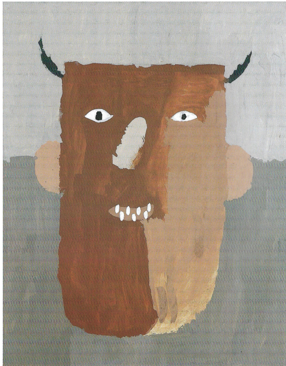
ILIJA BRKLJAČIĆ, 5. razred, Centar za odgoj djece i mladeži, Karlovac, Maškare, učiteljica: Đurđa Guštin