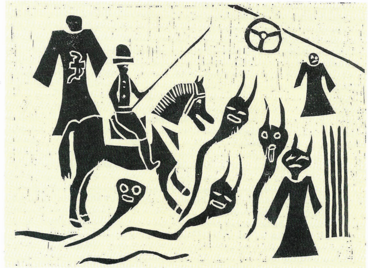
TOMISLAV HARAPIN, 7. razred, OŠ Mate Lovraka, Kutina, Sinjska alka, učiteljica: Lidija Veliki-Vukas