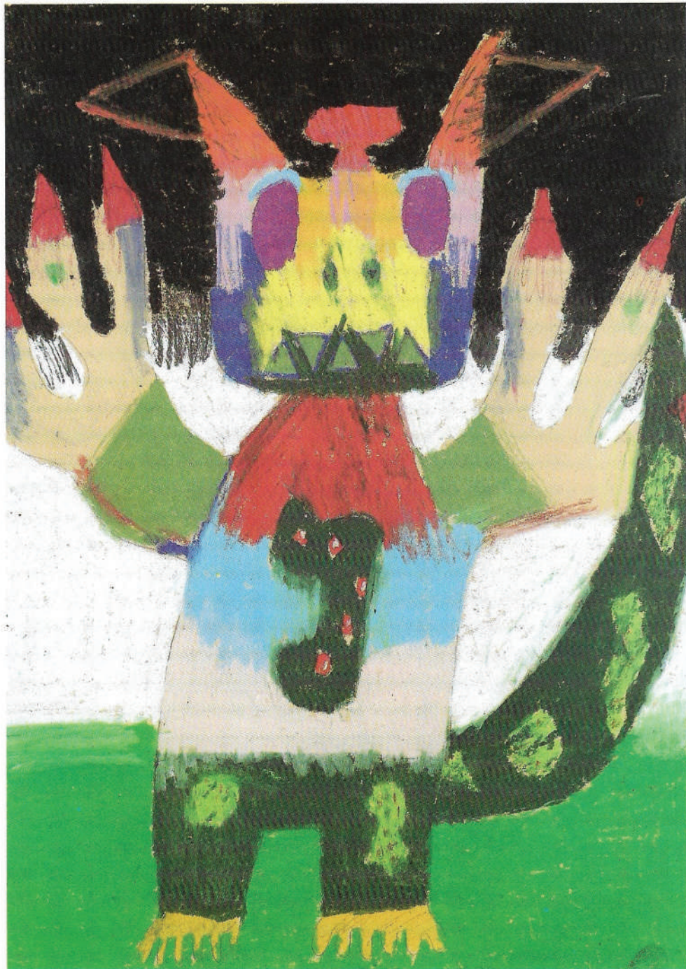
VEDRANA KOVAČIĆ, 6. razred, OŠ I. B. Mažuranić, Samobor, Potjeh, učiteljica: Nevenka Miklenič

Potreba čovjeka za bajkovitim stara je koliko i strah od neobjašnjivih pojava, koliko i misao o svijetu koji ga okružuje. Otisak ruke u pećini takova je misao, simbol kojim je čovjek prije 19 000 godina projicirao sebe u budućnost. Tako su do nas doprle priče, elementi različitih običaja i bajki koji govore o davnom vjerovanju u dublji smisao i poruku o našem postojanju. Bajkom bi se mogla nazvati pripovijest u kojoj se javlja proturječnost naših spoznaja o prirodnim zbivanjima, vjerovanje u čuda, protjerivanje demona, borba dobra i zla. Iako sve takove pripovjesti nazivamo bajkama one u sebi posjeduju moć da oblikovno zahvaćaju u sam život.