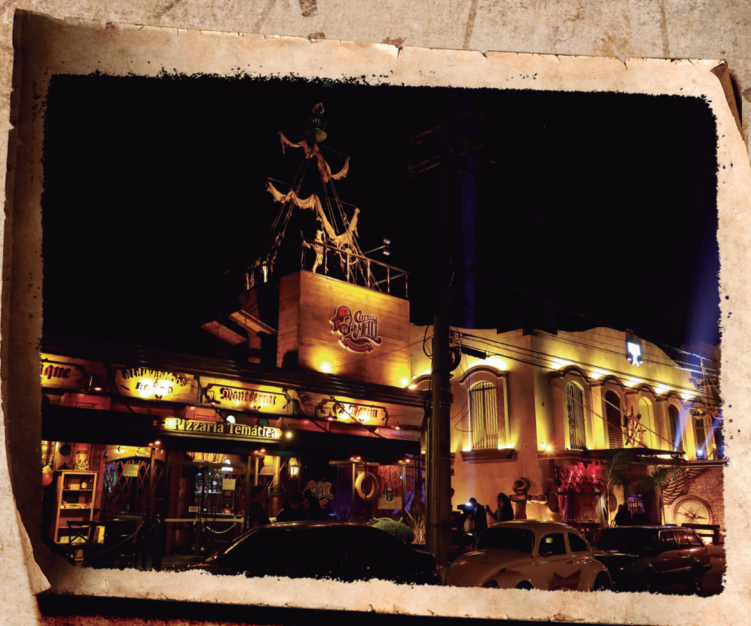
Porto e Navio ficam um do lado do outro.

O Navio Cara de Mau está atracado em Gramado desde 2009. Tantos anos trouxeram muitas novidades, além das pizzas e pratos a la carte. A famosa balada pirata acabou ficando pequena para o navio, por isso, os piratas da tripulação do Cara de Mau arregaçaram as mangas e construíram o Porto Cara de Mau, aqui do lado mesmo. O Porto serve rodízio de pizzas, tem a balada pirata e shows piratas também. Os piratas matam a fome e se divertem.