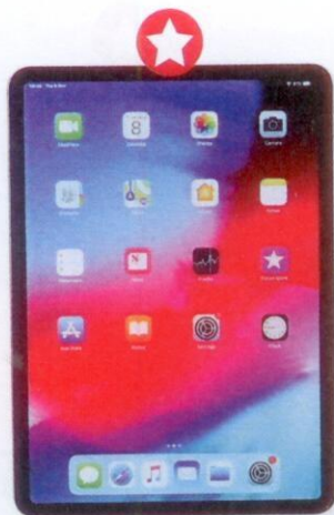
Apple iPad Pro 2018