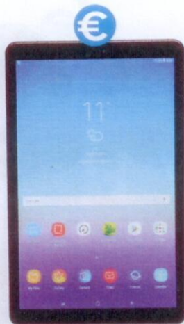
Samsung Galaxy Tab A