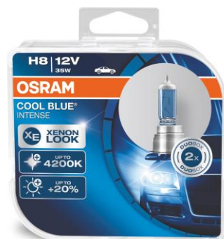
COOL BLUE® INTENSE