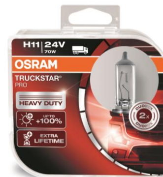
TRUCKSTAR® PRO (24B)