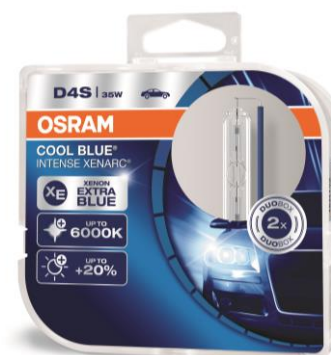
XENARC® COOL BLUE® INTENSE