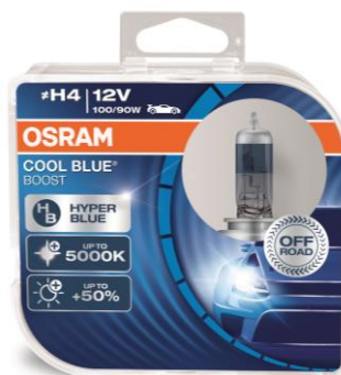
COOL BLUE® BOOST