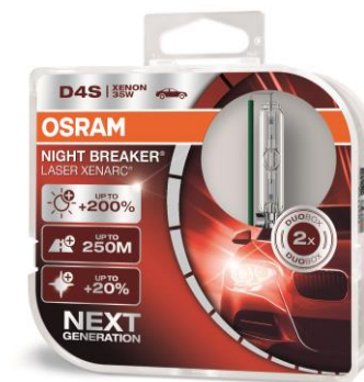
XENARC® NIGHT BREAKER® LASER