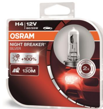
NIGHT BREAKER® SILVER