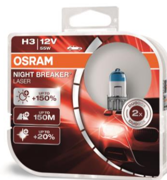
NIGHT BREAKER® LASER