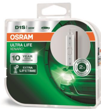
XENARC® ULTRA LIFE