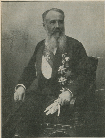
НИКОЛА ПАШИЋ Патријарх Српске Државе.

цуска унутра била потпуно ојачана и кад су вешто били спремљени сви савези са другим државама и изгледи за проширење границе Француске били одлични, Ришеље