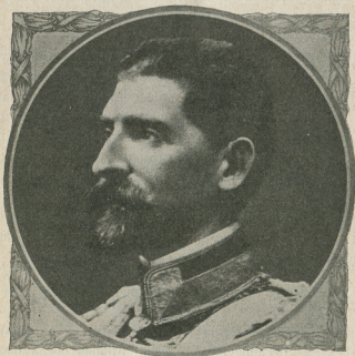
ФЕРДИНАНД I Краљ Румуније.

Угарску и Хрватску, пошто су били већ прегазили све државе на југу. Ти турски ратови били су „златна мајна” за Хабзбурговце. У току тих ратова они опљачкају већи део угарске и хрватске властеле; ову последњу униште са свим. На тај начин дођу до баснословног богатства и до силних земаља. Отетом земљом послужили су се да подигну најбољу војску оног доба — граничаре и шајкаше, који су се врбовали из српских досељеника