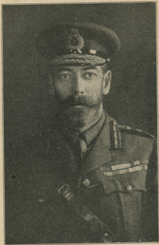
ЂОРЂЕ V. Краљ Велике Британије.

но царство преплаве у брзо немачка племена и обладају њим потпуно. Историја источног царства, све до пада Цариграда, није ништа друго до ли страшна прича о очај-