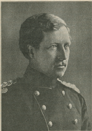
АЛБЕРТ Краљ Белије.

борбе са племићима, поседницима земље у граду и око града. Сва његова пажња била је посвећена тим месним, локалним, борбама и он је мало марио за то, што племићке војске гину и што провалници пале племићка