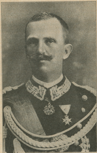
ВИКТОР ЕМАНУИЛО III. Италијански краљ.

тражили да им се та власт призна и да се на тај начин ограничи власт врховног господара. Ово је сасвим нова тежња, и потпуно различита од тежња великих и силних