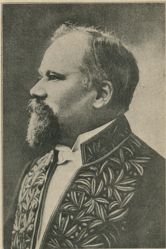
РЕЈМОНД ПОАНКАРЕ Председник Француске Републике.

Све ово учинило је да је сав тај свет у римској држави гледао нешто више: благодет послату с неба, творевину самих богова. Римска држава постала је једна