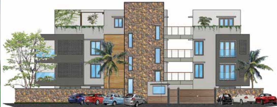
FAÇADE VUE CARLOS ROAD