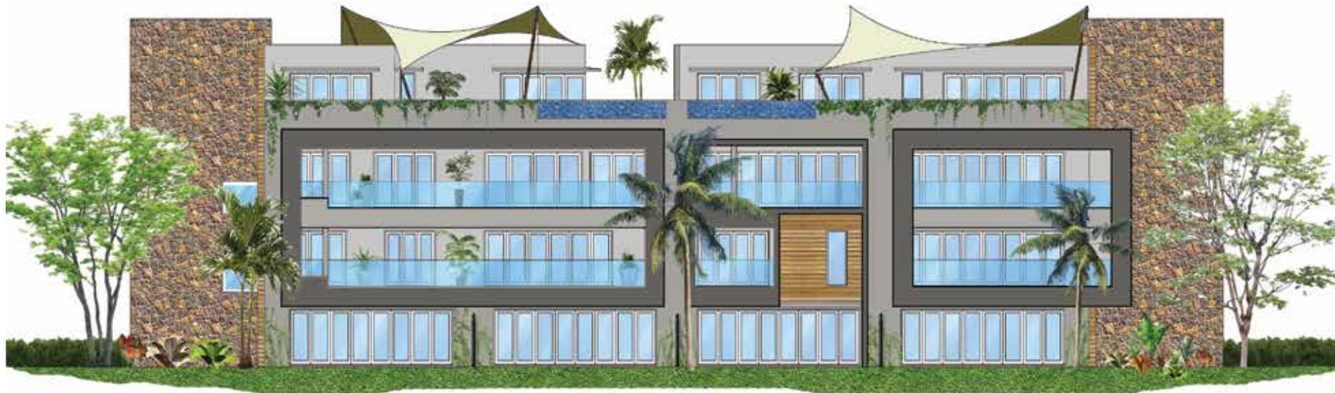
FAÇADE VUE MORNE