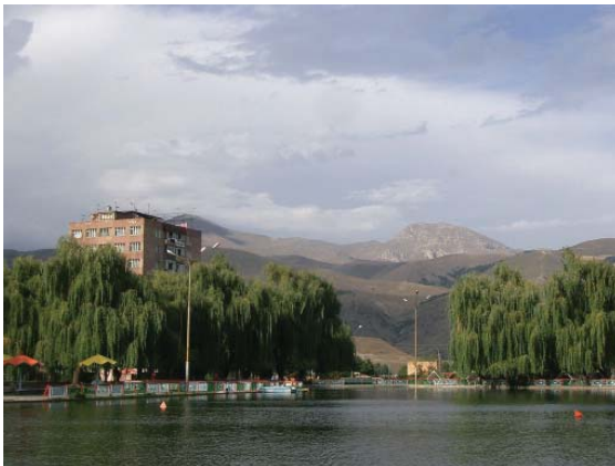
Տեսարան Վանաձոր քաղաքից

Վանաձոր: Վանաձորը ՀՀ երրորդ քաղաքն է (105 հազ. բն.), Լոռու մարզի