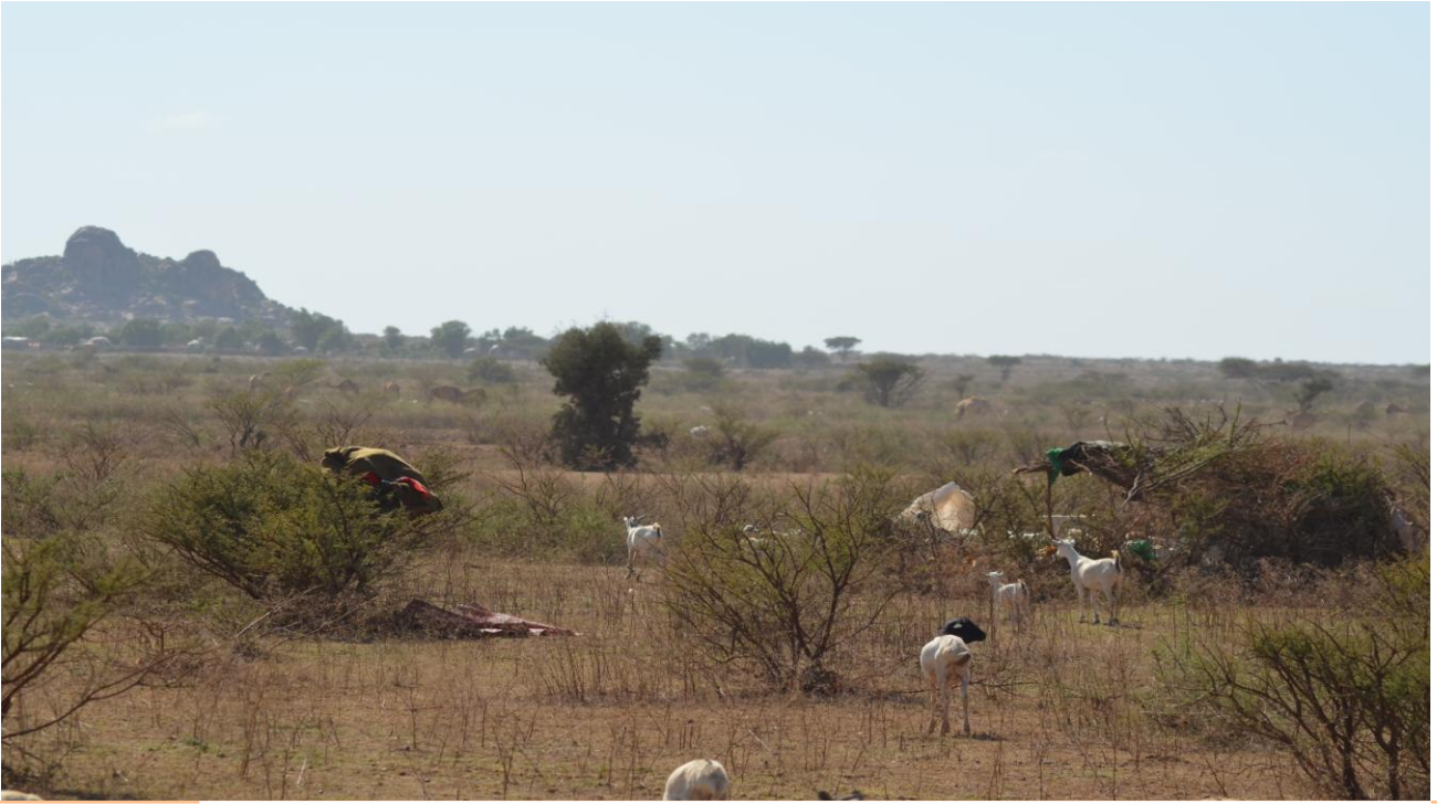
Sawir muujinaya xaaladda deegaanka ugu baadka ladan oo markaa gabaabsi ahaa, sawir-qaade: Axmed Kadleye