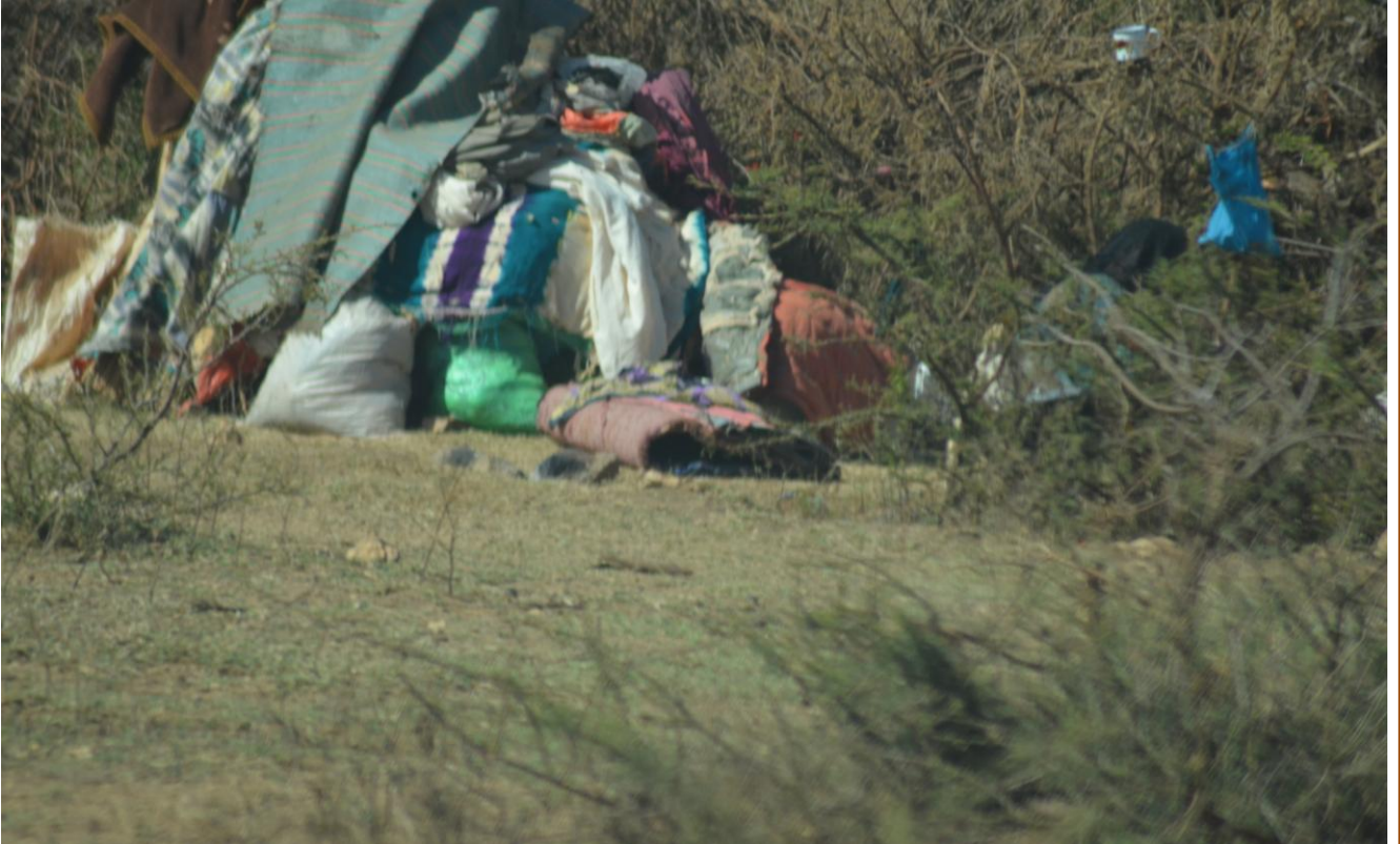
Sawir muujinaya agab la'aanta haysata Soo-Guurtada

oo noo sheegay inuu u yimid deegaanka si uu wax uga ogaado xaaladda caafimaad ee Soo-guurtada. Waannu is waraysannay. Wuxuu aad u xiisaynayay arrimaha siyaasadda. War-bixin Soo-Guurtada nagamuu siinnin, annaguna maannaan weydiinnin. Waxaannu arkaynay inaanu xiisaynaynin.