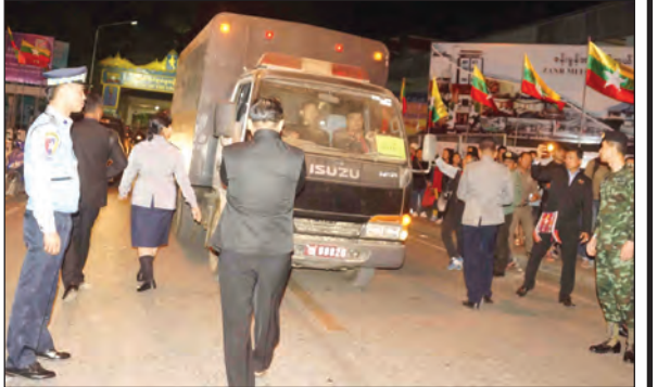
ထိန်းသိမ်းထားသည့် ထိုင်းနိုင်ငံသားများကို ချစ်ကြည်ရေးတံတား အမှတ်(၁)၌ ထိုင်းတာဝန်ရှိသူများထံ ပြန်လည်လွှဲပြောင်းပေးစဉ်

ထိုကဲ့သို့ တရားမဝင် ဝင်ရောက်နေထိုင်လျက်ရှိသည့် ထိုင်းနိုင်ငံသား ၈၀ ထဲတွင် ထိုင်းနိုင်ငံအစိုးရက အထူးလိုအပ်လျက်ရှိသော မူးယစ်ရာဇာ တရားခံပြေး ငါးဦးထက်မနည်း ပါဝင်ကြောင်းသိရှိရပြီး ၎င်းတို့နှင့်အတူ အခြားသောပြစ်မှုများမှ အရေးကြီးတရားခံများကို ထိုင်းနိုင်ငံမှ အချုပ်ကားနှစ်စီးဖြင့် တင်ဆောင်၍ ကျန်သူ များကို မှန်လုံကားဖြင့် တင်ဆောင်ကာ ချစ်ကြည်ရေးတံတား အမှတ်(၁)မှ တစ်ဆင့် ထိုင်းနိုင်ငံဘက်သို့ ပြန်လည်လွှဲပြောင်းပေးခဲ့ခြင်းဖြစ်ကြောင်း သိရသည်။ ခရိုင်(ပြန်/ဆက်)