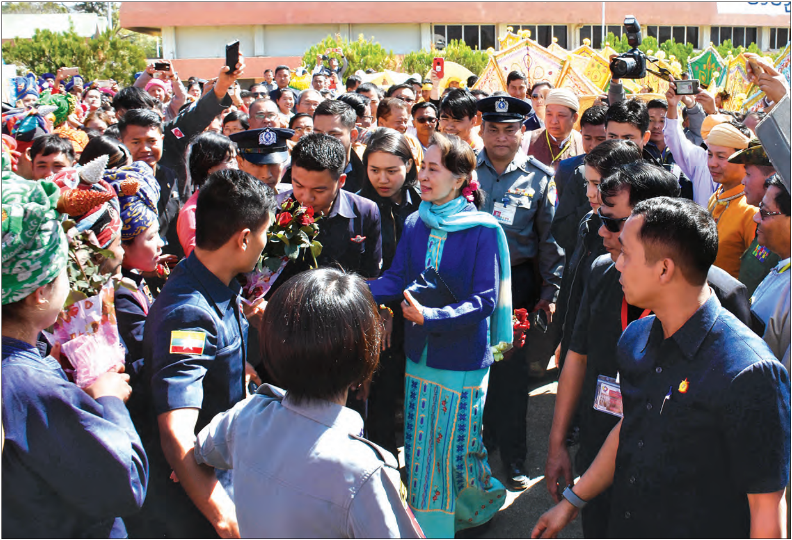
နိုင်ငံတော်၏ အတိုင်ပင်ခံပုဂ္ဂိုလ် ဒေါ်အောင်ဆန်းစုကြည်အား ဟဲဟိုးလေဆိပ်၌ လွှတ်တော်ကိုယ်စားလှယ်များနှင့် ဒေသခံတိုင်းရင်းသားများက ကြိုဆိုကြစဉ်။ သတင်းစဉ်

ရှမ်းပြည်နယ်၏ မြို့တော်ဖြစ်သော တောင်ကြီးမြို့တွင် ရပ်ပိုင်းဆိုင်ရာအရ တိုးတက်လာသည် မှန်သော်လည်း စိတ်ပိုင်းဆိုင်ရာအရ လိုအပ်ချက်များ ဖြစ်သည့် စိမ်းလန်းစိုပြည်မှုနှင့် သဘာဝအလှအပများ အားနည်းသွားသည်ကို တွေ့ရှိရသဖြင့် Master Plan တစ်ခု ရေးဆွဲကာ စနစ်တကျ ရေရှည်ပြုပြင်ဆောင်ရွက်ရန် လိုအပ်ပါကြောင်း၊ ထို့ပြင် ရှမ်းပြည်နယ်အတွင်း ဘိန်းအစားထိုးသုံးနှုန်းမှုကို အထူးအလေးထားပြီး စီစဉ်ပြင်ဆင်ဆောင်ရွက်ရန် လိုအပ်ပါကြောင်း၊ အစားထိုးစိုက်ပျိုးသည့် သီးနှံအတွက် နည်းပညာ၊ ဈေးကွက်၊ ရိတ်သိမ်းချိန်လွန်သိုလှောင်မှု၊ သယ်ယူပို့ဆောင်ရေး စသည်တို့ကိုပါ စနစ်တကျ စီစဉ်ဆောင်ရွက်နိုင်မှ အောင်မြင်နိုင်မည် ဖြစ်ပါကြောင်း၊ သတိပေးလိုသည်မှာ ပြည်နယ်အစိုးရအနေဖြင့် ပြည်ထောင်စုက ချမှတ်ထားသည့် မူဝါဒများအပေါ် သိရှိမှု အားနည်းနေသည်များ မဖြစ်စေရန် သတိပြုကြရန် လိုအပ်ပါကြောင်း၊ ပြည်သူ