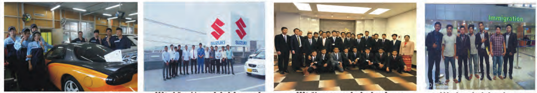
Okayama ကျောင်းတွင်မြန်မာ နှင့် ဂျပန် ကျောင်းသားများ ပူးတွဲလေ့ကျင့်သင်ကြားပုံ ၊ ဂျပန်နိုင်ငံ ၏ Suzuki ကားလုပ်ငန်းခွင်သို့သွားရောက် လေ့လာခဲ့သော GLORY ကျောင်းသားများ ၊ ဂျပန်နိုင်ငံ Okayama ကျောင်းတွင်တက်ရောက်နေသော GLORY ကျောင်းသားများ ၊ ဂျပန်နိုင်ငံသို့အလုပ်လုပ်ရန် ထွက်ခွာသွားသော GLORY ကျောင်းသားများ

GLORY Room NO. 3 / 4 ၊ တထဝ် ၊ ဗိုလ်မြတ်ထွန်းတောဝါ ၊ ဗိုလ်မြတ်ထွန်းလမ်း နှင့် မဟာဗန္ဓုလလမ်းထောင့်၊ ဗိုလ်တစ်ထောင်မြို့နယ်၊ ရန်ကင်းမြို့။ 09-73121717 , 09-5197817 Facebook - GLORY Career Training Centre