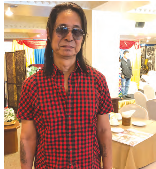
ကတော့ ဒီလိုလေးဆိုသင့်တယ် ဆိုတာမျိုးလောက်ပါ။ ကြိုးစားနေတဲ့ ကလေးတွေကို ဂီတပိုင်းကို သင်ပေးပြပေးတာမျိုးတွေ ကျွန်တော် အဓိကထားပြီး လုပ်ခဲ့ပါတယ်။ ဒိုင် လုပ်တာမျိုးမဟုတ်ဘဲ ဂီတပညာကို မျှဝေတဲ့သူအဖြစ်နဲ့ဆိုလည်း မမှားပါဘူး။ အားလုံး ကို ဂီတနဲ့ပတ်သက်ရင် ကြိုဆိုပြီးသားပါ" ဟုလည်း တေးရေး ဆရာစောခူဆဲလ်က ပြောသည်။