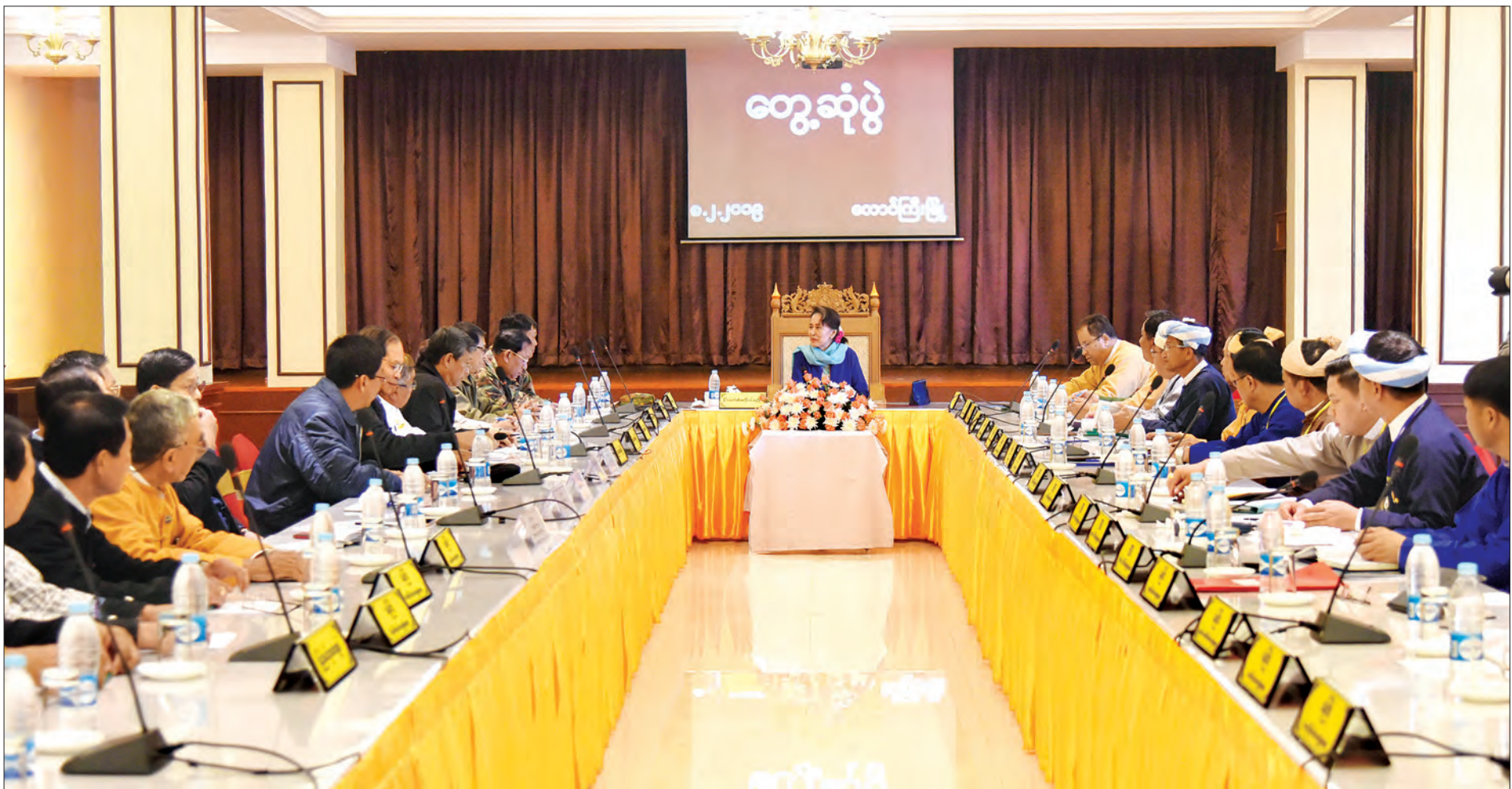
နိုင်ငံတော်၏ အတိုင်ပင်ခံပုဂ္ဂိုလ် ဒေါ်အောင်ဆန်းစုကြည် တောင်ကြီးမြို့၌ ရှမ်းပြည်နယ်အစိုးရအဖွဲ့ဝင်များနှင့် တွေ့ဆုံစဉ်။ သတင်းစဉ်