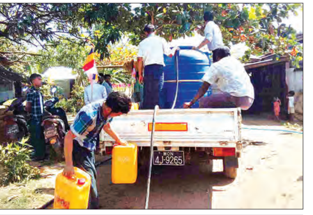
သောက်သုံးရေ လိုအပ်နေသည့် ဘီးလင်းမြို့နယ် ဂွသောင်ကျေးရွာမှ ပြည်သူများအတွက် မြို့နယ်ကျေးလက်ဒေသဖွံ့ဖြိုးတိုးတက်ရေးဦးစီးဌာနမှ ဝန်ထမ်းများ ဖေဖော်ဝါရီ ၇ ရက်က ရေဂါလန် ၅၅၀ သွားရောက်လှူဒါန်းစဉ်။ မြို့နယ်(ပြန်/ဆက်)