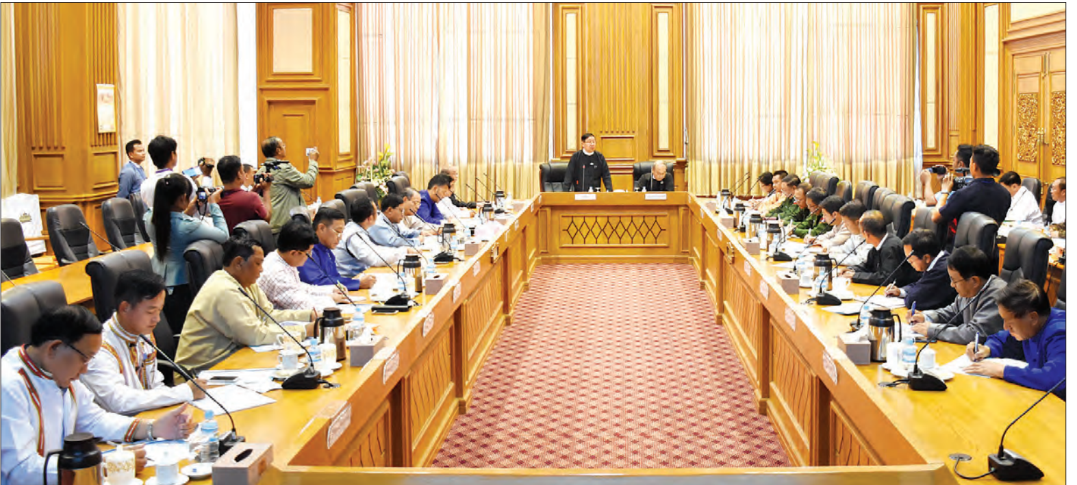
ပြည်ထောင်စုလွှတ်တော်နာယက၊ ပြည်သူ့လွှတ်တော်ဥက္ကဋ္ဌ ဦးတီခွန်မြတ် အမှာစကားပြောကြားစဉ်။ သတင်းစဉ်

နေပြည်တော် ဖေဖော်ဝါရီ ၈ ဖွဲ့စည်းပုံအခြေခံဥပဒေ(၂၀၀၈ ခုနှစ်) ပြင်ဆင်ရေးပူးပေါင်းကော်မတီတစ်ရပ် ဖွဲ့စည်းရေးနှင့်စပ်လျဉ်းသည့် ညှိနှိုင်း အစည်းအဝေးကို ယနေ့မုန်းလွဲ ၁ နာရီ တွင် နေပြည်တော်ရှိ လွှတ်တော် အဆောက်အအုံ ဇေယျသီရိဆောင် အစည်းအဝေးခန်းမ၌ ကျင်းပသည်။ အစည်းအဝေးသို့ ပြည်ထောင်စု လွှတ်တော်နာယက၊ ပြည်သူ့လွှတ်တော် ဥက္ကဋ္ဌ ဦးတီခွန်မြတ်၊ အမျိုးသား လွှတ်တော်ဥက္ကဋ္ဌ မန်းဝင်းခိုင်သန်း၊ ပြည်ထောင်စုလွှတ်တော်ဒုတိယနာယက၊ ပြည်သူ့လွှတ်တော်ဒုတိယဥက္ကဋ္ဌ ဦးထွန်းအောင်(ခ)ဦးထွန်းထွန်းဟိန်၊ လွှတ်တော် အတွင်းရှိ နိုင်ငံရေးပါတီများနှင့် တပ်မတော်သားလွှတ်တော် ကိုယ်စား လှယ်များအစုအဖွဲ့မှ လွှတ်တော် ကိုယ်စားလှယ်များ၊ လွှတ်တော်ရုံး အသီးသီးမှ ညွှန်ကြားရေးမှူးချုပ်များ နှင့် တာဝန်ရှိသူများ တက်ရောက်ကြ သည်။ စာမျက်နှာ ၄ ကော်လံ ၁ ❖