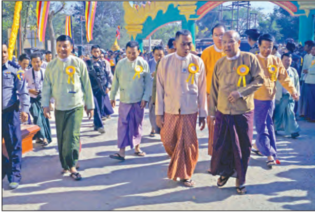
မကွေးတိုင်းဒေသကြီးဝန်ကြီးချုပ်အား ဖွင့်ပွဲအပြီး တွေ့ရစဉ်

သာသနာ့သမိုင်းဝင် စန္ဒကူးနံ့သာကျောင်းတော်ရာဘုရားကြီးသို့ အနယ်နယ် အရပ် ရပ်မှ လာရောက်ကြည့်ရှုမည့် ဘုရားဖူးပြည်သူများ စိတ်အေးချမ်းသာစွာ ဝင်ထွက်သွားလာ ဖူးမြော်နိုင်စေရန် ရည်ရွယ်၍ တည်ဆောက်ပြီးစီးခဲ့သည့် ဘုရားကြီးတောင်ဘက်အဝင်