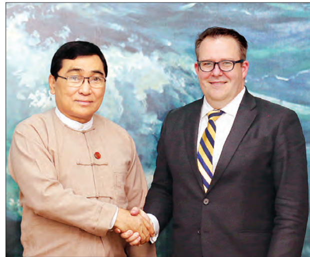
ပြည်ထောင်စုဝန်ကြီး ဒေါက်တာဝင်းမြတ်အေး အာရှနှင့် အမေရိကနိုင်ငံများဆိုင်ရာ အဖွဲ့ ဒုတိယအတွင်းရေးမှူး Mr. Ben King အား ရင်းရင်းနှီးနှီး နှုတ်ဆက်စဉ်။

ဆွေးနွေး အလားတူအမေရိကန်သံအမတ်ကြီးနှင့် တွေ့ဆုံစဉ် မြန်မာနိုင်ငံ၏ လူကုန်ကူးမှု