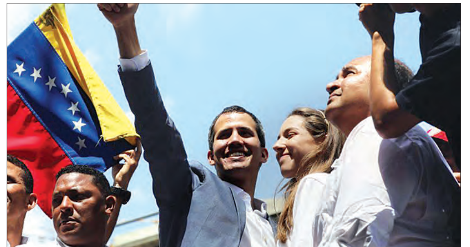
ပင်နီစွဲလားအတိုက်အခံခေါင်းဆောင် ဂျူအန်ဂျိုက်ဒို

ပင်နီစွဲလားနိုင်ငံအတွင်း လူသားချင်းစာနာမှုဆိုင်ရာ အကူအညီများကို နိုင်ငံတကာက ပေးနေသော်လည်း ပင်နီစွဲလားလက်ရှိသမ္မတ မာဒူရိုက တားမြစ်ရန် အမိန့်ထုတ်ပြန်ထားသေးကြောင်း သိရသည်။ အေအက်မ်