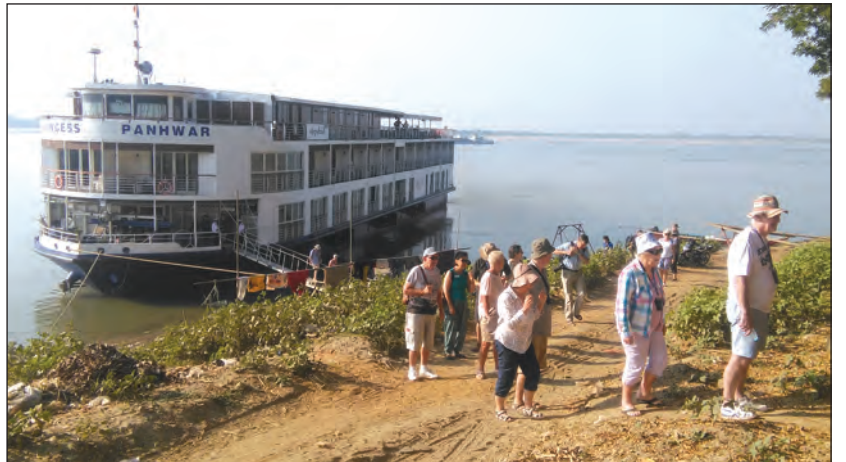
မြင်းမူဆိပ်ကမ်း၌ ရပ်တန့်ထားသော ခရီးသွားသင်္ဘောတစ်စင်းနှင့် မြို့တွင်းဝင်ရောက်ကြမည့် နိုင်ငံခြားသားများ

နိုင်ငံခြားသား ခရီးသွားအဖွဲ့များသည် မြင်းမူမြို့သို့ ခရီးတစ်ထောက်ရောက်ရှိချိန်တွင် ဆိုက်ကားများဖြင့် မြင်းမူမြို့အတွင်း လှည့်လည်ကြပြီး မြို့မဈေးအတွင်းမှ ဈေးသည်များ၏ ရောင်းဝယ်ဖောက်ကားနေမှုများနှင့် မြင်းမူမြို့၏ ရိုးရာလုပ်ငန်းတစ်ခုဖြစ်သော ဝါးဖြင့် ထရုံ ဝါးကပ်များ ရက်လုပ်သည့်လုပ်ငန်းများကို ကြည့်ရှု လေ့လာ ဓာတ်ပုံရိုက်ကူးခြင်းများ ပြုလုပ်ကြကြောင်း သိရသည်။ အောင်စိုးဖေ(မြင်းမူ)