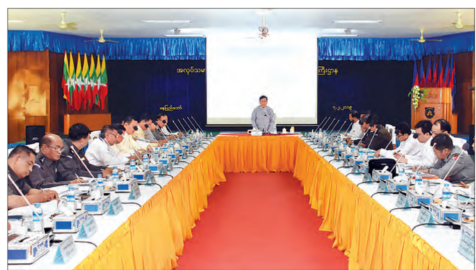
e-ID စနစ်လုပ်ငန်းကော်မတီ၏ ဒုတိယအကြိမ် လုပ်ငန်းညှိနှိုင်းအစည်းအဝေး ကျင်းပစဉ်။ သတင်းစဉ်

e-ID လုပ်ငန်းအကောင်အထည်ဖော်ရာတွင် နိုင်ငံတော်အစိုးရ အစီအစဉ်၊ နိုင်ငံတကာ အဖွဲ့အစည်းများ၏ အကူအညီ၊ အစိုးရ-ပုဂ္ဂလိက အကျိုးတူ ပူးပေါင်းဆောင်ရွက်မှု (PPP) စနစ်တို့ဖြင့် ဆောင်ရွက်နိုင်ရေးအတွက် ဆွေးနွေးအကြံပြုရန် လိုအပ်ကြောင်း၊ e-ID စနစ်ကို စတင်အကောင်အထည်ဖော်နိုင်ရန်အတွက် နိုင်ငံတကာ ကျွမ်းကျင်ပညာရှင်များပါဝင်သည့် အကြံပေးဝန်ဆောင်မှု