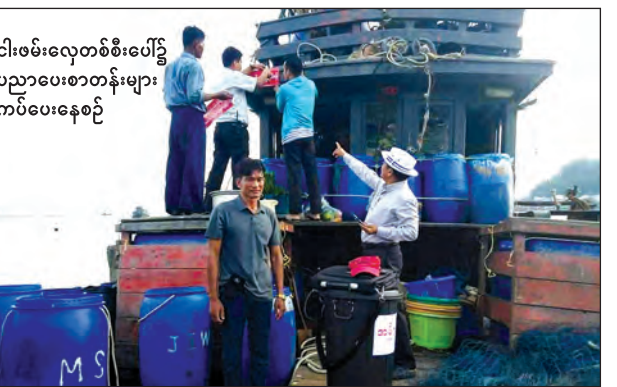
ငါးဖမ်းလှေတစ်စီးပေါ်၌ ပညာပေးစာတန်းများ ကပ်ပေးနေစဉ်

လှေများပေါ်တွင် အမှိုက်ပစ်မှုများ လိုက်လံထားရှိပေးခြင်း၊ အမှိုက်များကို ပင်လယ်ပြင် အတွင်း စည်းကမ်းမဲ့ပစ်ချခြင်းမပြုရန်နှင့် အမှိုက်ပုံထဲသို့သာ စနစ်တကျပစ်ချရန် သတိပေးစာတန်းများကို ငါးဖမ်းလှေစုများတွင် လိုက်လံကပ်ပေးခြင်းများ ဆောင်ရွက် ခဲ့သည်။ ထို့အပြင် ငါးဖမ်းလှေယာဉ်များ ပြန်လည်ဝင်ရောက်ချိန်တွင် အမှိုက်ပစ်ရန်နှင့် အမှိုက်ပစ်မှုများကို စစ်ဆေးရန် Fishing log Book နေ့စဉ်ရေးသွင်းရန် ငါးဖမ်းလှေ များအနေဖြင့် နံပါတ်ပြားများကိုဖုံးအုပ်၍ ငါးဖမ်းခြင်းနှင့် ခုတ်မောင်းသွားလာခြင်း လုံးဝမပြုလုပ်ရန်၊ ငါးဖမ်းလုပ်ငန်းများကို သတ်မှတ်ရေယာဉ်များအလိုက်သာ လုပ်ကိုင် ကြရန် စသည့်တို့ကိုလည်း ရေလုပ်သားများနှင့် ပုံနှင်းများအား အသိပညာပေး ဟောပြောခဲ့ကြောင်း သိရသည်။ ကျော်စိုး(ကော့သောင်း)