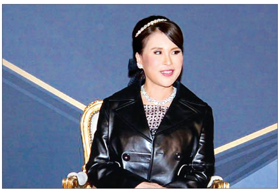
ဝန်ကြီးချုပ်လောင်းအဖြစ် အမည်စာရင်းတင်သွင်းခြင်းခံရသော ထိုင်းတော်ဝင်မင်းသမီး အူဘိုလ်ရာတာနာ မဟီဒေါ