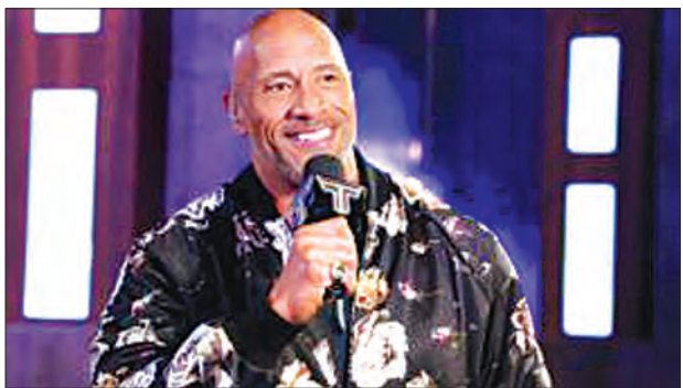
ဒဝိန်းဂျွန်ဆင်