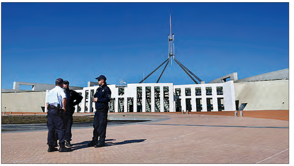
ဆိုက်ဘာတိုက်ခိုက်ခံရသည့် သြစတြေးလျလွှတ်တော်နှင့် လုံခြုံရေးဝန်ထမ်းများကို တွေ့ရစဉ်။

ဝန်ကြီးချုပ် စကော့တ်မော်ရစ်ဆင်က အစိုးရဌာနများ သို့မဟုတ် အေဂျင်စီများကို ဦးတည်ပြီး ယခုကဲ့သို့ ဆိုက်ဘာကျူးကျော်တိုက်ခိုက်မှုပြုလုပ်သည့် ကိစ္စနှင့်ပတ်သက်ပြီး ပြောမပြတ်အောင်ဖြစ်ရကြောင်း ပြောခဲ့သလို သြစတြေးလျ အချက်အလက်ညွှန်ကြားရေးဌာနက ဆိုက်ဘာတိုက်ခိုက်ခံရသည့် ကိစ္စလွှတ်တော်နှင့်ပေါင်းပြီး ပြန်လည်တုံ့ပြန်မှု ပြုလုပ်သွားမည်ဖြစ်ကြောင်း ပြောခဲ့သည်။