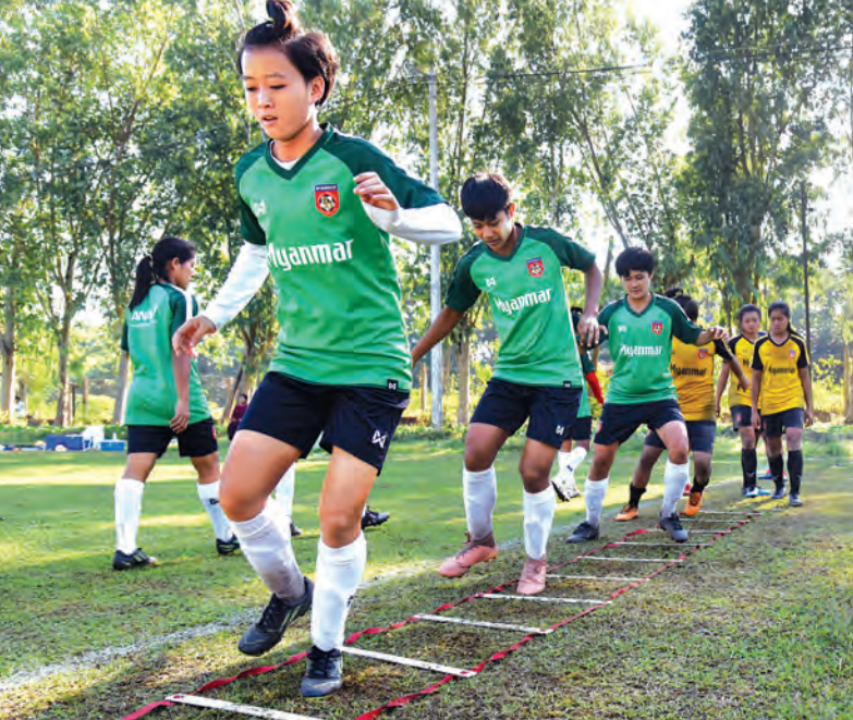
မြန်မာ ယူ-၁၆ အမျိုးသမီးအသင်း လေ့ကျင့်နေစဉ်။

ရန်ကုန် ဖေဖော်ဝါရီ ၈ ၂၀၁၉ အာရှ ယူ-၁၆ အမျိုးသမီးခြေစမ်းပွဲ ဒုတိယအဆင့် အတွက် ပြင်ဆင်မှုအဖြစ် ဩစတြေးလျနိုင်ငံ၌ လေ့ကျင့် မည့် မြန်မာ ယူ-၁၆ အမျိုးသမီးအသင်းသည် ယင်း ခြေစမ်းခရီးစဉ်တွင် ခြေစမ်းပွဲသုံးပွဲ ယှဉ်ပြိုင်ကစားမည် ဖြစ်သည်။ မြန်မာ ယူ-၁၆ အမျိုးသမီးအသင်းသည် ဖေဖော်ဝါရီ ၉ ရက်မှ ၁၈ ရက်အထိ သွားရောက်လေ့ကျင့်မည်ဖြစ် ပြီး ခြေစမ်းပွဲမတိုင်မီ အပြီးသတ်ပြင်ဆင်မှုများ ပြုလုပ် မည် ဖြစ်သည်။ မြန်မာ ယူ-၁၆ အမျိုးသမီးအသင်းသည် ဖေဖော်ဝါရီ ၁၅၊ ၁၇ ရက်တွင် ဩစတြေးလျ ယူ-၁၆ အသင်း နှင့် ခြေစမ်းပွဲနှစ်ပွဲ ကစားမည်ဖြစ်ပြီး ဖေဖော်ဝါရီ ၁၂ ရက်တွင်မူ ဒေသခံလူငယ်အမျိုးသမီးအသင်းနှင့် ယှဉ်ပြိုင် ကစားမည်ဖြစ်သည်။ မြန်မာ ယူ-၁၆ အမျိုးသမီးအသင်းသည် အာရှ ခြေစမ်းပွဲအတွက် ရွေးချယ်ထားသည့် ကစားသမား ၂၃ ဦးဖြင့် သွားရောက်မည်ဖြစ်ပြီး ဒဏ်ရာပြင်းထန်စွာရှိ မှသာ အပြောင်းအလဲ ပြုလုပ်မည်ဖြစ်သည်။ မြန်မာ ယူ-၁၆ အမျိုးသမီးအသင်းသည် အာရှခြေစမ်းပွဲအောင်မြင် ရန် အခွင့်အရေးရှိနေသောကြောင့် မြန်မာနိုင်ငံ စာမျက်နှာ ၁၂ ကော်လံ ၁ ❖