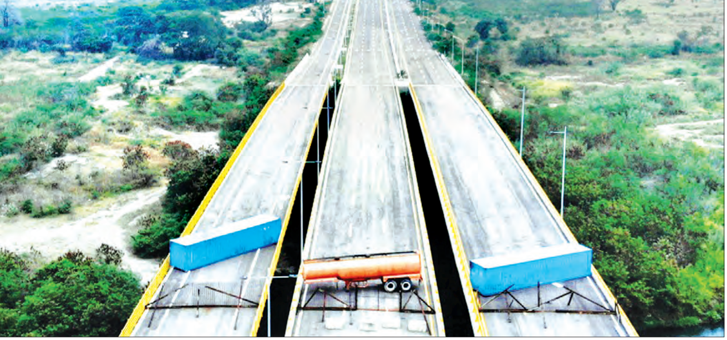
ကိုလံဘီယာနှင့် ပင်နီစွဲလားနယ်စပ်တံတားပေါ်တွင် လူသားချင်းစာနာထောက်ထားမှုအကူအညီများ ဝင်ရောက်မလာစေရန် ပိတ်ဆို့ထားမှုကို တွေ့ရစဉ်။

ပင်နီစွဲလားမှာ စစ်ဘက်အာဏာပိုင်တွေက လူသားချင်းစာနာထောက်ထားမှု အကူအညီအထောက်အပံ့တွေ ဝင်ရောက်လာမယ့် အဓိကနေရာဖြစ်တဲ့ နယ်စပ်တံတားကို ပိတ်ဆို့လိုက်တာကြောင့် အမေရိကန်ဘက်က ဒေါသတကြီး တောင်းဆိုမှုတွေ ဖြစ်လာရပါတယ်။ ဒီလိုဖြစ်ပြီး ဗုဒ္ဓဟူးနေ့မှာ အတိုက်အခံခေါင်းဆောင် ဂျူအန်ဂျီကီဒိုက ဒီလုပ်ရပ်မှာ တပ်မတော်အနေနဲ့ တာဝန်ရှိကြောင်း သတိပေးခဲ့ပါတယ်။