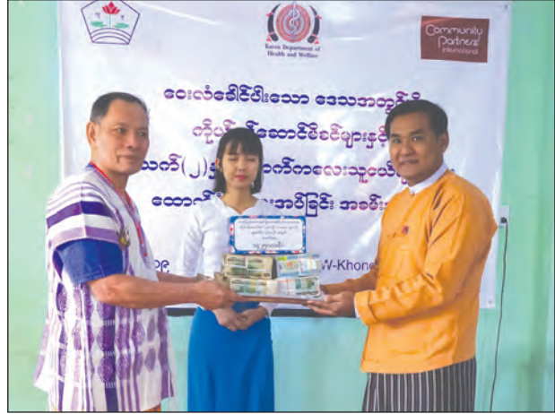
ဗမာတိုင်းရင်းသားလူမျိုးရေးရာဝန်ကြီးက ထောက်ပံ့ငွေများ ပေးအပ်နေစဉ်