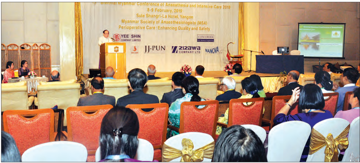
ပြည်ထောင်စုဝန်ကြီး ဒေါက်တာမြင့်ထွေး (၁၃)ကြိမ်မြောက် မြန်မာနိုင်ငံ မေဆေးပညာရှင်များ ညီလာခံဖွင့်ပွဲအခမ်းအနားတွင် အမှာစကား ပြောကြားစဉ်။

ယင်းနောက် ပြည်ထောင်စုဝန်ကြီးသည် ညီလာခံအထိမ်းအမှတ်ပြခန်းများကို ဖဲကြိုးဖြတ်ဖွင့်လှစ်ပေးပြီး ပြခန်းများကို လှည့်လည်ကြည့်ရှုကြသည်။ အဆိုပါ ညီလာခံကို ဖေဖော်ဝါရီ ၉ ရက်အထိ ကျင်းပသွားမည်ဖြစ်ပြီး ထိုင်း၊ မလေးရှား၊ စင်ကာပူ၊ တရုတ်၊ ယူကေ၊ နယ်သာလန်၊ အီတလီ၊ ဩစတြေးလျ၊ အမေရိကန်၊ ယူအေအီး၊ အိန္ဒိယနှင့် ဂျပန်နိုင်ငံတို့မှ မေဆေးပညာရှင်ကြီး ၆၀ နှင့် မြန်မာနိုင်ငံမှ မေဆေးပညာရှင်ကြီး