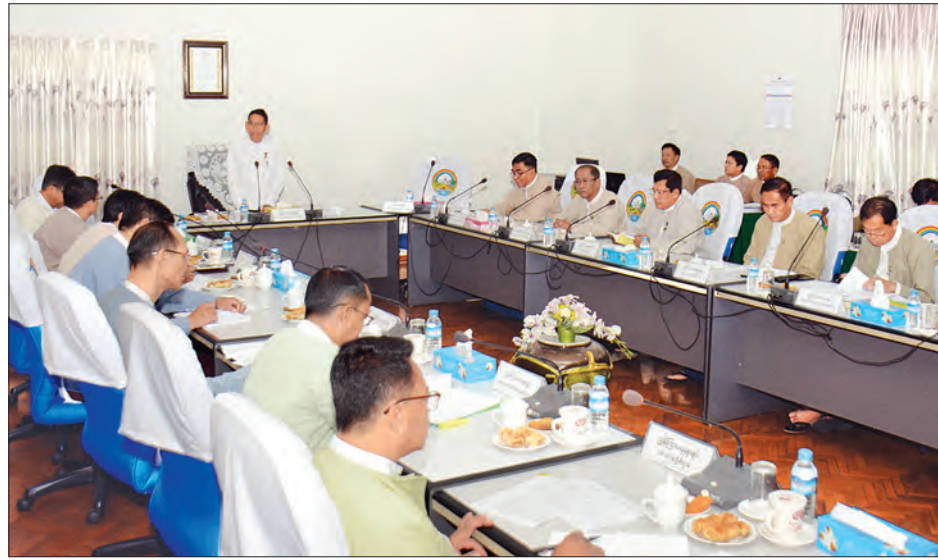
ဗဟိုလယ်ယာမြေစီမံခန့်ခွဲမှုအဖွဲ့၏ (၁၈)ကြိမ်မြောက် လုပ်ငန်းညှိနှိုင်းအစည်းအဝေး ကျင်းပစဉ်။ သတင်းစဉ်

ဒဏ်ကြေးချမှတ်ရေး ဆွေးနွေး ယနေ့ကျင်းပပြုလုပ်သော ဗဟိုလယ်ယာမြေစီမံခန့်ခွဲမှုအဖွဲ့၏ (၁၈)ကြိမ်မြောက် လုပ်ငန်းညှိနှိုင်းအစည်းအဝေးတွင် နိုင်ငံတော်၏ စီမံကိန်းလုပ်ငန်းများ ဆောင်ရွက်ရန် သိမ်းယူခဲ့သည့် လယ်ယာမြေများအတွက် နစ်နာကြေး၊ လျော်ကြေးပေးချေရန် ကိစ္စရပ်များ၊ လယ်ယာမြေကို အခြားနည်းဖြင့်