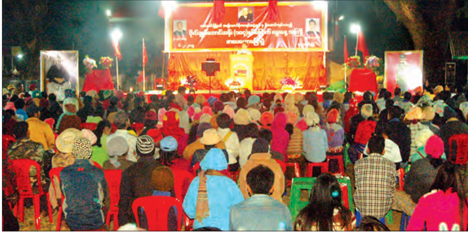
ကောလင်းမြို့နယ်၌ မြို့နယ်အမျိုးသားဒီမိုကရေစီအဖွဲ့ချုပ်က ဦးဆောင်၍ လူမှုရေးအသင်းအဖွဲ့များ ပါဝင်ပူးပေါင်းကျင်းပ သော ဗိုလ်ချုပ်အောင်ဆန်း၏ (၁၀၄) နှစ်မြောက် မွေးနေ့အကြို စာပေဟောပြောပွဲကို ဖေဖော်ဝါရီ ၆ ရက်က အခြေခံ ပညာ အလယ်တန်းကျောင်းခွဲ မြောက်အင်း၌ ကျင်းပစဉ်။ (ဟောပြောပွဲတွင် စာရေးဆရာ ထွန်းသန်းအိမ်နှင့် ဦးဘုန်း(ဓာတု)တို့ ဟောပြောခဲ့ကြောင်း သိရသည်။) မြို့နယ်(ပြန်/ဆက်)