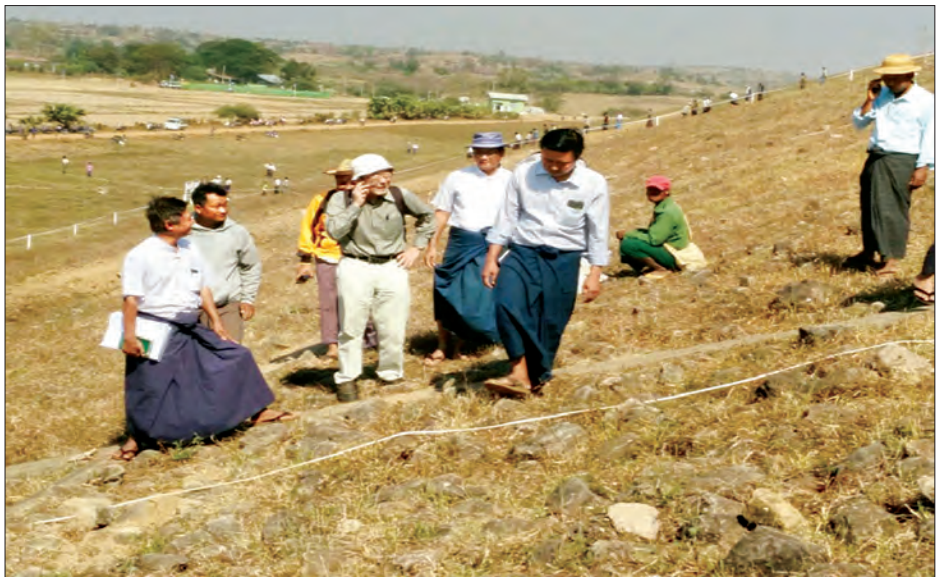
ဖေဖော်ဝါရီ ၈ ရက်က ဂျပန်ဘူမိဗေဒပညာရှင်နှင့် တာဝန်ရှိသူများ ကွင်းဆင်းစစ်ဆေးစဉ်။