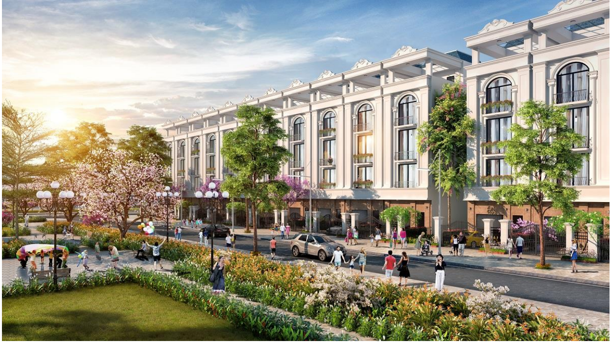
Phối cảnh liền kề Green Dragon City Cẩm Phả