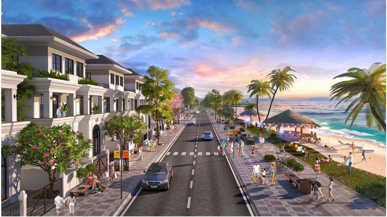
Phối cảnh biệt thự Green Dragon City Cẩm Phả