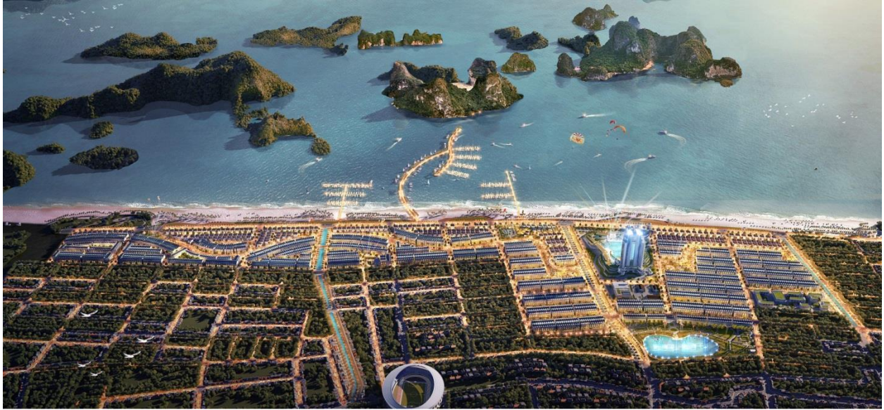
Phối cảnh dự án Green Dragon City Cẩm Phả

Green Dragon City ra đời với mục tiêu để trở thành đô thị xanh, hiện đại và thông minh, nơi đáng sống nhất TP Cẩm Phả. Có thể nhận thấy hiện nay trên thị trường, dự án khu đô thị cao cấp có view biển đẹp rất hiếm và Green Dragon City là dự án duy nhất sở hữu vị trí đất giá với 100% các căn biệt thự có view biển vịnh Bái Tử Long tuyệt đẹp. Điều này minh chứng cho giá trị của bất động sản tại đây luôn tăng giá theo thời gian, mang lại nguồn đầu tư sinh lời bền vững cho chủ nhân.