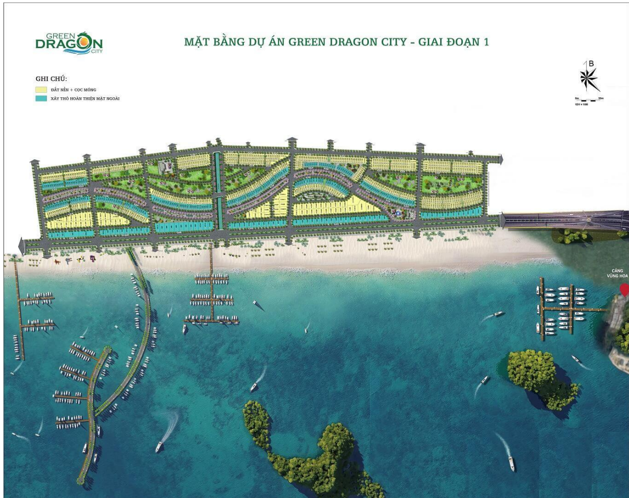
Mặt bằng dự án Green Dragon City Cẩm Phả giai đoạn 1