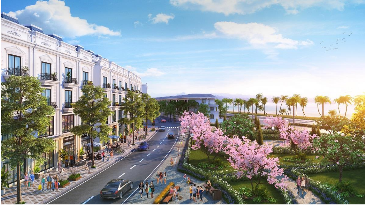
Phối cảnh shophouse Green Dragon City Cẩm Phả

Những dãy nhà phố shophouse, nhà liền kề tại dự án là những khu phố thương mại sầm uất quanh năm sẽ làm thỏa mãn nhu cầu mua sắm của du khách. Đặc biệt, thành phố Little Tokyo – Thành phố Nhật Bản thu nhỏ sẽ có mặt tại đây. Lấy ý tưởng từ “thành phố không ngủ” Tokyo – trái tim của nước Nhật. Với mô hình “5 in 1” – tích hợp 5 dịch vụ trong cùng 1 điểm đến đầy độc đáo: Lưu trú, ẩm thực, vui chơi, giải trí, mua sắm. Tiểu khu Little Tokyo được quy hoạch thành các khu phố kinh doanh sầm uất: Phố ẩm thực Nhật, phố giải trí KTV, phố Spa và tắm khoáng Onsen 7 bước kiểu Nhật, phố đi bộ và câu lạc bộ đêm... sẽ trở thành biểu tượng mới về sự năng động, phồn vinh và náo nhiệt của một thành phố không ngủ giữa lòng đất mỏ.