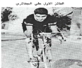
الفائز الأول على الجفازي

يطلق مسابقات نادي أديسة الرياضي على الجفازي، أن يحقق فوزا باهرا في سباق التجريبية النهائية لبطولة المحافظات الغربية للمباريات على الطويق، وغوزه