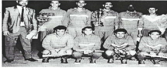
فريق الاتحاد لكرة السلة

ثم يلقي الفائزان للتأخر على الترتيب الأول والثاني، ويلتقي الخامس والسادس على الترتيب الثالث والرابع، وفي نهاية اللقاء تحصل الدكتور على الميداليه ونجى النجمة الذهبية للشهبة بشام كأمم البطولة التي فاضت منقوسه وكس فريق الاتحاد، وكان المرتبة القاسية التي رفض فريق الوحدة، وشهادت التي الحاصلين على الترتيب الثالث والرابع.