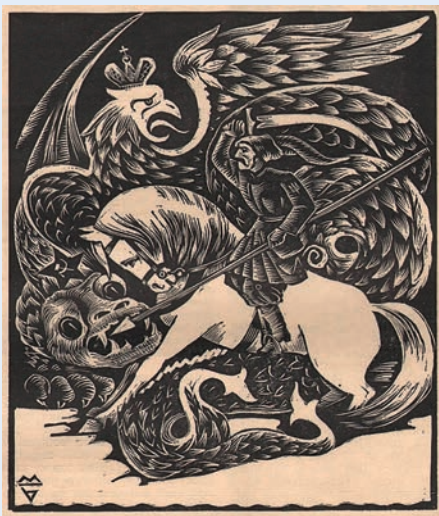
Алегорія боротьби України за незалежність Миколи Битинського. Журнал «Гуртуймося», ч. I (XIII), 1935 р.

Я далекий від героїзації війни. Геройство на ній сусидить з мародерством. Вірність – зі зрадою. Солідарність і взаємодопомога – з совковою бюрократією та дегуманізацією підлеглих. Війна – це кров, каліцтва, депресії, смерть і бруд. Це алкоголь, наркотики та контрабанда. Це те, що політкоректно називають «небойові втрати».