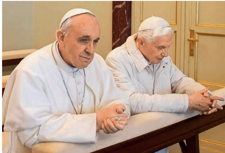
▲ Кастель-Гандольфо п. Риму, 23.03.2013 р. Зустріч Папи Римського Франциска з Папо-емеритом Бенедиктом XVI

Андреа Торніеллі, Редакційний директор Дикастерії в справах комунікації, наводячи думки Папи Франциска щодо целібату, коментує оприлюднені у Франції уривки з книги Папи-емерита Бенедикта XVI та Префекта Конгрегації Божественного Культу і дисципліни Святих Тайн кардинала Роберта Сари про священство.