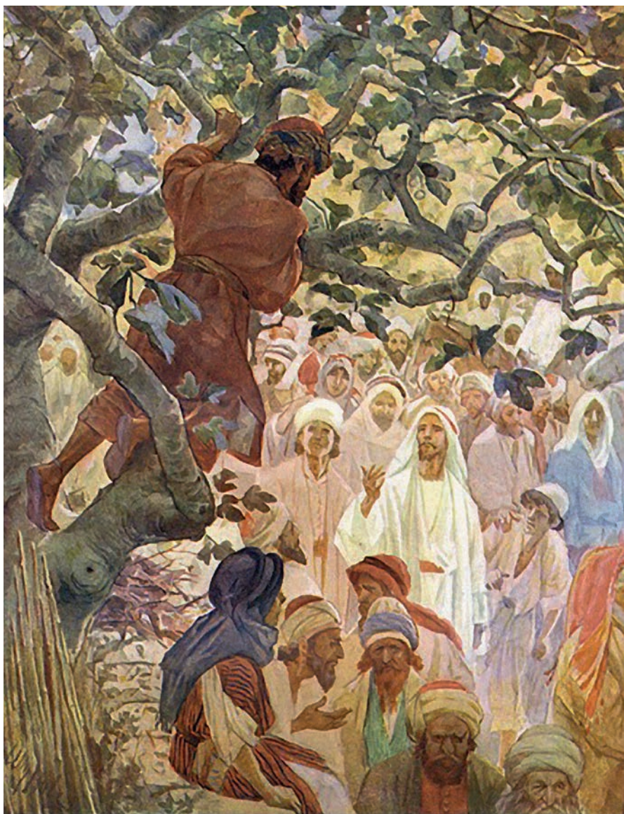
Вільям Гол (1846–1917), «Закхей на смоковниці»

Читанням історії про митаря Закхея свята Церква має намір приготувати нас до особливого часу очищення, покаяння і духовного зросту – Великого Посту.