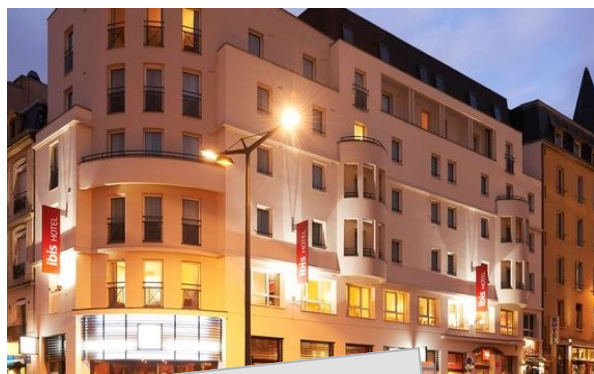
Hôtel Ibis 3 rue de l'Armée Patton 54000 NANCY Tel 03 83 40 31 24

Nous séjournons dans deux hôtels différents : une première nuit à l' Hôtel Ibis de NANCY-Centre , puis 5 nuits à l' Hôtel Campanile de SAINT-MARTIN-SUR-LE-PRE près de Châlons en Champagne.