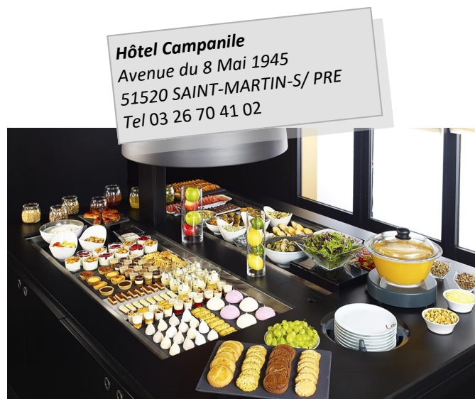
Hôtel Campanile Avenue du 8 Mai 1945 51520 SAINT-MARTIN-S/ PRE Tel 03 26 70 41 02