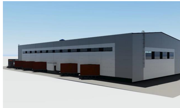
Складские помещения (складской корпус и бытовой блок)