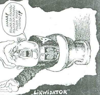
"Likwidator" TEXT i RYSUNKI: ADAM GÓRSKI MAJ 1995