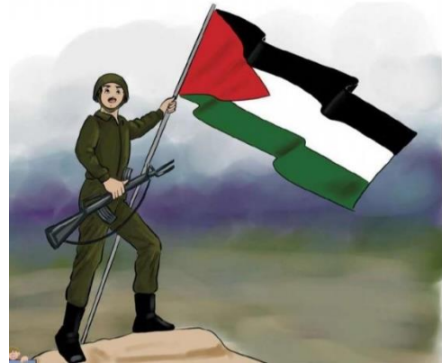
(שפתנו היפה, כתה א', חלק ב' (2019) עמ' 83)

זוהי מלחמה כוללת במטרה להשמיד את מדינת ישראל, שאין לה מקום בפלסטין החופשית, כפי שאנו רואים במוצר הדקורטיבי הנמכר לתיירים בבית לחם ומובא בספר לימוד לכתה ג':