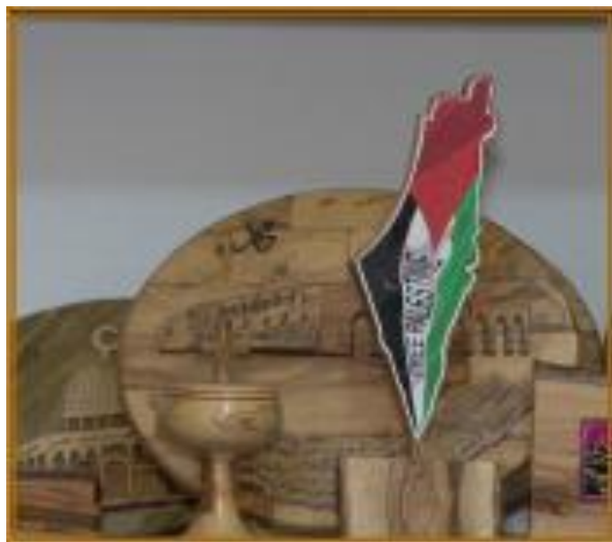
(מדעים וחיים, כתה ג', חלק א' (2019) עמ' 65)

זוהי מלחמה כוללת במטרה להשמיד את מדינת ישראל, שאין לה מקום בפלסטין החופשית, כפי שאנו רואים במוצר הדקורטיבי הנמכר לתיירים בבית לחם ומובא בספר לימוד לכתה ג':