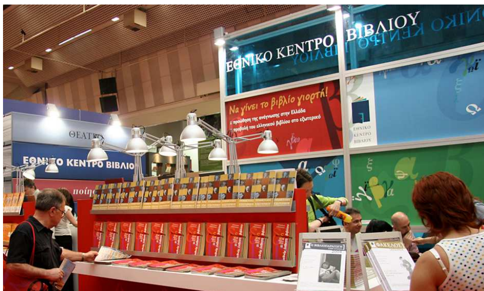
Από τον Τομέα Πολιτισμού του ΠΑΣΟΚ σχετικά με την πολιτική στον χώρο του βιβλίου, εκδόθηκε η ακόλουθη ανακοίνωση: