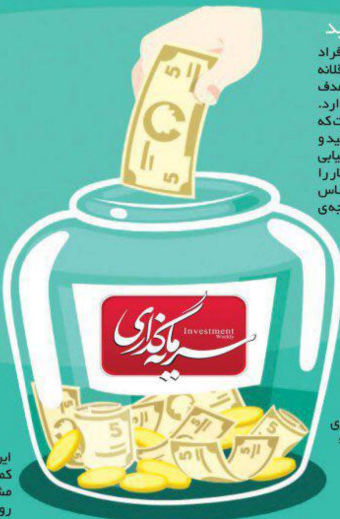
طراح: حسین کریمی

اگر برای اهداف کوتاه مدت سرمایه‌گذاری می‌کنید این روش‌های مطمئن را امتحان کنید: - افتتاح حساب کوتاه مدت عادی - افتتاح حساب بلندمدت که نرخ بهره بالاتری از حساب‌های عادی دارد - برای سرمایه‌گذاری‌های بلندمدت: - خرید بیمه‌های عمر و سرمایه‌گذاری - خرید سهام و اوراق مشارکت