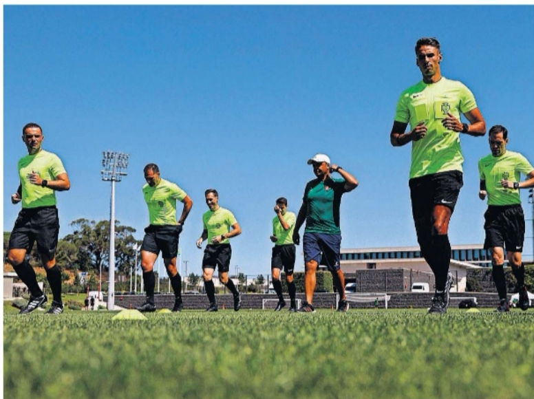
Ação de reciclagem e avaliação dos árbitros CA decorreu durante cinco dias na Cidade do Futebol

Frisando que o setor da arbitragem “nada tem a esconder”, o dirigente, insistindo que não se pretende contribuir para “o nível de ruído”,