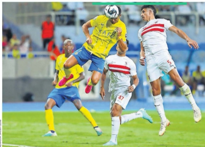
Com uma elevação ao seu estilo, Ronaldo marcou de cabeça o golo decisivo

Foi o segundo golo de CR7 esta época e o 16.º em 22 encontros pela equipa saudita. Em declarações após o encontro, Ronaldo valorizou a evolução do coletivo. "Foi um empate importante. Sabíamos que com o empate nos qualificávamos. Jogámos contra uma