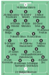
● PONTOS DE JOGO DE 0 A 10.