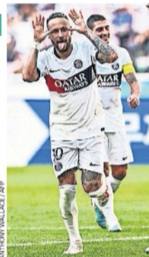
Neymar bisou pelo PSG

É, entretanto, espada hoje a oficialização de Dembélé como reforço do PSG. O extremo foi visto ontem no aeroporto de Barcelona a apanhar um voo privado para Paris, depois de ter ativado a cláusula de rescisão no valor de 50 milhões de euros.