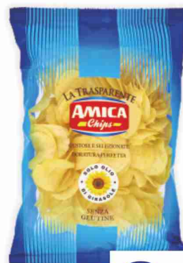
Patina Amica Chips g 190