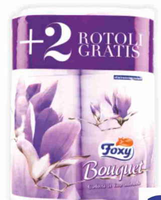
Carta igienica Bouquet Foxy 4 rotoli +2 gratis