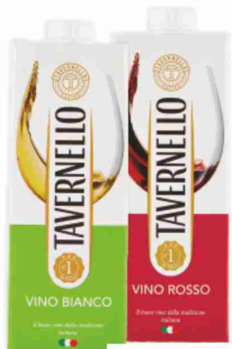
Vino Tavernello bianco, rosso, rosato litri 1