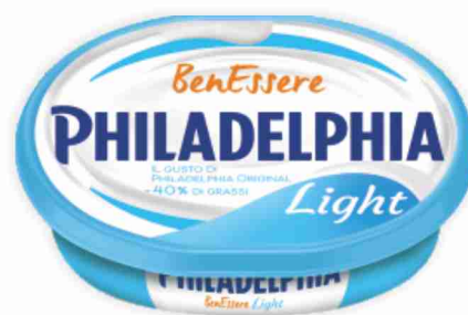
Philadelphia light g 175