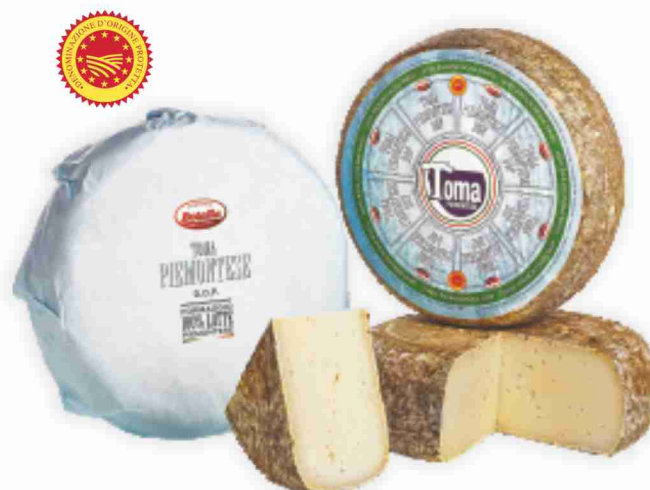
Toma Piemontese D.O.P. Botalla al kg 9,90