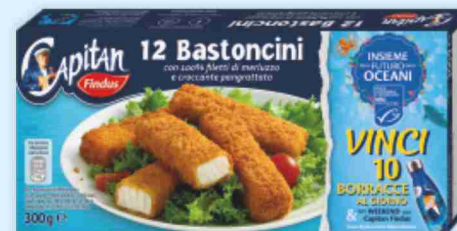
12 Bastoncini di merluzzo Findus g 300