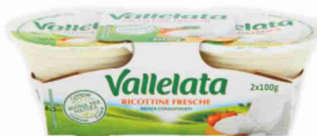
Ricottine fresche Vallelata g 100x2