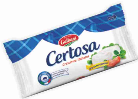
Certosa classica Galbani g 165