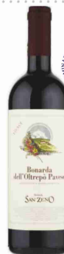
Bonarda Oltrepò Pavese D.O.C. San Zeno cl 75