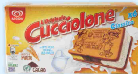
Cucciolone Algida g 480