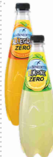
Bevande gassate Zero San Benedetto vari gusti cl 75