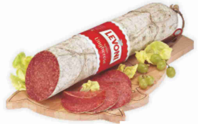
Salame Ungherese Levoni al kg 19,90