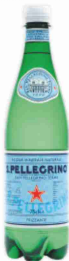
Acqua frizzante San Pellegrino cl 75