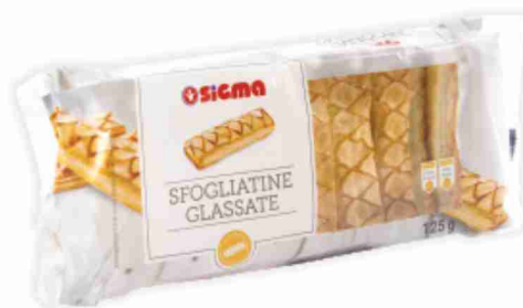
Sfoagliatine glassate, zuccherate g 125