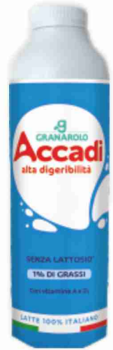
Latte Accadi U.H.T. Granarolo senza lattosio 1% di grassi litri 1