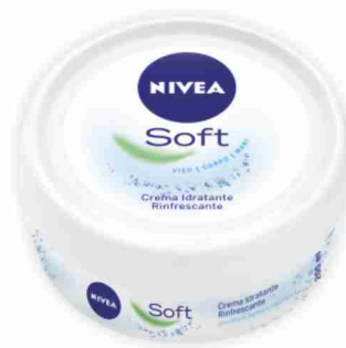
Crema Soft Nivea ml 200