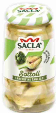
Carciofini tagliati Sottoli Saclà g 285