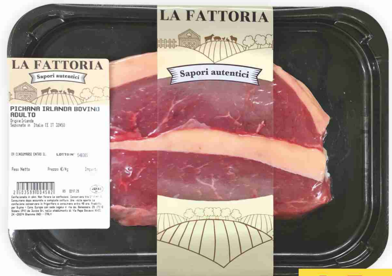
Picanha Irlanda di bovino adulto La Fattoria