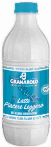
Latte U.H.T. Granarolo piacere leggero litri 1