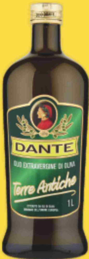
Olio E/Vergine di oliva Dante Terre Antiche litri 1