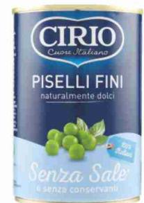
Piselli fini Cirio g 410