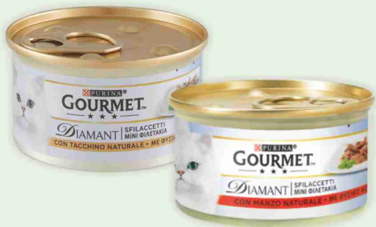
Alimento per gatti Diamant Gourmet vari gusti g 85