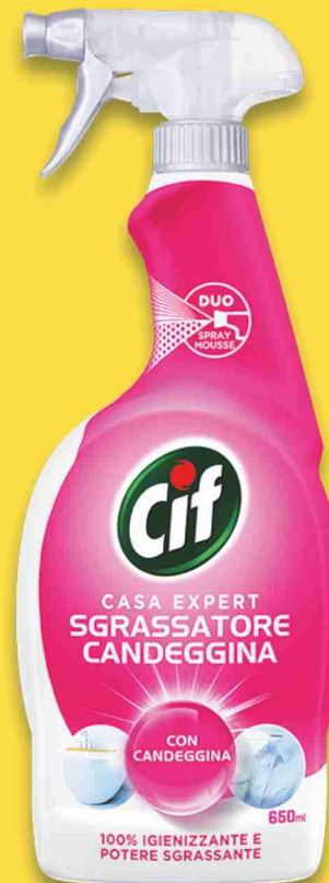
Detergente spray Cif vari tipi ml 650