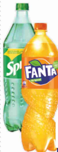
Fanta/Sprite vari tipi litri 1,5