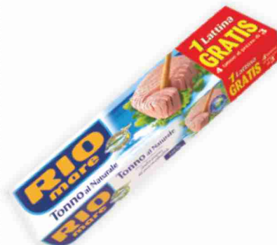
Tonno al natura RIO Mare g 80x3 +1 gratis