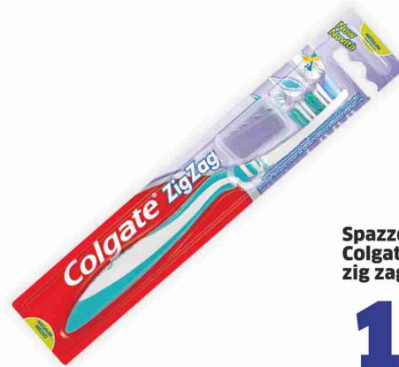
Spazzolino Colgate zig zag flexible