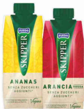
Succhi Skipper vari gusti cl 33