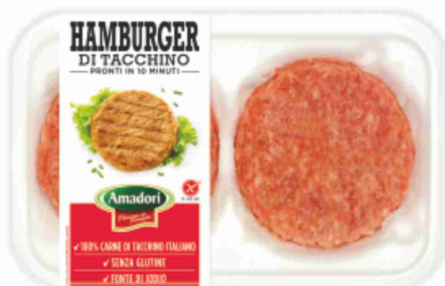
Hamburger di tacchino Amadori g 204