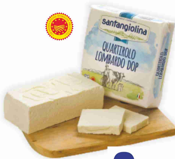
Quartirolo Lombardo D.O.P. Santangiolina al kg 6,90