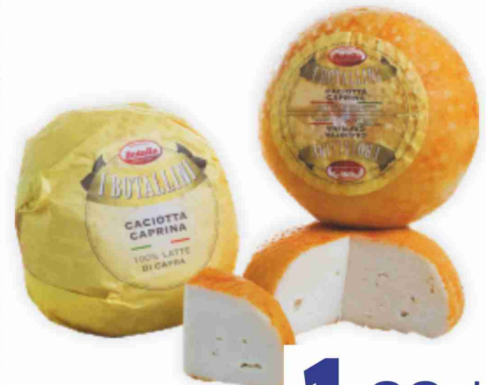
Caciotta caprina Botalla al kg 19,90