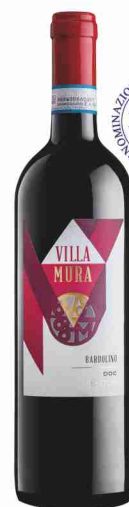
Bardolino D.O.C. Villa Mura Sartori