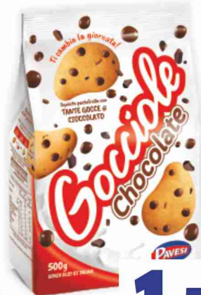
Gocciolate Pavesi cioccolato, extra dark g 500/400