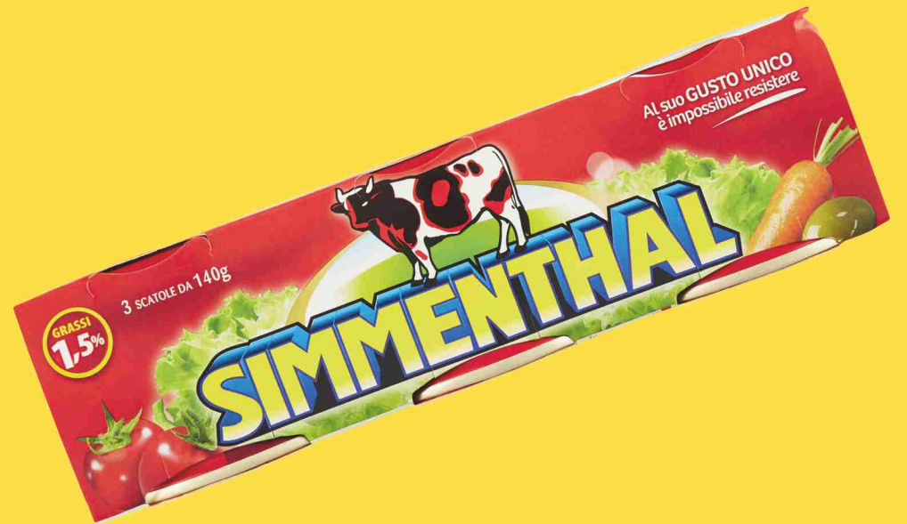
Carne in scatola Simmenthal g 140x3