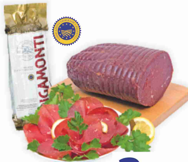
Bresaola della Valtellina I.G.P. Oro Rigamonti al kg 27,90