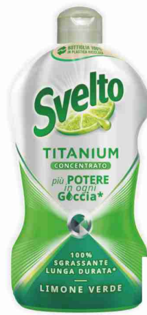
Detersivo piatti concentrato Titanium Svelto vari tipi ml 450