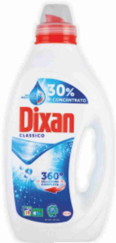
Detersivo liquido Dixan vari tipi 19/18 lavaggi