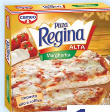
Pizza Regina Alta Cameo margherita g 370