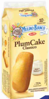
Plumcake classico Mulino Bianco g 330