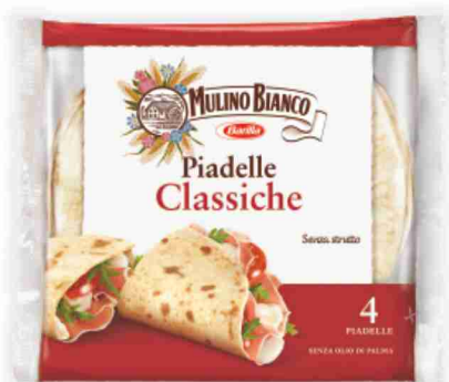
Piadelle Classiche Mulino Bianco g 300