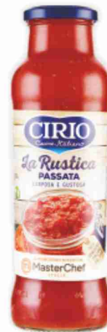
Passata La Rustica Cirio