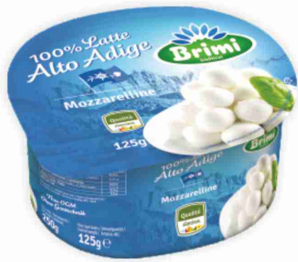
Mozzarelline Brimi g 125