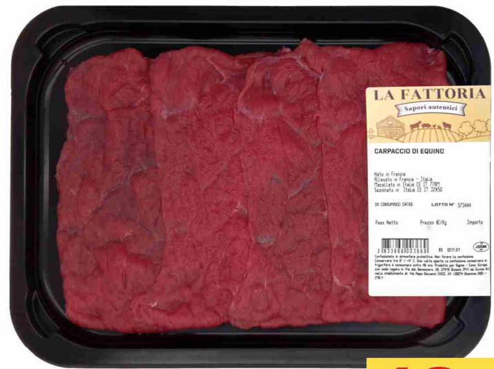
Carpaccio di equino La Fattoria