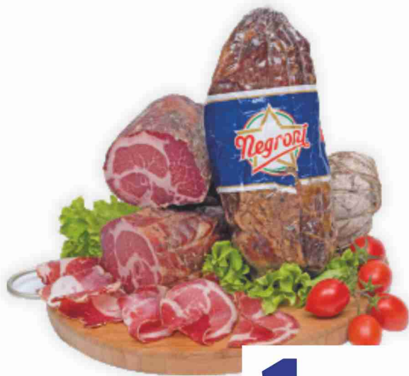
Coppa di Zibello Negroni al kg 19,90