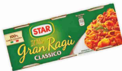
Gran Ragù classico Star g 100x3