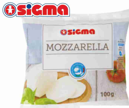
Mozzarella g 100