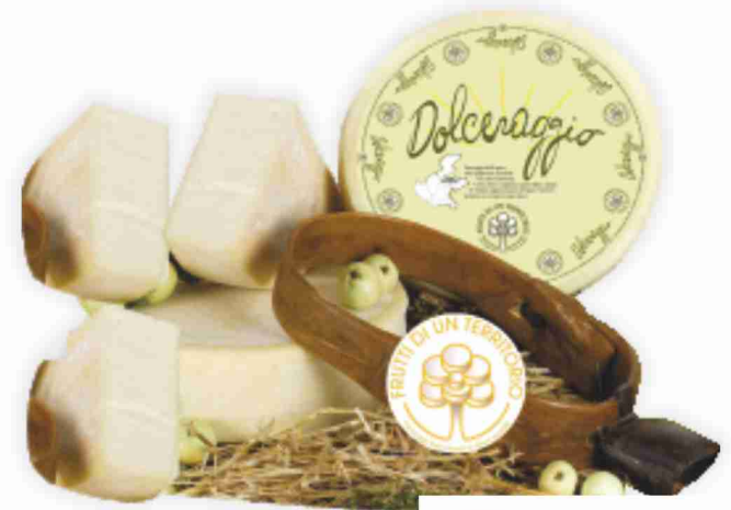
Dolceraggio Centro Veneto Formaggi al kg 7,90