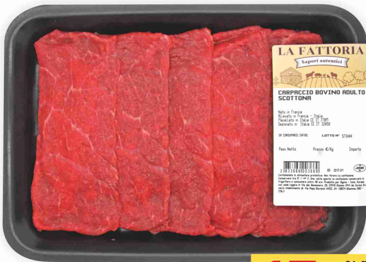
Carpaccio di scottona La Fattoria