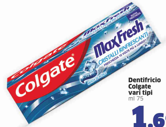
Dentifricio Colgate vari tipi ml 75