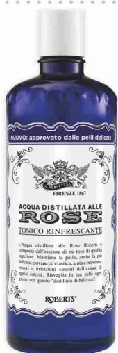
Acqua alle rose Roberts ml 300