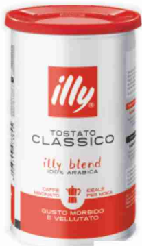
Caffè macinato per moka Illy tostato classico g 200