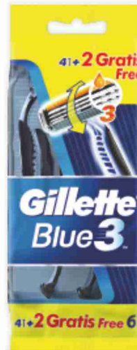
Rasoi usa e getta Gillette Blue 3 pezzi 4+2 gratis