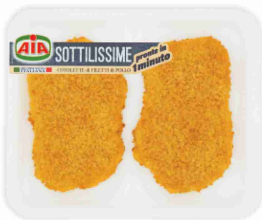
Cotolette di pollo Sottilissime Aia g 140