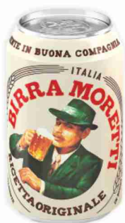
Birra Moretti cl 33