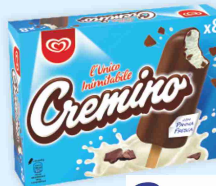
Cremino Algida g 336