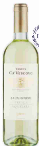
Sauvignon D.O.C. Tenuta Cà Vescovo cl 75