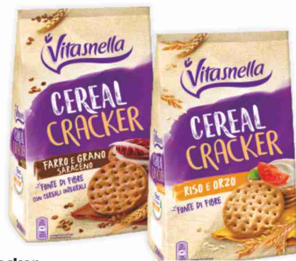
Cracker Vitasnella riso e orzo, farro e grano saraceno g 250/200