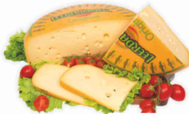
Leerdammer al kg 9,90