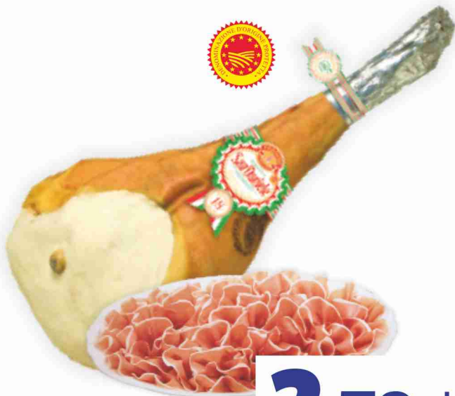
Prosciutto di San Daniele D.O.P. Framon al kg 27,90