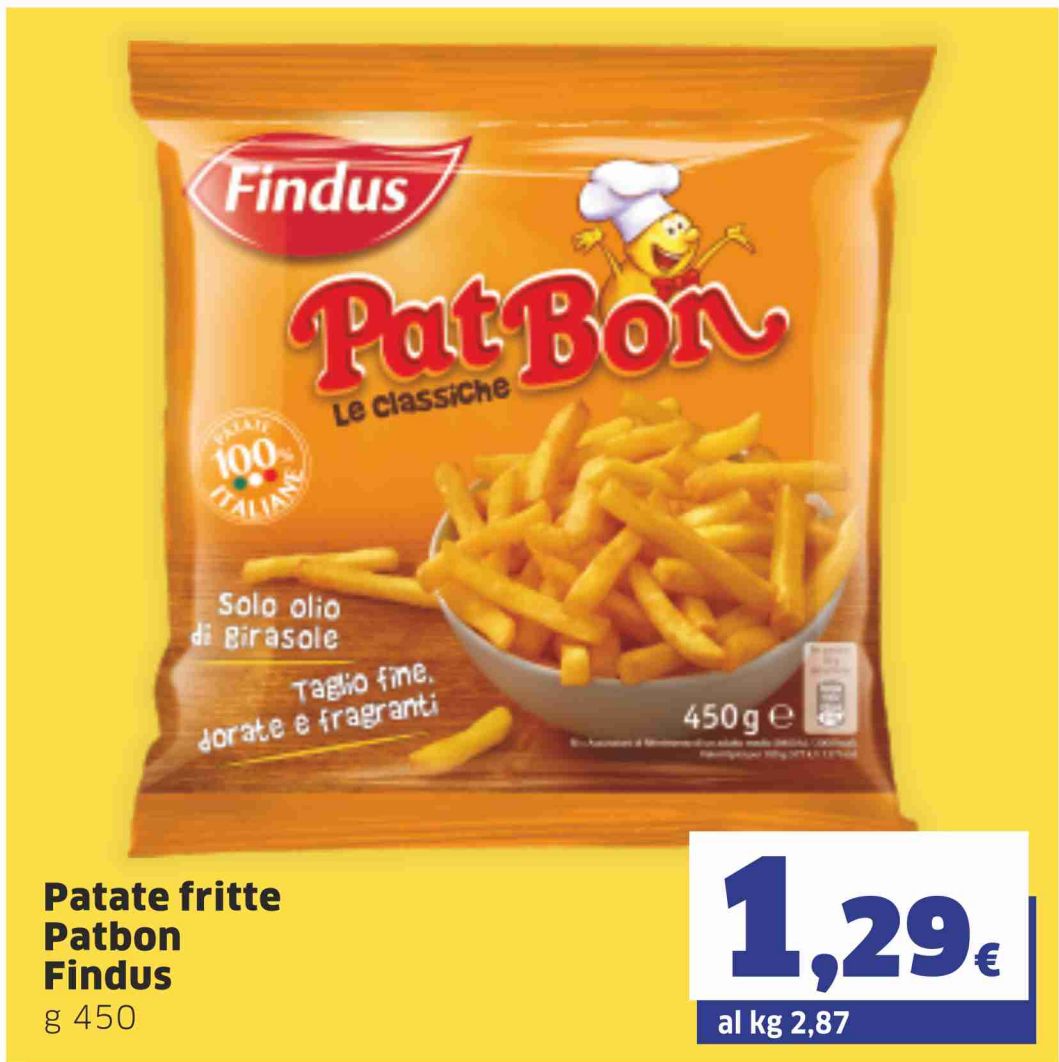
Patate fritte Patbon Findus g 450