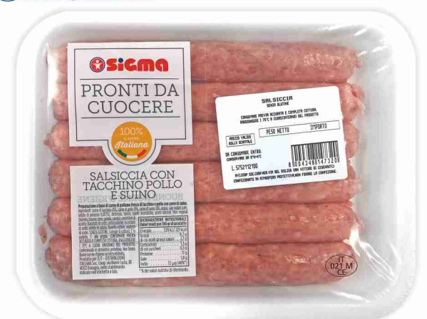
Salsiccia con tacchino, pollo e suino g 430