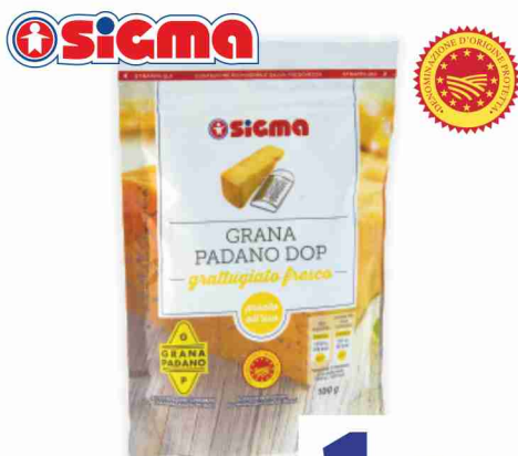
Grana Padano D.O.P. grattugiato g 100