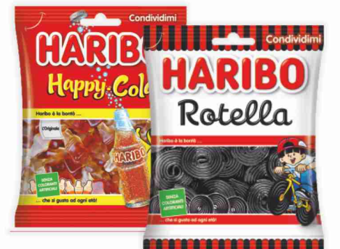
Caramelle Haribo vari tipi g 175