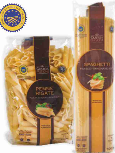
Pasta di Gragnano I.G.P. Gusto & Passione spaghetti, penne rigate, mezze maniche g 500