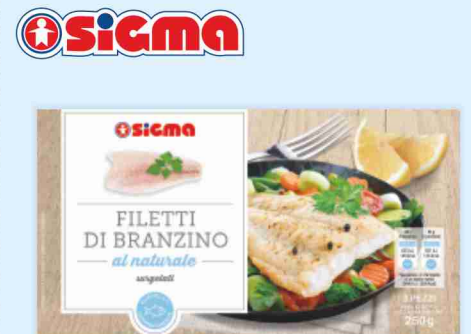
Filetti di pesce branzino, orata g 250