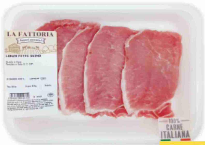
Fettine sottili di lonza La Fattoria g 130