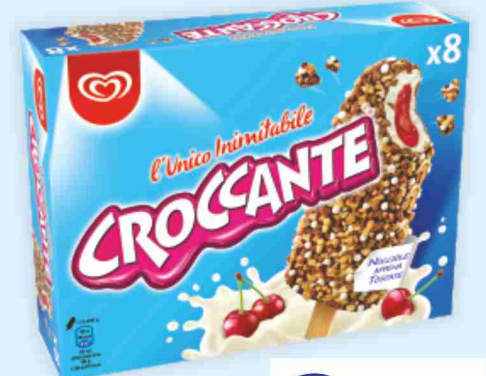
Croccante amarena Algida g 456