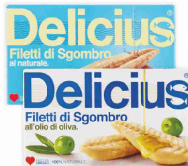
Filetti di sgombrò Delicius all'olio di oliva, al naturale g 125