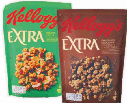
Cereali Extra Kellogg's vari tipi g 375