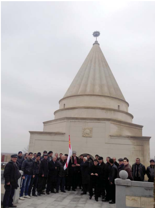
Եզդիական սրբապետի Ակնայիճ գյուղում (Արմավիրի մարզ)

Հայաստանի Հանրապետությունում թվաքանակով երկրորդ ազգը եզդիներն են : Նրանց թիվը 2011 թ. մարդահամարի տվյալներով 35,3 հազ.