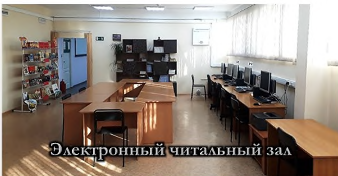
Электронный читальный зал