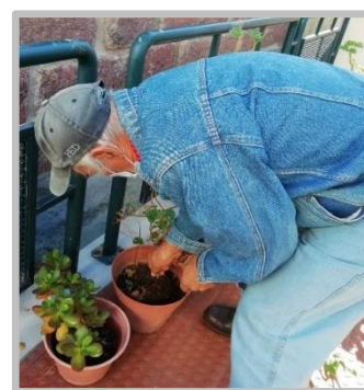
Atelier de Jardinagem