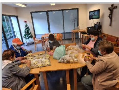
Atelier de Expressão Plástica