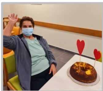
Comemoração de Aniversários