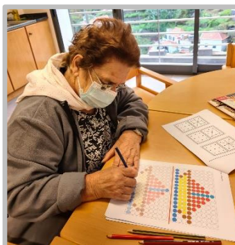
Atelier Saber +