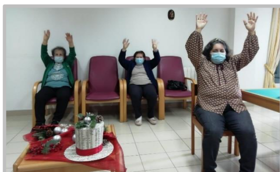
Atelier de Atividade Física