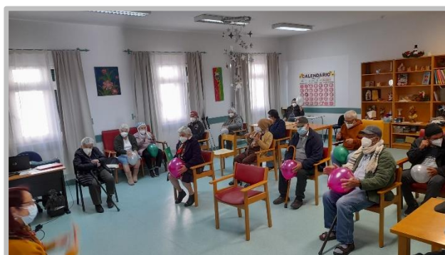
Atelier de Expressão Musical