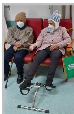
Atelier de Atividade Física