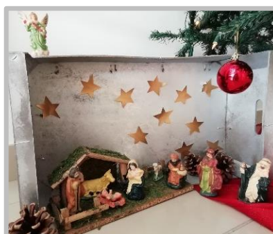
Centro de Convívio da Serra de Água