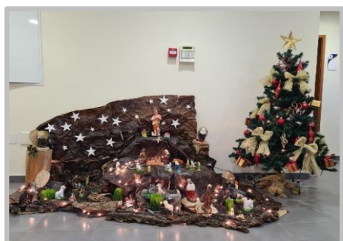
Centro de Convívio da Furna

Pinheirinhos, presépios, estrelas, bolas, anjos e luzinhas... Tudo pensado ao pormenor e o resultado não podia ser melhor... Os Centros ficaram lindíssimos e o espírito natalício invadiu-nos!