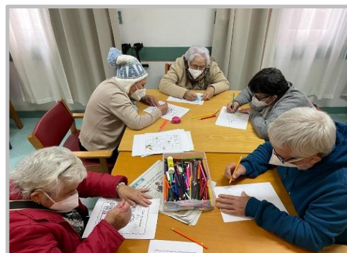
Atelier Saber +