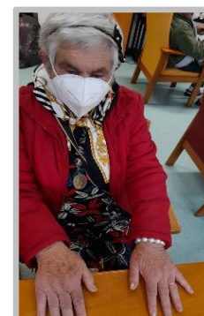
Atelier de Estética