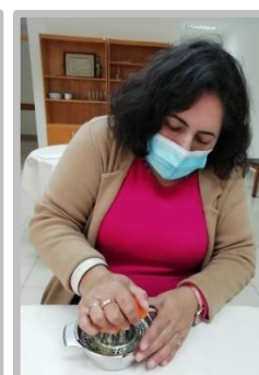
Atelier de Culinária