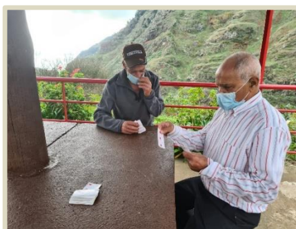
Atividades no exterior