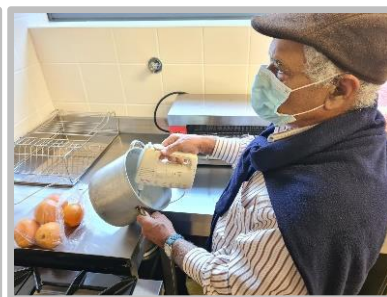
Atelier de Culinária