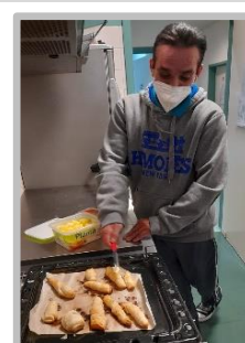
Atelier de Culinária