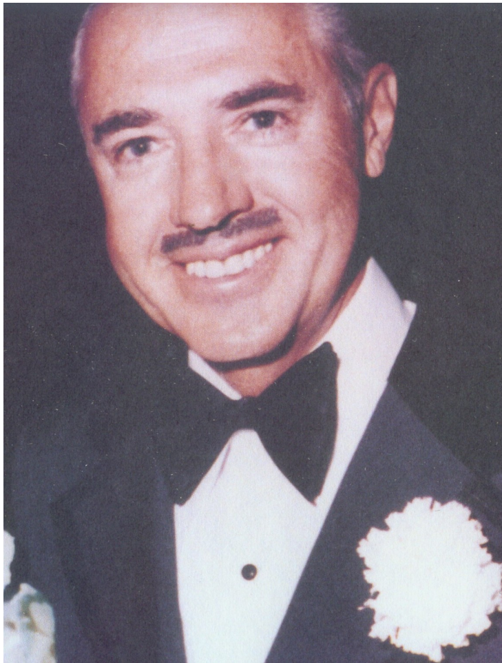
Ben Klassen -55PC / 20AC*.

Bernhard "Ben" Klassen (1918-1993*) a fondé en 1973 une religion pour la Race Blanche, la Créativité. Les trois missions de la Créativité sont :