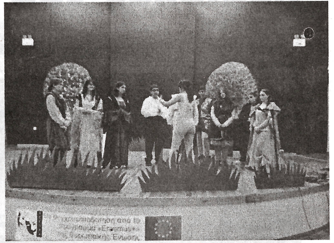
Με συγχρηματοδότηση από το πρόγραμμα «Erasmus+» της Ευρωπαϊκής Ένωσης