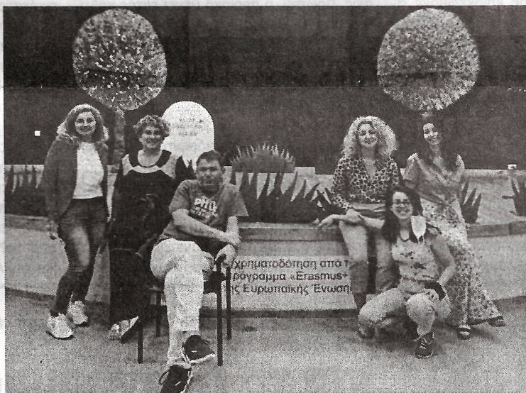
Με συγχρηματοδότηση από το πρόγραμμα «Erasmus+» της Ευρωπαϊκής Ένωσης

Με μεγάλη επιτυχία και ξεχωριστή δεξιοτέτα η θεατρική ομάδα του 2ου Γυμνασίου Ξάνθης, την Τετάρτη 9 Ιουνίου 2021, ερμήνευσε την περίφημη κωμωδία του Σαίξπηρ «Όνειρο Καλοκαιρινής Νύχτας» στο αμφιθέατρο του 3ου Γενικού Λυκείου Ξάνθης. Η παράσταση έλαβε χώρα στο πλαίσιο του προγράμματος "Erasmus+" - "Visualisation of Emotions of Classical Drama" - "A Midsummer Night's Dream" by William Shakespeare.