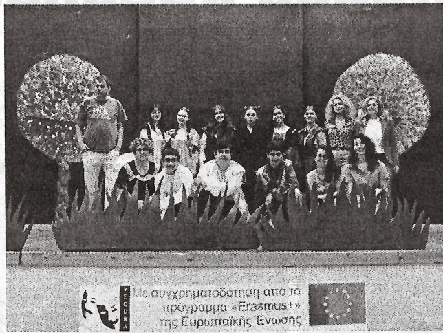
Με συγχρηματοδότηση από το πρόγραμμα «Erasmus+» της Ευρωπαϊκής Ένωσης