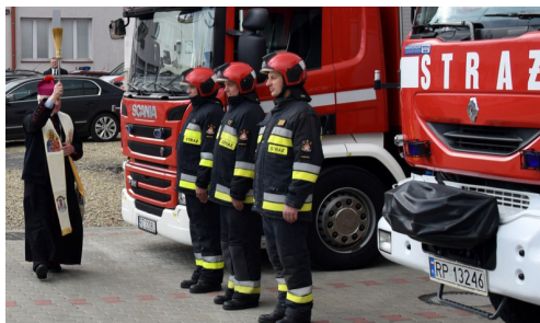
Poświęcenie wozów strażackich w Komendzie Miejskiej Państwowej Straży Pożarnej w Przemyśle, październik 2017 r.