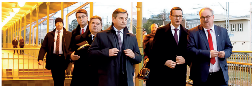
Październik 2019 r., premier Mateusz Morawiecki ogłasza budowę obwodnicy Przemysła

Skutecznie wykorzystujemy pieniądze z Unii Europejskiej dla rozwoju Przemysła i całego Podkarpacia. W latach 2021-2027 do wykorzystania będzie ponad 2,265 mld euro