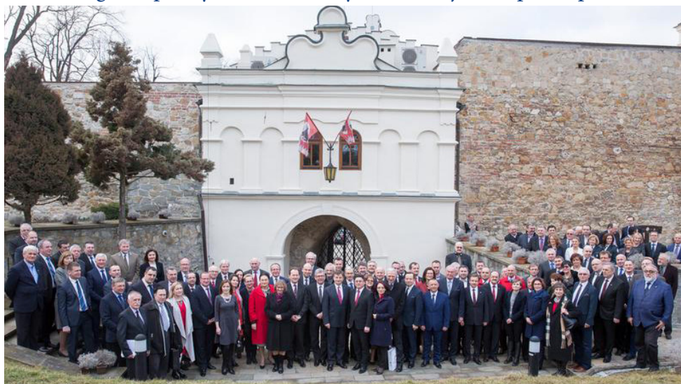
Konferencja Europa Karpat na Zamku Kazimierzowskim w Przemysłu, luty 2016 r.

Dzięki aktywnemu wspieraniu przemyskich inicjatyw o znaczeniu międzynarodowym i ogólnopolskim informacje o nich dotarły do milionów użytkowników mediów klasycznych i elektronicznych. To w Przemysłu organizowane są spotkania na międzynarodowych szczeblach – prezydiów parlamentów (Bundestag, Grupa Wyszehradzka) czy konferencja Europa Karpat.