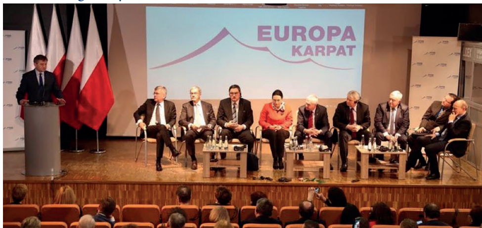
Konferencja Europa Karpat w Muzeum Narodowym Ziemi Przemyskiej, styczeń 2017 r.

Przenosimy realną politykę społeczną i ekonomiczną bliżej ludzi. Miasto i region są więc ważnym podmiotem w oczach ekspertów, a także turystów z Polski i zagranicy