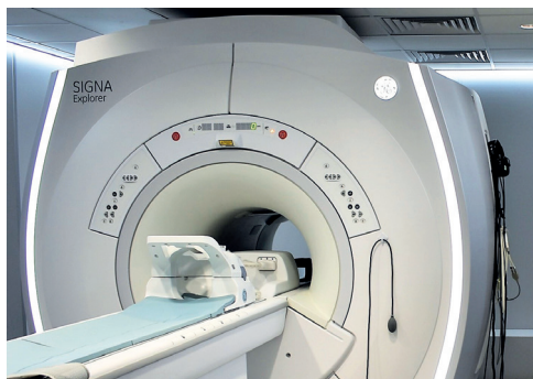
Nowoczesny rezonans w Szpitalu Wojewódzkim im. Św. Ojca Pio

35 mln zł – Szpital Wojewódzki im. Ojca Pio: inwestycje w kompleksową opiekę nad pacjentem kardiologicznym (diagnoza, leczenie, rehabilitacja), nowy oddział rehabilitacji, pododdział kardiologii inwazyjnej, pracownię hemodynamiki i angiologii, kardiochirurgia w Oddziale Kardiologii, prace budowlane na oddziale i bloku operacyjnym, zakup niezbędnego sprzętu i wyposażenia. Ponadto 6,3 mln zł na doposażenie Oddziału Obserwacyjno- Zakaźnego oraz innych oddziałów, jak Oddział Ginekologiczno-Położniczy. W 2021 i 2022 r. wartość inwestycji w przemyskim szpitalu wyniosła ponad 20 mln zł . W przemyskim szpitalu w 2022 r. miało miejsce ok. 20 tys. hospitalizacji mieszkańców miasta