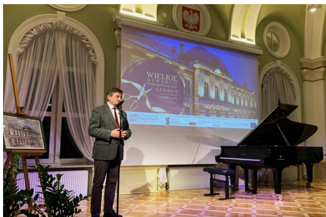
Otwarcie wyremontowanej Szkoły Muzycznej, luty 2023 r.

ok. 27 mln zł – ochrona zabytków, w tym remonty ulic i kamienic oraz prace konserwatorskie przy kościołach – renowacje elewacji, ołtarzy, obrazów (z programów ministerialnych, budżetu Wojewódzkiego Konserwatora Zabytków i województwa)