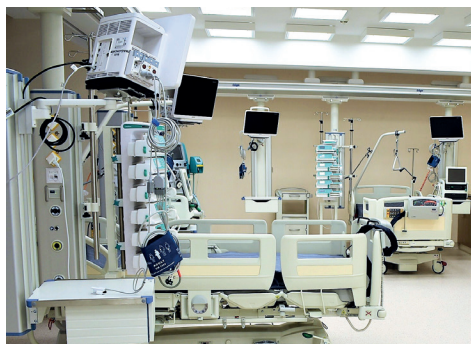
Sala anestezjologii i intensywnej terapii w Szpitalu Wojewódzkim im. św. Ojca Pio

Łączna liczba wizyt przemyslan, m.in. w ramach poradni specjalistycznych, podstawowej opieki zdrowotnej czy opieki nocnej i świątecznej to 122 tys. Stąd planowane kolejne ogromne inwestycje, jak uruchomienie neurochirurgii