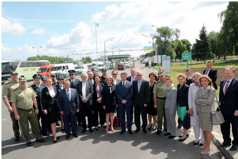
Spotkanie prezydiów Sejmu RP i Bundestagu, przejście graniczne w Medyce, czerwiec 2017 r.

W latach 2015-2023 przez granicę polsko-ukraińską na Podkarpaciu do Polski wjechało 39 mln cudzoziemców