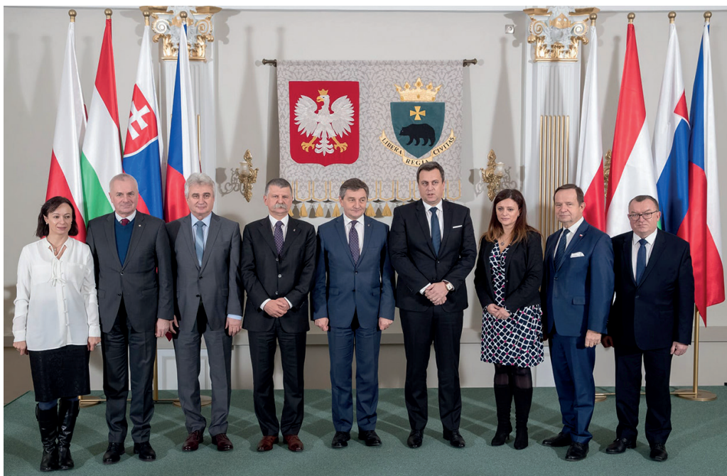
Spotkanie przewodniczących parlamentów państw Grupy Wyszehradzkiej, grudzień 2016 r.