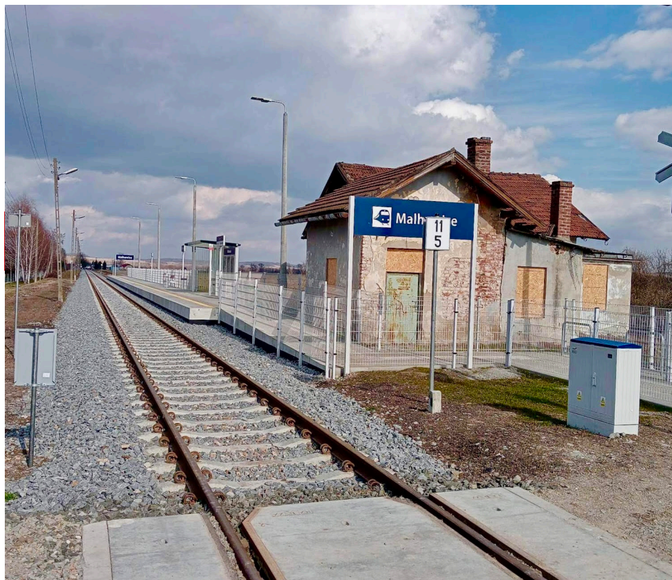
Generalnie odnowiona linia kolejowa 102 z Przemyśla do granicy z Ukrainą

47 mln zł – remont linii kolejowej 102 z Przemyśla do Malhowic oraz budowa kolejowego przejścia granicznego w Malhowicach – efekt wieloletnich starań od lat 90. Powstanie dodatkowo ok. 40 miejsc pracy w administracji skarbowej