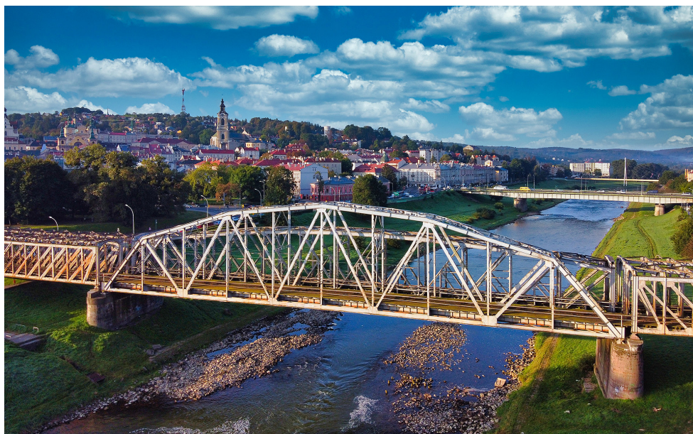
Budowany nowy most kolejowy w Przemysłu

60 mln zł – budowa mostu kolejowego na Sanie w Przemysłu (dla szybkich kolei) pomiędzy dwoma starymi mostami, z zachowaniem zabytkowego krajobrazu miasta. Powstanie kładka pieszo-rowerowa i Muzeum. Działanie to podjęto z inicjatywy posła Marka Kuchcińskiego podczas spotkania u ministra infrastruktury 13 kwietnia 2021 r. Nowy sześcioprzęsłowy most o długości blisko 200 metrów będzie swoim kształtem nawiązywał do dawnej konstrukcji