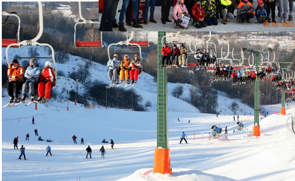
Stok narciarski w Przemysłu

80 tys. zł – wsparcie Klubu Polonia Przemysł