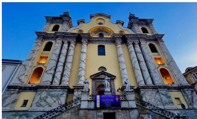
Kościół Ojców Franciszkanów w Przemyślu

5,2 mln zł – z Programu Odbudowy Zabytków na: remont Archikatedry Przemyskiej, Zamku Kazimierzowskiego, I Liceum Ogólnokształcącego, Miejskiego Domu Kultury oraz Starostwa Powiatowego (2023)