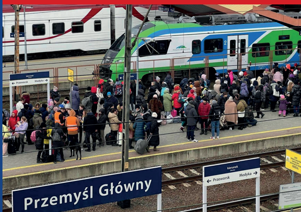
Dworzec kolejowy w Przemysłu – obsługa uchodźców