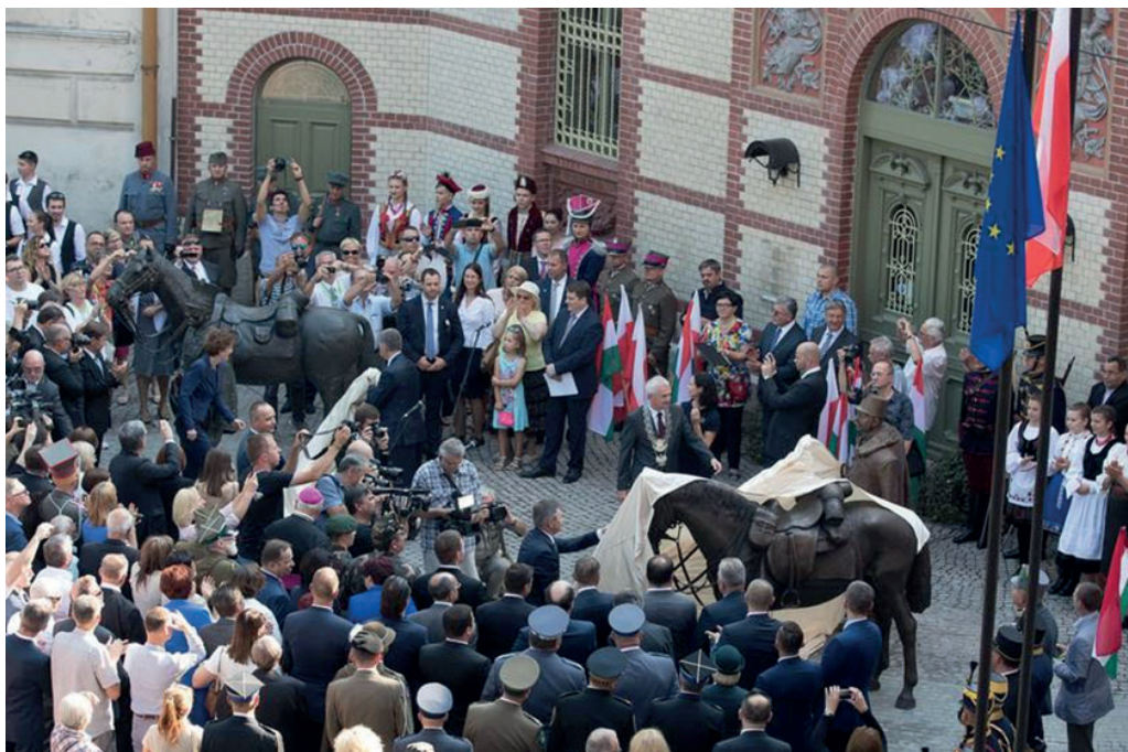
Odsłonięcie pomników ułana i huzara w Przemyślu, wrzesień 2016 r.