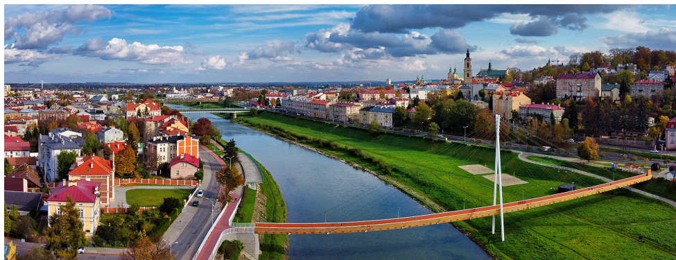
San, kładka rowerowa Green Velo

1,5 mln zł – remont wałów przeciwpowodziowych na Sanie