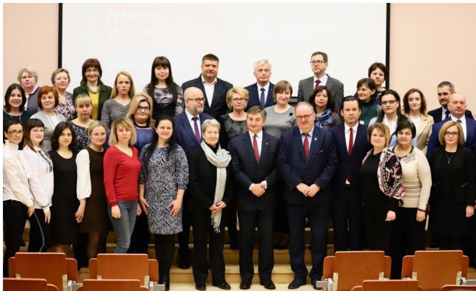
PWSW: I Kongres Polskiej Oświaty na Ukrainie, marzec 2019 r.

22 mln zł – inwestycje w Państwowej Akademii Nauk Stosowanych (do 2022 Państwowa Wyższa Szkoła Wschodnioeuropejska): wyposażenie pracowni w Instytucie Nauk Technicznych oraz Instytucie Sztuk Projektowych, adaptacja pomieszczeń, przebudowa poddasza Domu Studenta, zwiększenie dostępności e-usług, poprawa jakości kształcenia, zakup nowoczesnego wyposażenia