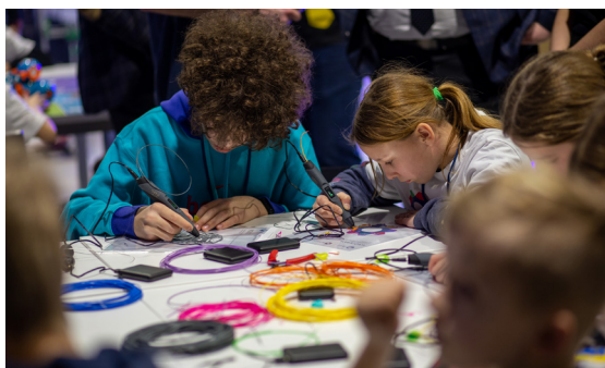
Zajęcia z rządowym programem Laboratoria Przyszłości

przeznaczyliśmy na pomoc polskim rodzinom, wsparcie dla dzieci – 500 plus – i seniorów – wypłatę 13. i 14. emerytury dla wszystkich emerytów i rencistów, dofinansowanie posiłków w szkołach i dowożonych do osób starszych oraz zabezpieczenie Polaków przed podwyżkami