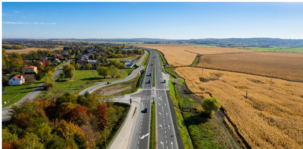
Rozbudowana droga krajowa 28 Przemyśl-Medyka

72 mln zł – z Programu Inwestycji Strategicznych PiS: