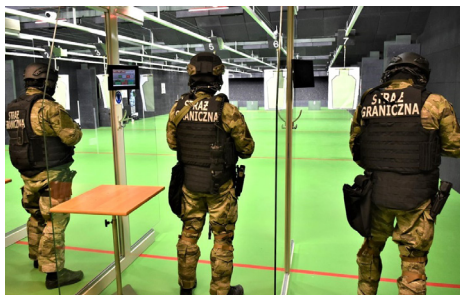
Strzelnica w Bieszczadzkiem Oddziale Straży Granicznej, luty 2020 r.

w urzędach i skuteczną walkę z mafiami VAT-owskimi. Rozwinęliśmy e-administrację (usługi, dokumenty, rozliczanie PIT)