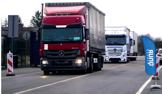
Przejście graniczne Malhowice-Niżankowice otwarte dla pojazdów ciężarowych

105 mln zł – budowa przejścia granicznego Malhowice-Niżankowice, o które starania trwały od lat 90., a nasiliły się od 2001 r., gdy Marek Kuchciński został posłem na Sejm RP. Przejście (otwarte 13.02.2023 r., dla ruchu ciężarowego) zapewni 21 miejsc pracy, a w pełnym wymiarze (ruch osobowy i towarowy) – 100 etatów