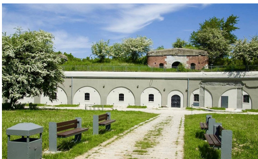
Fort XI Duńkowiczki