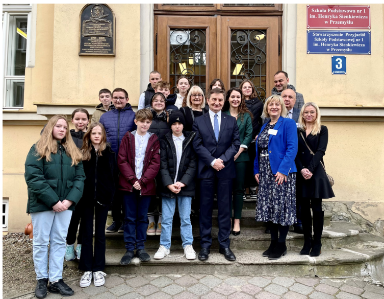
Wizyta ministra Marka Kuchcińskiego w Szkole Podstawowej nr 1 im. Henryka Sienkiewicza, luty 2023 r.

9,5 mln zł – wyprawka szkolna dla ok. 6 tys. uczniów rocznie (2018-2022)