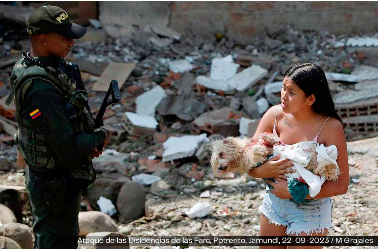
Ataque de las Disidencias de las Farc, Pptrerito, Jamundí, 22-09-2023