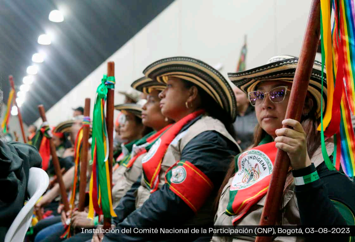
Instalación del Comité Nacional de la Participación (CNP), Bogotá, 03-08-2023

palabras prestadas ocultan verdaderos propósitos colonialistas que perviven, por eso el llamado "desarrollo" es lógica impositiva, se hace ver benefactor, que lo es esencialmente para los grandes poderes nacionales e internacionales, pero que continúan reproduciendo en las comunidades pobreza, exclusión y un cúmulo de injusticias. Lo que se garantiza a plenitud es híper-acumulación de riquezas en el 1% de híper-ricos.