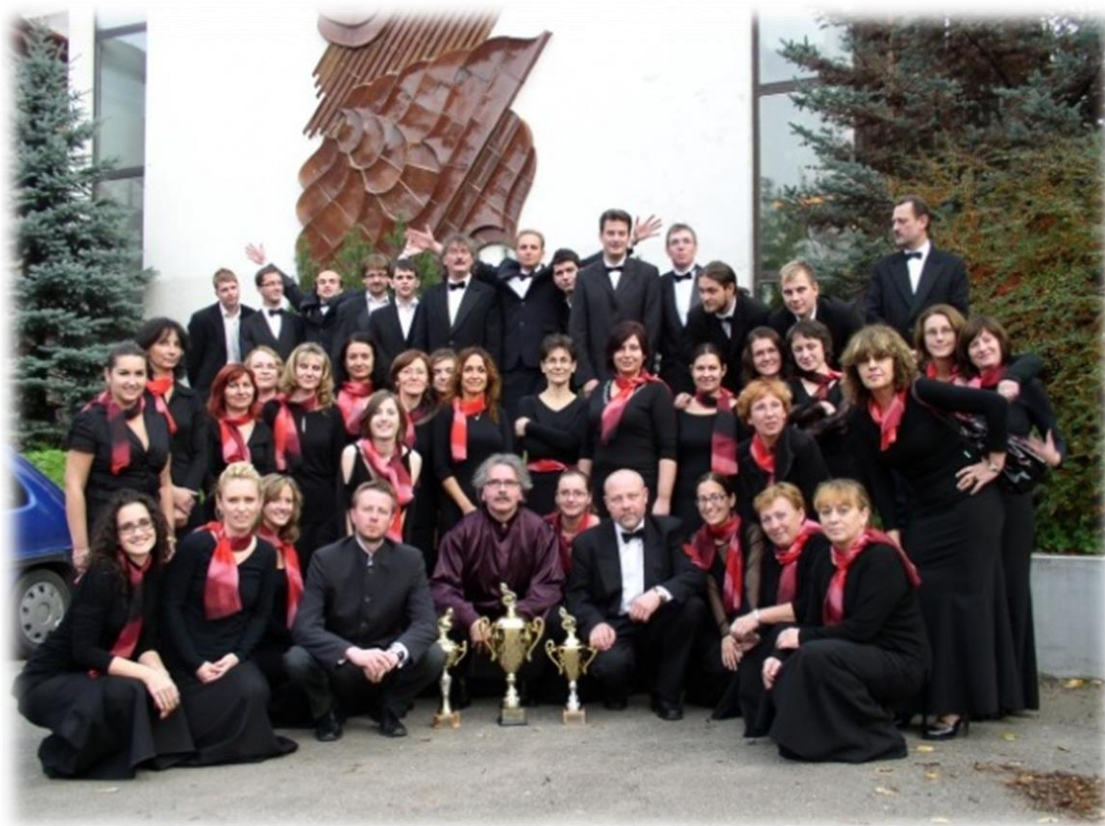
Žilinský miešaný zbor v Poľsku (2008)

Collegium Musicum z Martina, Schola Academica z Budapešti, Zespól wokálny Unanie z poľského Rzeszowa, Štátny komorný orchester a ďalší.